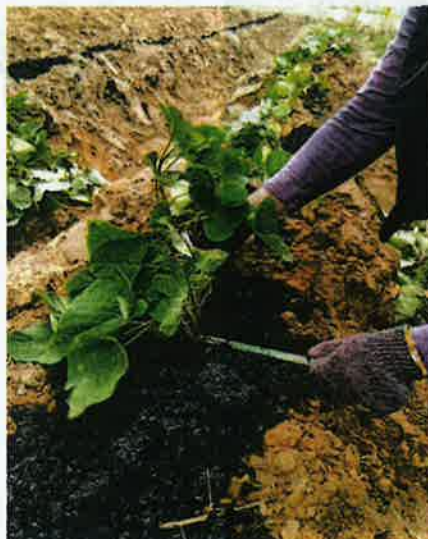
MUDAH diurus dengan kos yang murah.