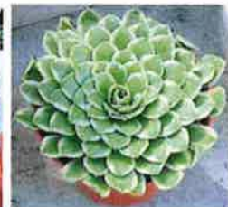
青紫法师为法师第三仙，外表冰清玉洁。