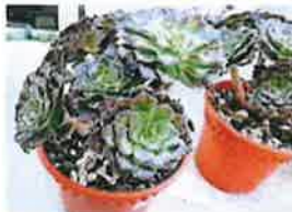
红紫法师为法师中的第一仙，颜色翠绿。