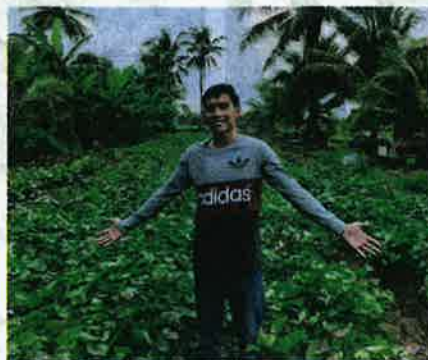
BANGGA usaha membuah hasil.

"Melihat potensi yang besar terhadap tanaman itu, saya cuba tanam