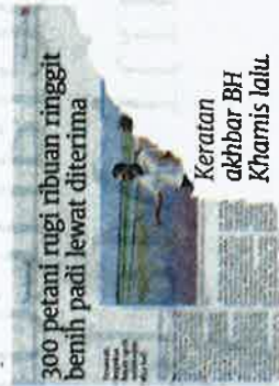
300 petani rugi ribuan ringgit benih padi lewat diterima

Beliau mengulas laporan BH yang mendedahkan lebih 30,000 pesawah di empat kawasan Lembangan Kemajuan Pertanian Muda