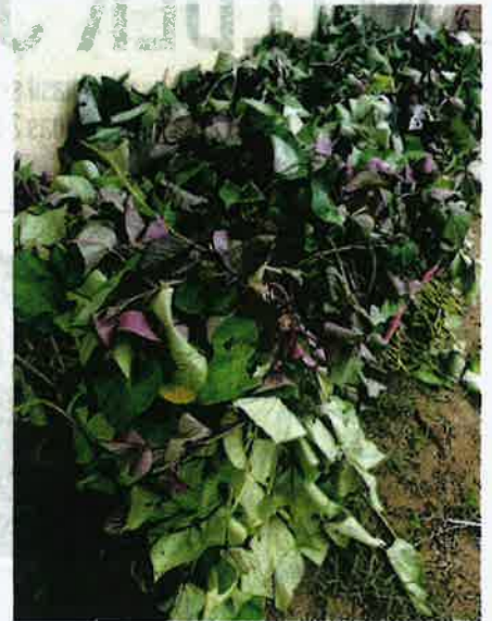
BENIH daripada karatan menjalar.

Ditanya perancangan masa hadapan, Muhamad