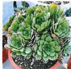
蓝紫法师为法师中的第二仙，依其颜色神秘绚丽又多变。