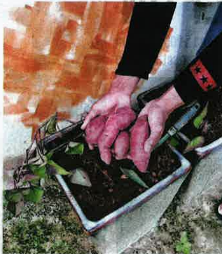
UBI keledak Jepun.

"Setiap pokok mampu hasilkan 10 hingga 20 benih yang boleh digunakan untuk penanaman peringkat seterusnya atau dijual," katanya.