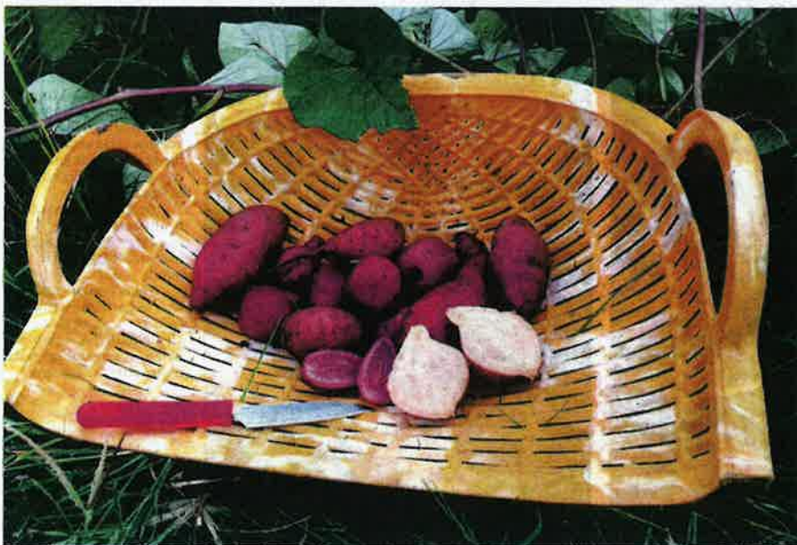
MENDAPAT permintaan tinggi di pasaran.

"Oleh itu, saya mengalu-alukan lebih ramai untuk mengusahakan ubi keledak Jepun untuk menjana pendapatan lumayan," katanya.