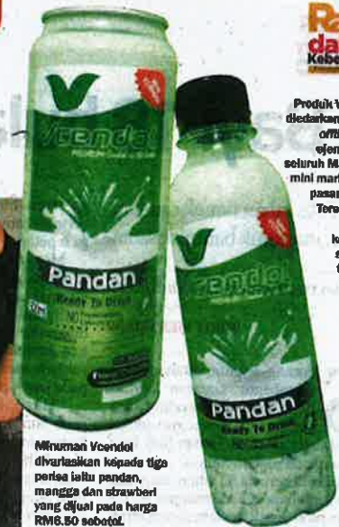
Minuman VCendol divariasikan kepada tiga perisa iaitu pandan, mangga dan strawberi yang dijual pada harga RM6.50 sebotol.

Produk VCendol diedarkan secara offline oleh ejen-ejen di seluruh Malaysia, mini market dan pasar raya di Terengganu serta koperasi sekolah terpilih.