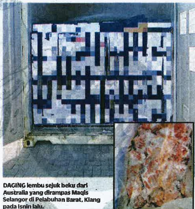
DAGING lembu sejuk beku dari Australia yang dirampas Maqis Selangor di Pelabuhan Barat, Klang pada Isnin lalu.

"Jika sabit kesalahan boleh didenda tidak melebihi RM100,000 atau dipenjarakan sehingga enam tahun atau kedua-duanya," ujarnya.