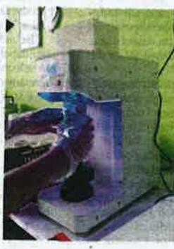
Salah satu proses yang dilakukan sebelum produk VCendol dijual di pasaran luar.