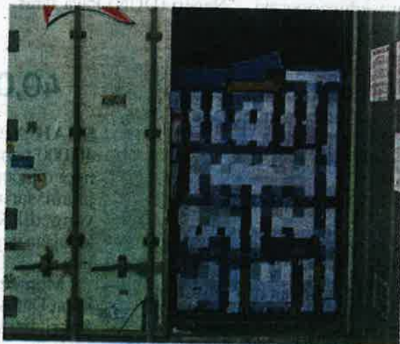
Maqis merampas lebih 25 tan daging lembu sejuk beku dalam sebuah kontena dari Australia di Pelabuhan Klang Barat pada Isnin.

"Maqis sentiasa melakukan pemeriksaan di setiap pintu masuk negara bagi memastikan tumbuhan, haiwan, karkas, ikan, keluaran pertanian dan mikroorganisma yang diimport ke negara ini bebas ancaman perosak, penyakit dan bahan cemar, serta mematuhi peraturan ditetapkan kerajaan," katanya.