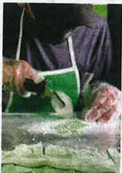
Penyediaan cendol dilakukan dengan sangat teliti.