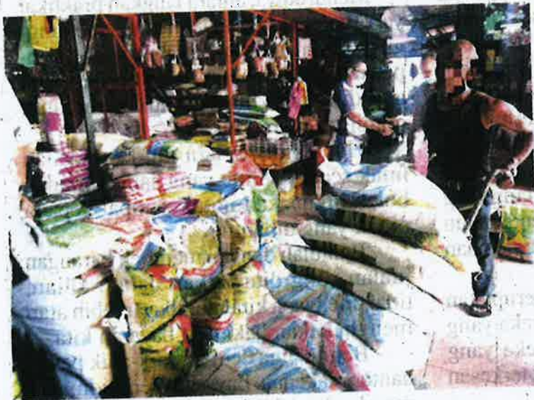
Suasana meriah di bahagian menjual beras di Pasar Besar Siti Khadijah, Kota Bharu dengan bekalan beras Siam yang banyak baru sampal.

“Selepas pengumuman total lockdown , jumlah jualan meningkat kepada lebih 10 kampak sehari,” ujarnya.