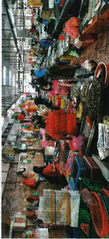
Ikan, udang dan sotong antara barang basah yang mendapat permintaan tinggi pengguna untuk menghadapi lockdown .

"Sejak kerajaan umum ( lockdown ), pelanggan memang ramai. Kebanyakan mereka