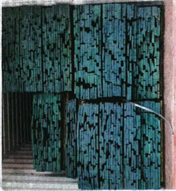
Produk kayu sudah digergaji dirampas Maqis kerana menggunakan permit tamat tempoh di Pelabuhan Tanjung Pelepas, Johor Bahru pada Jumaat.

"Kesemua produk kayu tersebut ditahan untuk tindakan lanjut. Kes disiasat di bawah Seksyen 11 (1) Akta Perkhidmatan Kuarantin dan Pemeriksaan Malaysia 2011 [Akta 728] kerana mengimport