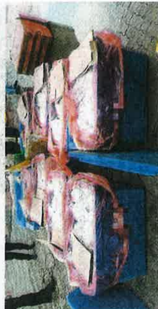
Produk kayu (gambar atas) dan ikan tanpa permit import dirampas di Pelabuhan Pasir Gudang, Kelantan.