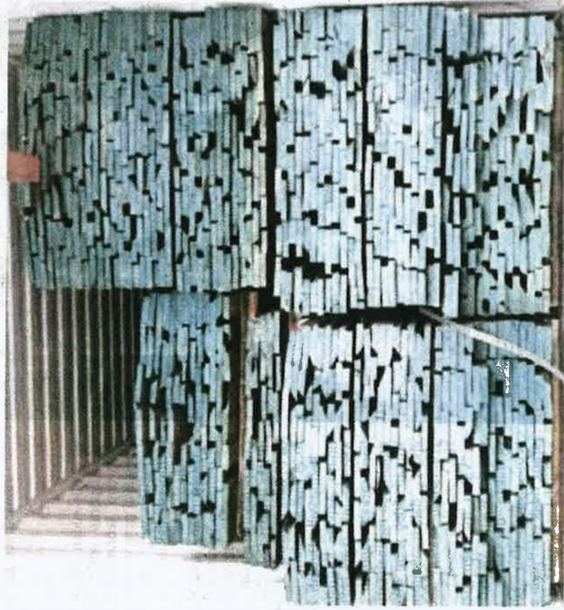
MAQIS merampas produk kayu sudah digergaji dari Kanada kerana menggunakan permit tamat tempoh.