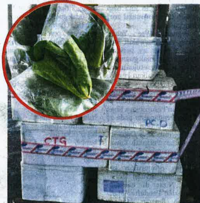
KOTAK berisi sayur kailan (gambar kecil) yang dirampas Maqis.

Sehubungan itu, pihak Maqis sentiasa memantau dan memeriksa setiap keluaran pertanian di pintu masuk negara untuk memastikan keluaran pertanian yang diimport dan diekspor mematuhi syarat dan peraturan yang ditetapkan.