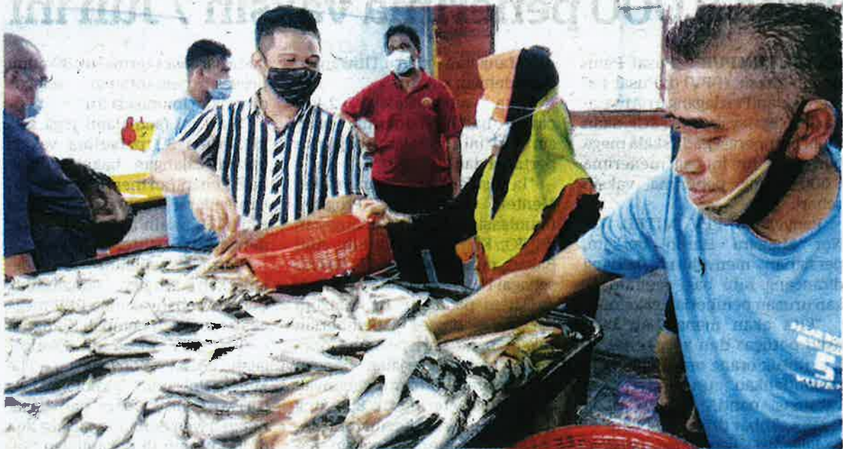
BEKALAN Ikan dan keperluan makanan yang lain dijamin cukup sepanjang PKP penuh bermula hari ini. – GAMBAR HIASAN

"Berdasarkan data bekalan komoditi ternakan dijangkakan bekalan daging, ayam, telur dan susu juga cukup untuk keperluan negara," jelasnya.