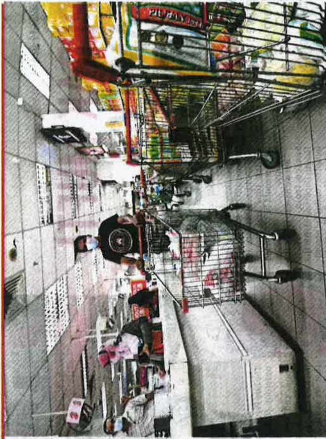
People shopping for necessities at a supermarket in Kuala Terengganu yesterday in preparation for the 14-day lockdown beginning today.

"Rice distribution at the wholesale and retail levels is permitted