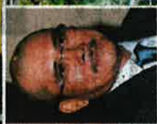
MAFI memastikan rangkaian dan rantaian bekalan makanan di Malaysia kekal berada di tahap stabil, mencukupi serta terkawal, selain akses yang sentiasa tersedia kepada orang ramai sepanjang tempoh pelaksanaan PKP penuh. Gambar kecil: Ronald Kiang

ikan negara pula berjumlah 185,000 tan metrik sebulan berbanding keperluan semasa sebanyak 155,000 tan metrik sebulan.