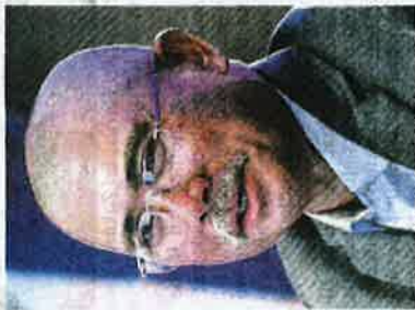
Datuk Seri Dr. Ronald Khande

Khande said for rice supply, it was estimated that the public would need between 100,000 and 150,000 metric tonnes during the 14-day lockdown.