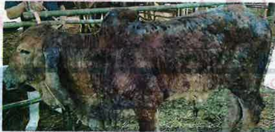
Keadaan lembu yang dijangkiti LSD.