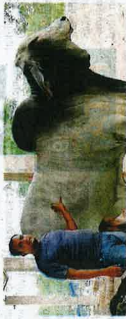
Harkki menunjukkan antara lembu yang dipelihara di ladang syarikatnya di Rantau Panjang.

RANTAU PANJANG - Syarikat Ladang Lembu Kelantan (HBA Farm) mengesahkan pihaknya sudah menghentikan import lembu dari Thailand susulan penularan penyakit kulit berbonjol di negara jiran itu.