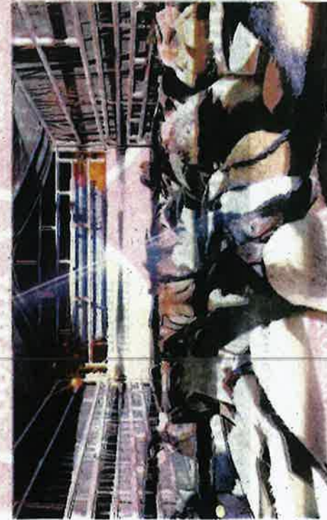
SEBANYAK 50 ekor kambing yang dipercayai diseludup dirampas oleh PCA di Kampung Jubakar, Tumpat semalam.