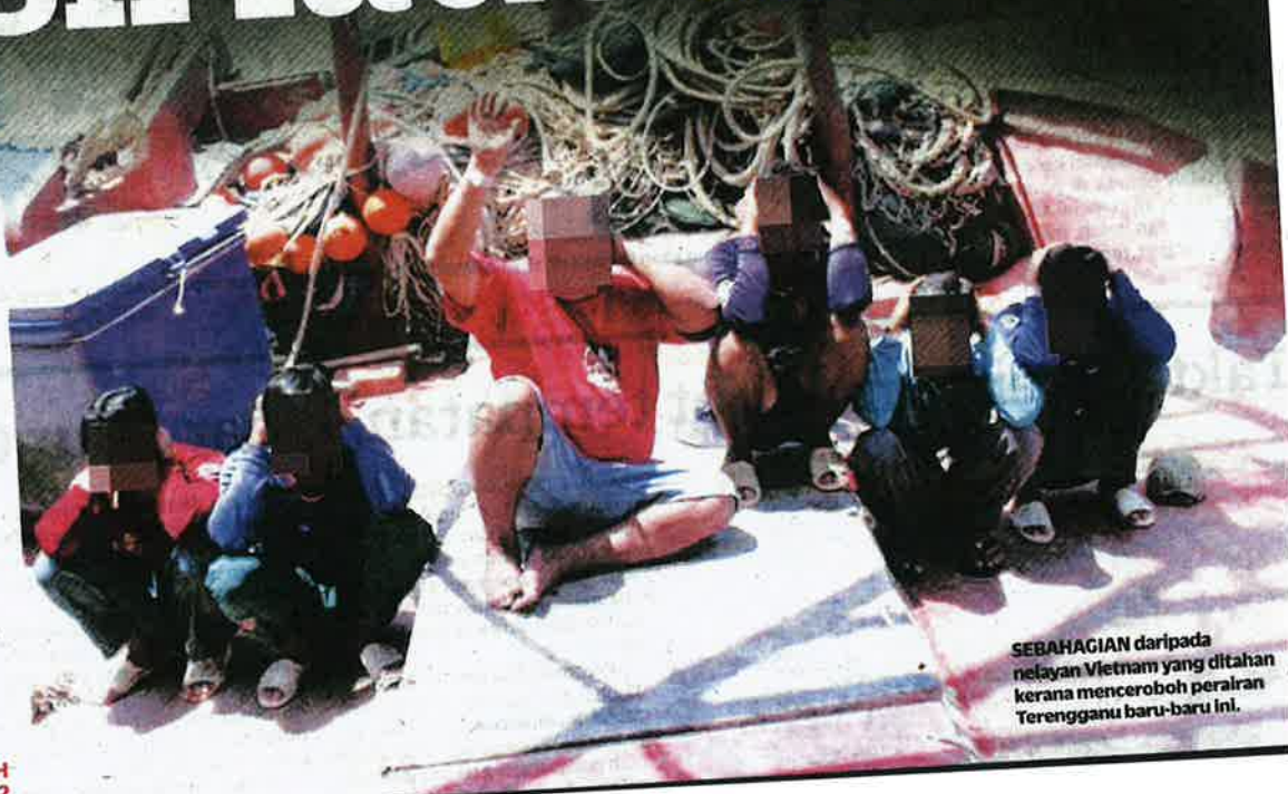
SEBAHAGIAN daripada nelayan Vietnam yang ditahan kerana menceroboh perairan Terengganu baru-baru ini.