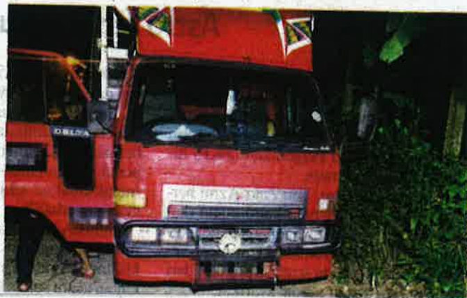
Suspek berusia 47 tahun ditahan oleh PGA Battalion 7 di Tumpat kerana membawa muatan kambing yang dipercayai diseludup dari negara jiran.

"Semasa polis menghampiri, mereka bertindak melarikan diri dengan menaiki perahu ke arah negara jiran, Thailand manakala selebihnya melarikan diri menggunakan kereta tersebut," katanya.