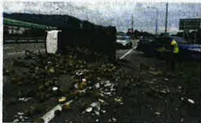
Buah durian bertaburan di atas jalan selepas lori muatan raja buah itu terbabas dan terbalik di KM 279.9 Lebuhraya Utara - Selatan (arah utara) pada Rabu.

"Akibat kemalangan, pemandu lori dan seorang kelindan