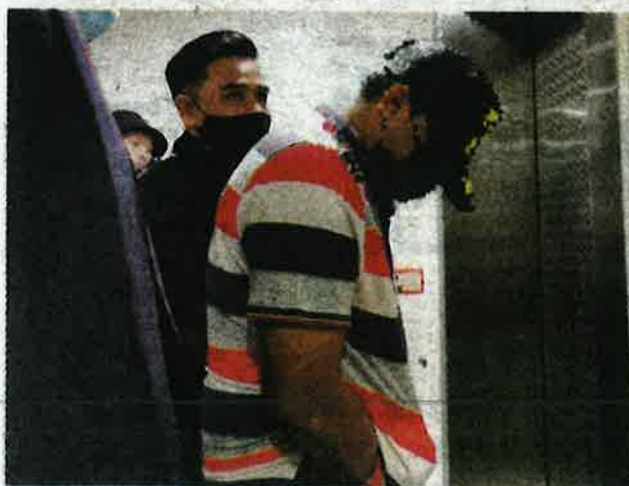
Tertuduh (kanan) dihadapkan ke Mahkamah Sesyen Kuala Terengganu.

Selain itu, tertuduh juga diarahkan melapor diri ke pejabat SPRM setiap 1 haribulan pada setiap bulan dan menyerahkan pasport antarabangsanya kepada mahkamah.