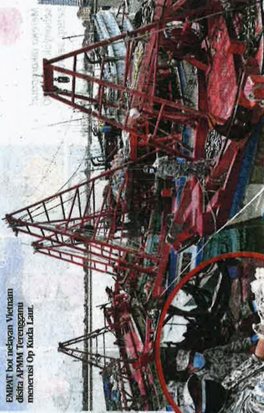
EMPAT bot nelayan Vietnam disita APMM Terengganu menerusi Op Kuda Laut.

"Rondaan dan permantauan akan terus dipertingkatkan bagi mencegah sebarang aktiviti yang menyalahi undang-undang maritim," katanya.