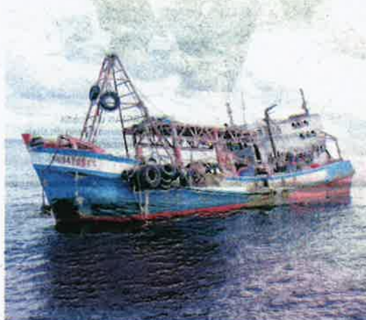
SALAH sebuah bot nelayan Vietnam yang disita kerana menceroobh perairan negara.

KUALA TERENGGANU – Menyamar sebagai bot tempatan dengan menggunakan nombor patil atau pendaftaran palsu merupakan modus operandi yang sering digunakan oleh nelayan Vietnam untuk menceroobh perairan negara.