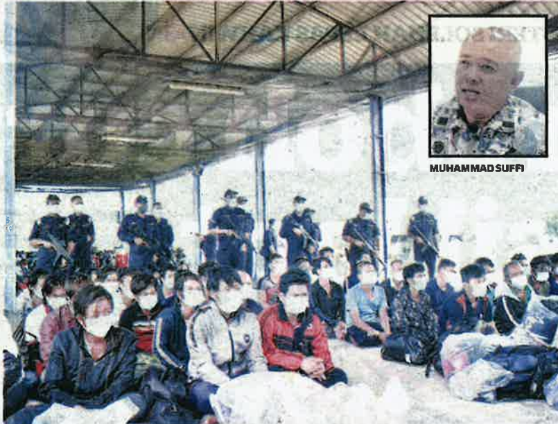
SEBAHAGIAN nelayan Vietnam yang berjaya ditahan APMM ketika ceroboh perairan negara melalui Terengganu baru-baru ini.

"Siasatan mendapati kesemua bot itu telah berada di perairan negara sejak awal pelaksanaan PKP Penuh dan telah mengaut 14 tan hasil laut termasuk ikan-