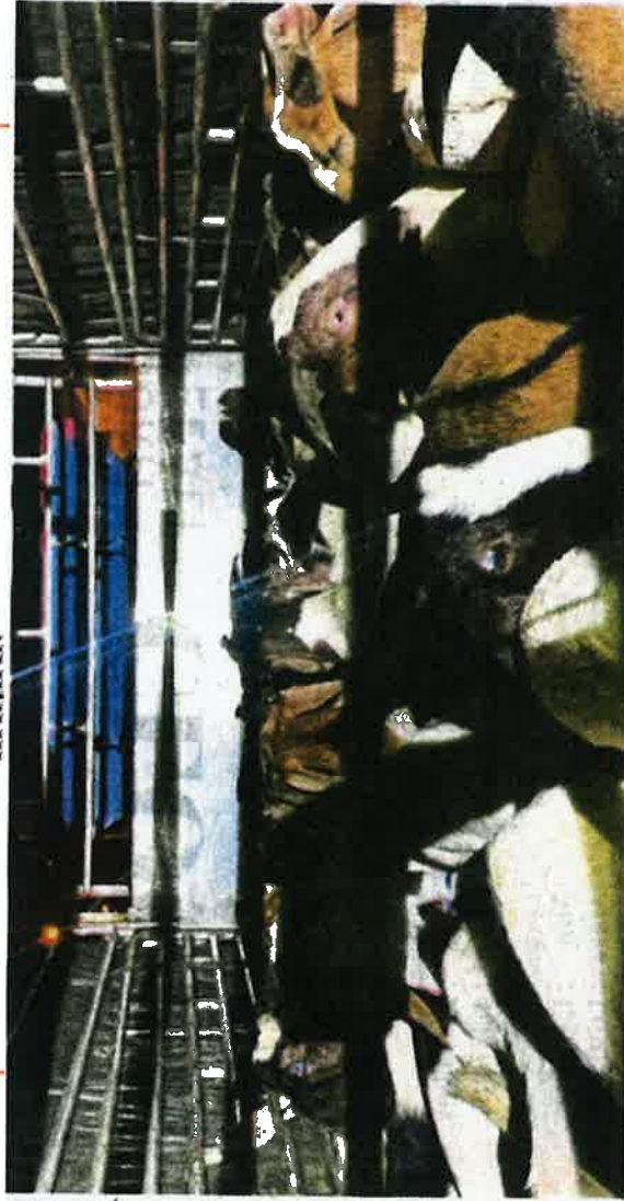
Kambing yang dirampas hasil pemeriksaan di Kampung Jubakar, Tumpat, semalam.