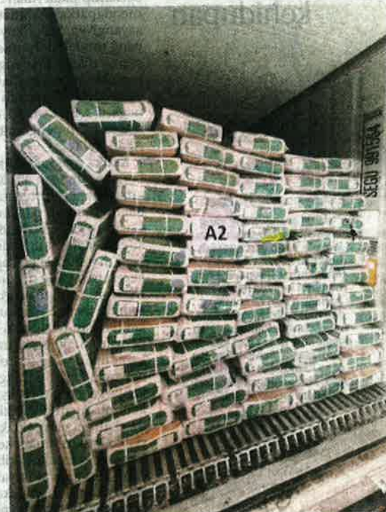
MAQIS Johor merampas daging kerbau dari India di Pelabuhan Pasir Gudang, Johor Bahru.

"MAQIS komited menjalankan penguatkuasaan undang-undang dan akan diperkasa di semua pintu masuk negara bagi memastikan kawalan penyakit ikan, haiwan, tumbuhan dan jaminan keselamatan makanan terpelihara serta mematuhi peraturan ditetapkan," katanya.