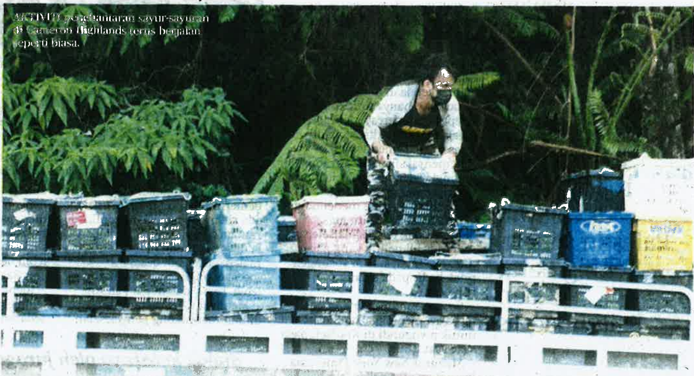
ACTIVITY penghantaran sayur-sayuran di Cameron Highlands terus berjalan seperti biasa.