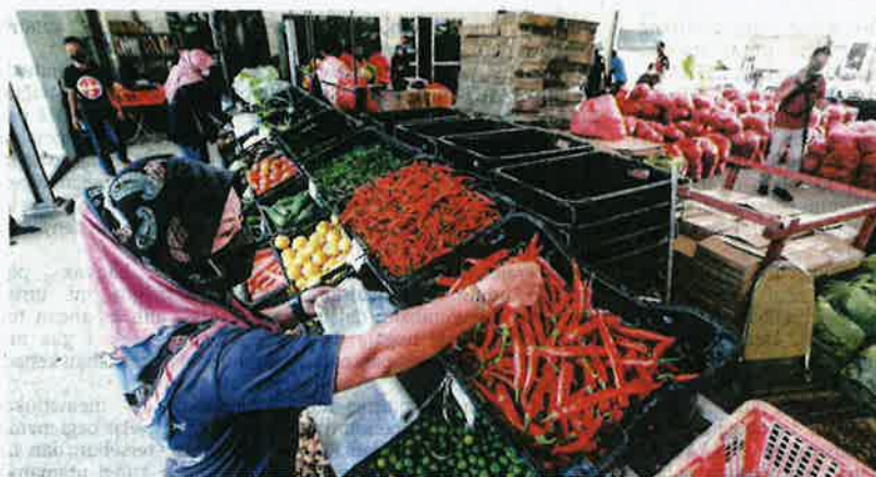
PASAR Segar Terkawal (PST) menyediakan produk pertanian segar pada harga berpatutan kepada pengguna.