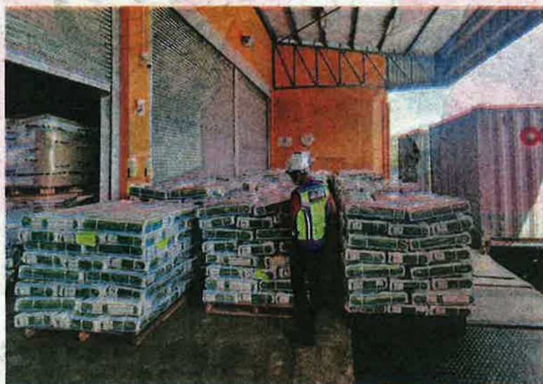
DAGING kerbau seberat 83,988 kilogram yang dirampas oleh Maqis Johor di Pelabuhan Pasir Gudang kelmarin.

Beliau turut menasihati semua pengimport dan pengeksport agar mengikut peraturan ditetapkan kerajaan bagi memastikan kawalan penyakit haiwan, ikan, tumbuhan serta jaminan keselamatan makanan Malaysia terpelihara.