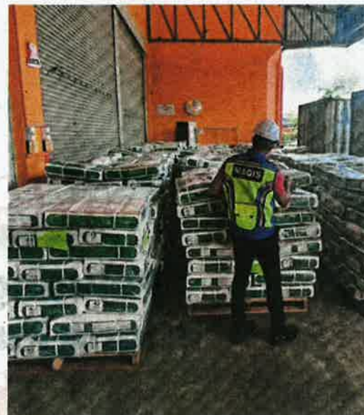
MAQIS Johor merampas 83.9 tan daging kerbau dari India di Pelabuhan Pasir Gudang, Johor Bahru, kelmarin.

han itu adalah mengikut Seksyen 13 Akta Perkhidmatan Kuarantin dan Pemeriksaan Malaysia 2011 (Akta 728) yang jika sabit kesalahannya boleh didenda sehingga RM50,000 atau penjara sehingga dua tahun atau kedua-duanya.