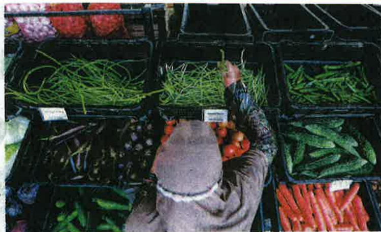
ORANG ramal membeli sayur-sayuran di Pusat Pengumpulan Hasil Ladang PPK Kuala Langat semalam.