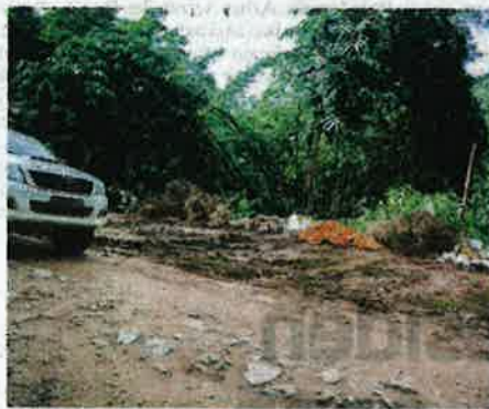
Antara lokasi pembuangan sayur rosak di Cameron Highlands.

Ee Mong berkata, jumlah sayuran harian yang dilupuskan