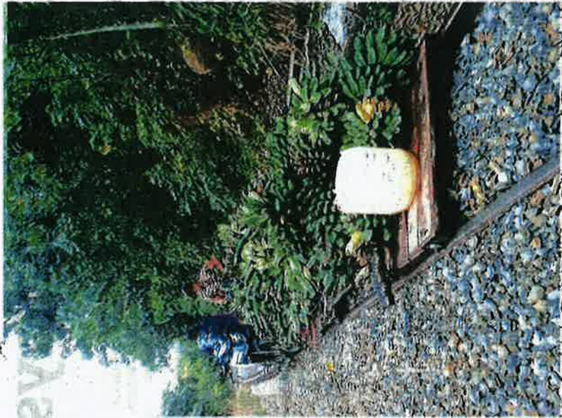
MOTOSIKAL troli yang digunakan penduduk Kampung Panggi mengangkut hasil pertanian ke pekan Tenom, Sabah.

"Kalau muatan banyak, saya membawa motosikal troli ini pada kelajuan 30 kilometer sejam (km/j), jadi ia mengambil masa lebih sejam untuk sampai ke pekan. Jika kereta api beroperasi, biasanya sebelum mula bergerak, kami akan maklumkan kepada stesen kereta api bagi mengelakkan berlaku kemalangan."