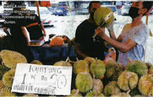
HARGA naik turun disebabkan permintaan tinggi durian