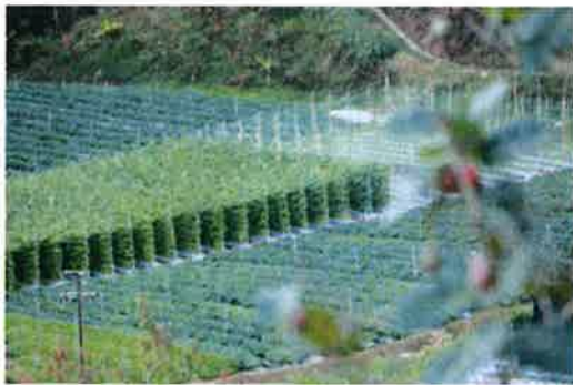
Antara kebun sayur di Cameron Highlands.

CAMERON HIGHLANDS, 25 Jun — Tidak berlaku lambakan sayur dan aktiviti membuang produk berkenaan yang didakwa berlaku di Cameron Highlands yang didakwa berlaku berikutan Perintah Kawalan Pergerakan (PKP) 3.0 baru-baru ini.