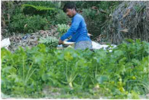
Pekebun sayur di Cameron Highlands.

“Tomato yang dibuang merupakan buah rosak secara semulajadi serta pelbagai sebab lain dan sememang biasa berlaku, faktor berkenaan menyebabkan pekebun bertindak membuangnya.