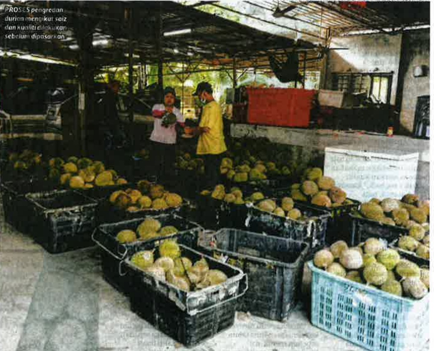
PROSES pengedaran durian mengikut saiz dan kualiti dilakukan sebelum dipasarkan

Contohnya dua minggu lalu, harga melonjak bagi semua jenis durian kerana kebiasaan pada awal musim, buah yang luruh tidak serentak di semua tempat SAMSUL