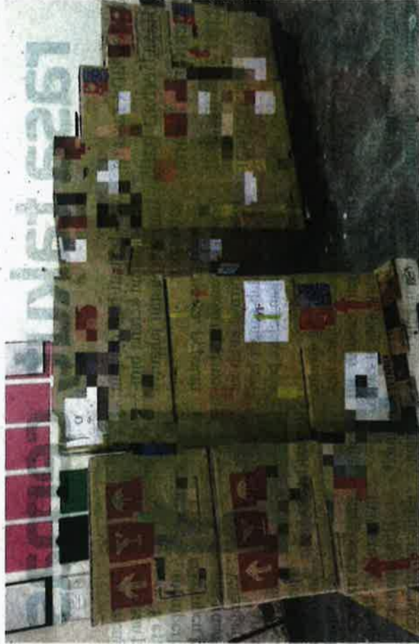
Antara kotak yang dipercayai mengandungi pokok orkid yang ditahan Jabatan Perkhidmatan Kuarantin dan Pemeriksaan Malaysia (Maqis) pada Jumaat.

“Kes disiasat di bawah Seksyen 15(1) Akta Perkhidmatan Kuarantin dan Pemeriksaan Malaysia 2011 (Akta 728).