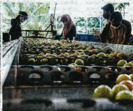
Kesemua sayuran dari ladang akan melalui proses penggredan sebelum diserahkan kepada pemborong untuk dihantar ke seluruh negara atau bagi tujuan dieksport.

itu hanya sekitar dua ke lima peratus daripada keseluruhan hasil pertanian dikeluarkan pengusaha.