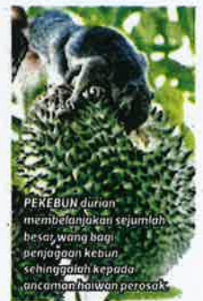
PEKEBUN durian membelanjakan sejumlah besar wang bagi penjagaan kebun sehingga ke tahap ancaman haiwan perosak

sehingga RM70 hingga RM80 sekilogram dengan penawaran yang lebih eksklusif," katanya.