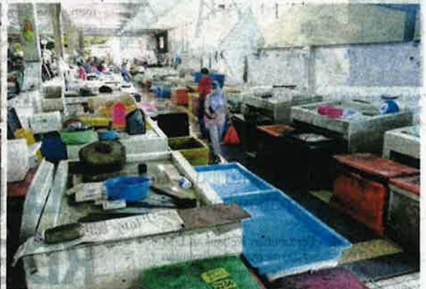
Tinjauan Sinar Harian pada Isnin mendapati hanya beberapa peniaga yang masih menjalankan aktiviti penjualan ikan di Pasar Besar Kuantan.

nyelesaian terhadap permasalahan ini bagi mengelak ketiadaan sumber pendapatan.