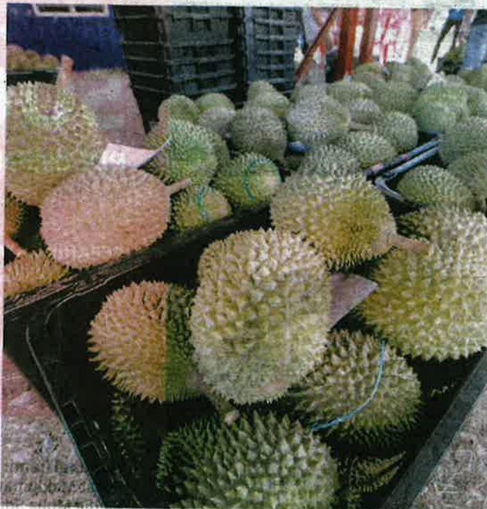
ANTARA buah durian musang king yang mendapat permintaan yang tinggi pada masa ini di Raub semalam.