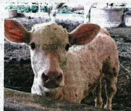
Anak lembu sado usia 12 bulan ke bawah yang dijual antara harga RM7,000 hingga RM8,000 seekor.