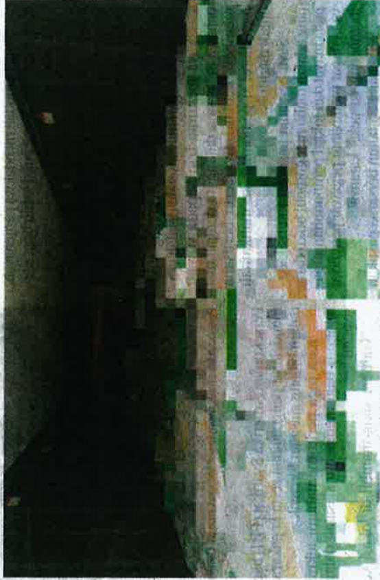
Daging kerbau sejuk beku yang dirampas Maqis di Pelabuhan Klang pada Selasa.

"Maqis memasihati dan berharap semua pemain industri pengimportan dan pengeksportan sentiasa mematuhi prosedur yang ditetapkan oleh kerajaan," tegas beliau.