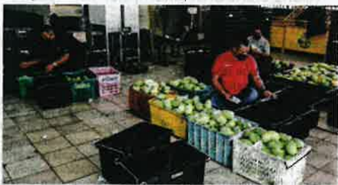
Aktiviti pengedaran di salah sebuah PPL peserta Program Ladang Kontrak.

Kerajaan turut menyediakan bantuan fasiliti PPL yang berbentuk khemah mudah alih/separa kokai serta peralatan pemasaran kepada peserta. Dengan fasiliti yang disediakan ini, usahawan pemasar di PPL memainkan peranan penting dalam membantu petani setempat untuk memasarkan produk. Banyak PPL yang telah berkembang maju menjadi pusat jualan terus kepada masyarakat setempat dan juga pembeli Industri. Malah terdapat PPL yang menjadi hub pengumpulan hasil sayur-sayuran dan ufam-ufaman untuk dieksport ke Singapura.