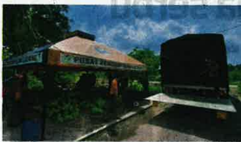
Salah sebuah PPL yang dibangunkan sebagai pusat pengumpulan hasil pengeluaran peserta.

Program ini terbuka kepada pengusaha baru dan juga pengusaha sedia ada dalam bidang