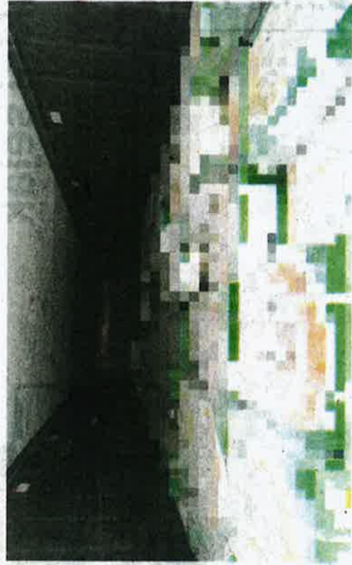
MAQIS Selangor merampas 28 tan daging kerbau sejuk beku dari India yang dipercayai dibawa masuk tanpa permit import sah.

leh dihukum mengikut Seksyen 11(3) akta yang sama dan jika disabit kesalahan, boleh didenda tidak melebihi RM100,000 atau dipenjara selama tempoh tidak melebihi enam tahun atau kedua-duanya.