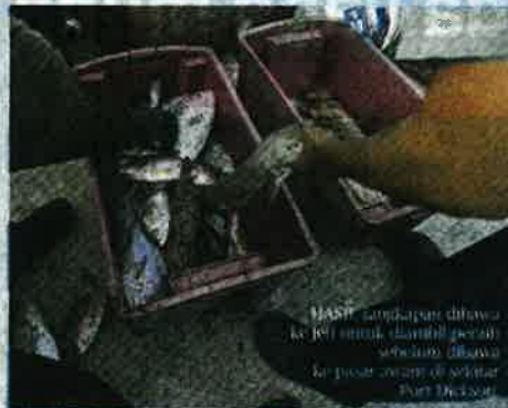
HASIL tangkapan dibawa ke jeli untuk diambil secara serentak dibawa ke pasar awam di sekitar Port Dickson.