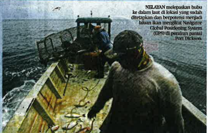
NELAYAN melepaskan bubu ke dalam laut di lokasi yang sudah ditetapkan dan berpotensi menjadi laluan ikan mengikut Navigator Global Positioning System (GPS) di perairan pantai Port Dickson.