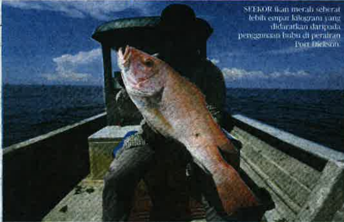
SPEKOR ikan merah seberat lebih empat kilogram yang didaratkan daripada penggunaan bubu di perairan Port Dickson.