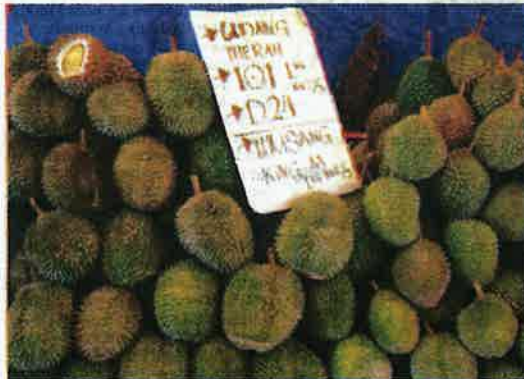
Harga durian kategori premium dijual dengan harga agak tinggi.