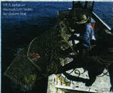
DUA nelayan menaiki bot ke dalam bot.