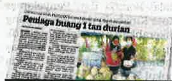
KERATAN Kosmo! kelmarin.