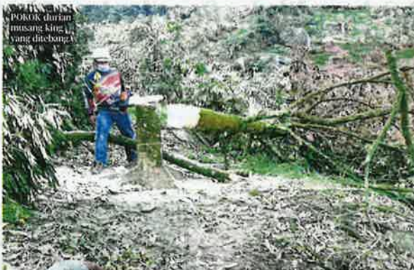
Pokok durian musang king yang ditebang.