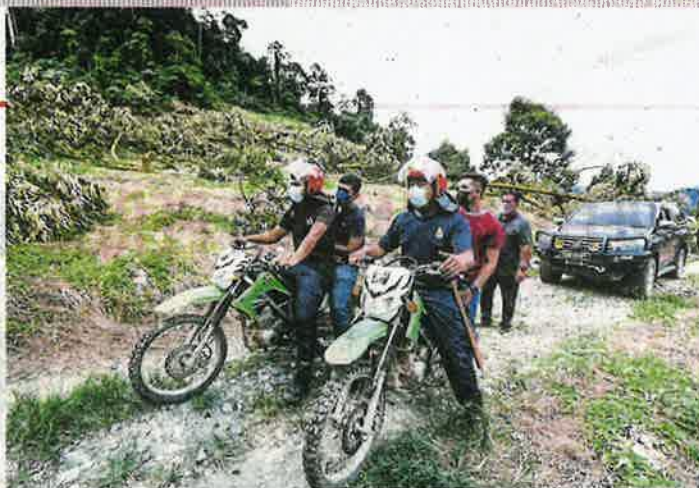
Police personnel standing guard during the operation to cut durian trees at the Batu Talam permanent forest reserve yesterday.

Some quarters had alleged that the operations were conducted at durian farms that had cases pending in court.