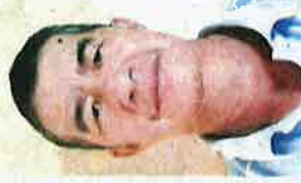
Chua: No one is allowed into the farms to harvest the crops.