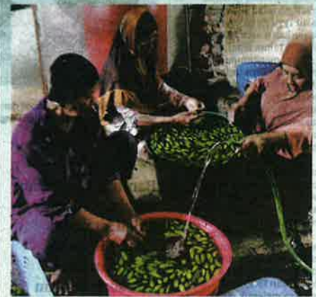
SEBAHAGIAN ahli Gabungan Persatuan Wanita (GPW) membersihkan buah belimbing sebelum dimasak untuk dijadikan asam hitam di Felda Kota Gelanggi Dua, Jerantut.