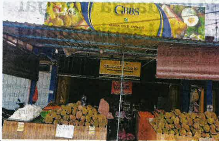
PEKEBUN dan peraih yang mempunyai masalah menjual raja buah boleh memasarkannya di GBBS yang terdapat di seluruh Johor.