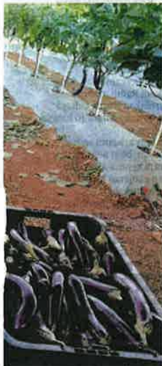
pada pemborong dan pasar raya

"Pertanian adalah perniagaan. Tanamlah benih apa pun di kawasan tanah yang subur pasti akan mencongak pendapatan yang lumayan," ujarnya.