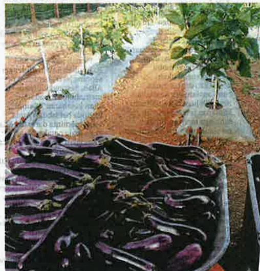
TERUNG diangkut dengan kereta sorong selepas dipetik untuk dipasarkan di Bandar Pusat Jengka, Maran.

Sementara itu, Haslina berkata, pada awalnya dia juga bimbang hasil tanaman itu tidak ada pasaran tetapi sebaliknya jangkakan itu meleset apabila sayuran berkenaan (terung) mendapat banyak permintaan daripada masyarakat setempat.