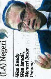
Wan Rosdy Wan Ismail, Menteri Besar Pahang

penguatkuasaan ini dijalankan selepas mendapat pandangan perundangan daripada Pejabat Penasihat Undang-Undang (LA) Negeri