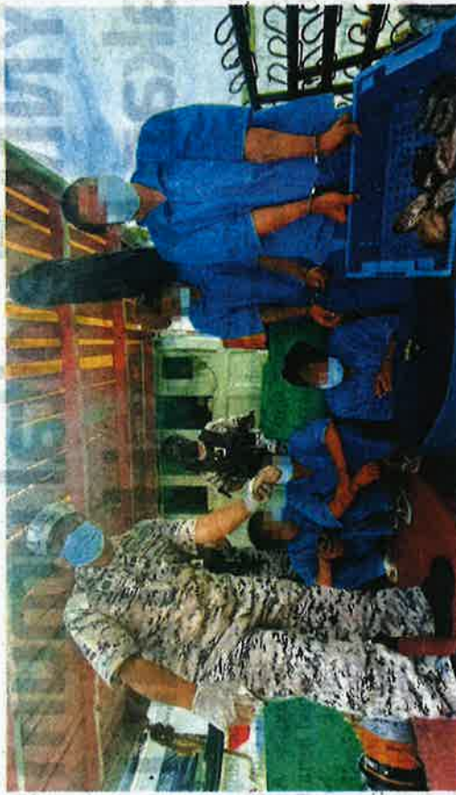
Maritim Malaysia Kelantan menahan lima nelayan asing warga Vietnam yang mencuri 200kg gamat berkualiti tinggi pada jarak 42.7 batu nautika dari muara Tok Bali, Pasir Puteh pada Ahad.