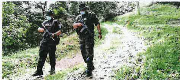
ANGGOTA PGA melakukan kawalan di sekitar Hutan Simpan Batu Talam, semalam.

"Pihak PGA di sana (Raub) untuk memastikan keselamatan mereka terjaga semasa menjalankan tugas dan PDRM tidak akan berkompromi dengan pihak