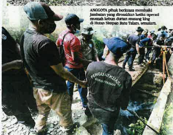
ANGGOTA pihak berkuasa membaiki jambatan yang dirosakkan ketika operasi musnah kebun durian musang king di Hutan Simpan Batu Talam, semalam.