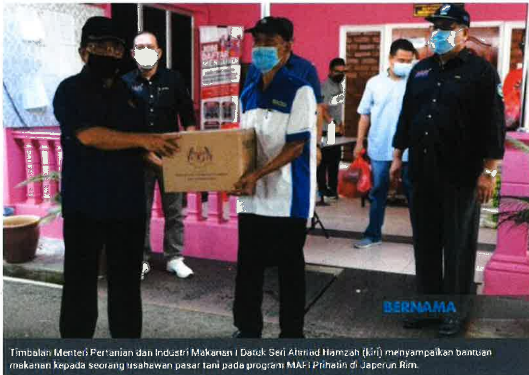
Timbalan Menteri Pertanian dan Industri Makanan 1 Datuk Seri Ahmad Hamzah (kin) menyampaikan bantuan makanan kepada seorang usahawan pasar tani pada program MAFI Prihatin di Japerun Rim.

JASIN, 17 Julai -- Lembaga Pemasaran Pertanian Persekutuan (FAMA) akan memberikan pelepasan pembayaran sewa tapak kepada usahawan pasar tani di seluruh negara susulan operasinya tidak dapat dijalankan semasa Fasa Satu Pelan Pemulihan Negara (PPN).