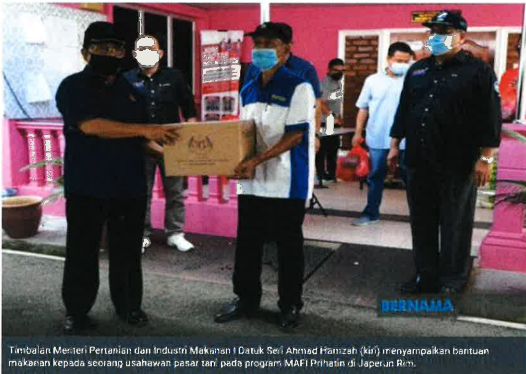
Timbalan Menteri Pertanian dan Industri Makanan 1 Datuk Seri Ahmad Hamzah (kiri) menyampaikan bantuan makanan kepada seorang usahawan pasar tani pada program MAFI Prihatin di Japerun Rim.

JASIN, 17 Julai -- Bekalan ternakan lembu mencukupi bagi menampung permintaan umat Islam menjalankan ibadah korban sempena Hari Raya Aidiladha, Selasa ini biarpun kerajaan menghentikan pengimportan lembu dari Thailand.