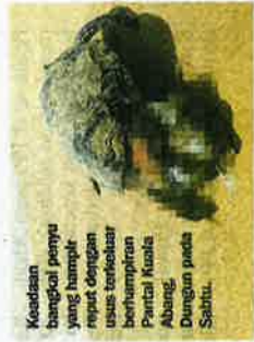
Kedua bangkai penyu yang hampir pupat dengan usus terbelah berhumprun Pantai Kuala Abang. Dengan pada Sabtu.

Beliau berkata, penemuan bangkai penyu tersebut menjadikan 24 kes kematian penyu dilaporkan tahun ini.