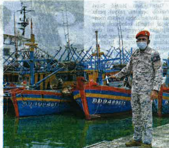
DATUK Mohd. Zubil Mat Som melihat empat buah bot nelayan Vietnam yang ditahan menerusi Op Kuda Laut ketika melakukan lawatan kerja di Ibu Pejabat APMM Terengganu pada April lalu.

Ujar beliau, pergantungan terhadap nelayan asing bagi kelas laut dalam amat tinggi sehingga 90 peratus terutama di Pantai Timur.