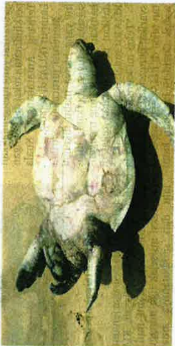
BANGKAI penyu agar jantan yang dipercayai sudah mati sejak seminggu lalu dengan usus perutnya terkeluar di Pantai Kuala Abang di Dungun.

Ruzaidi berkata, sehingga kini sebanyak 24 kematian penyu direkodkan di seluruh negeri, sejak Januari lalu.