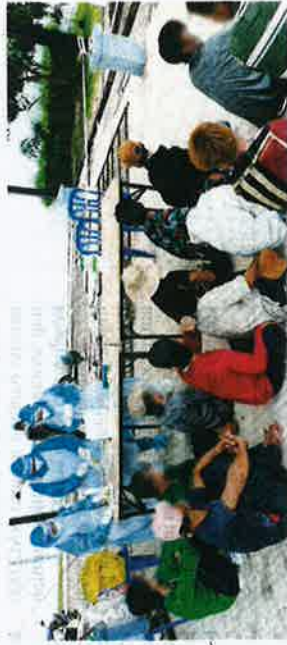
Seramai 13 kru nelayan Vietnam termasuk tekong dari dua buah bot ditahan anggota Kapal Maritim (KM) Gemina ketika melakukan Op Kuda Laut pada kedudukan 108 hingga 112 batu nautika dari Kuala Terengganu.

katanya dalam satu kenyataan di sini pada Ahad.