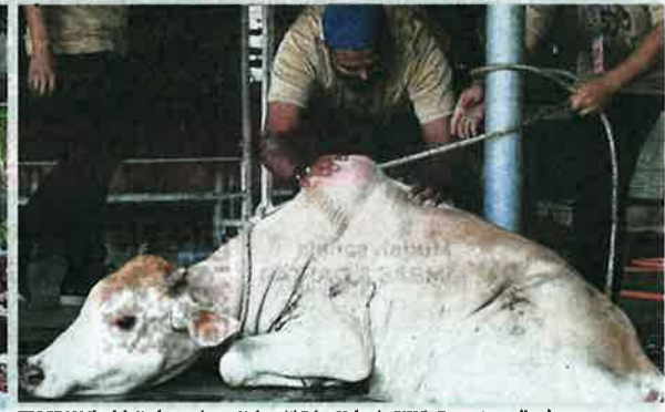
PROGRAM Ibadah Korban anjuran Universiti Sains Malaysia (USM), Georgetown di pekarangan Masjid Al-Malik Khalid USM, semalam. Tahun ini program tahunan itu dilaksanakan empat sesi selama empat hari bermula semalam untuk mematuhi prosedur operasi standard (SOP) dengan menetapkan had lima lembu dan lima kambing sehat.