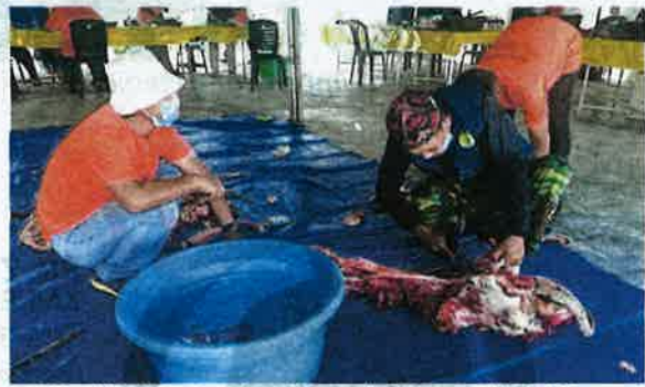
PETUGAS melakukan kerja melapah daging korban mengikut SOP sempena Aidiladha di Surau Ar Raudah, Taman Paya Rumput Perdana.

"Program ini berjalan dengan lancar selain mematuhi semua prosedur operasi standard (SOP) yang dite-