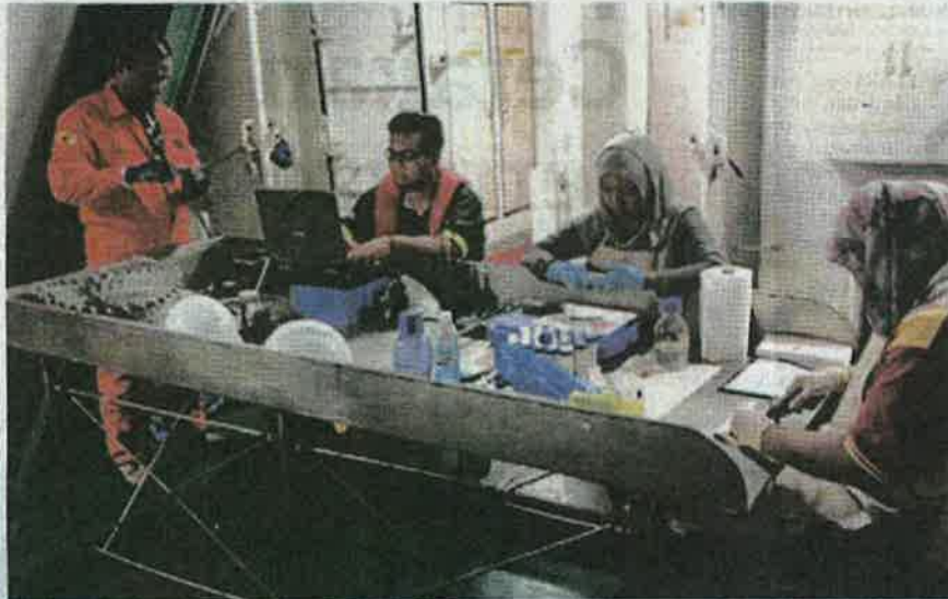
KAKITANGAN Institut Penyelidikan Perikanan (FRI) perlu menjalankan pemeriksaan untuk menentukan bilangan induk jantan dan induk betina serta tahap kematangan induk kerang yang ditabur di Teluk Lekir, Perak.

lain seperti Pulau Pinang, Kedah, Selangor, Johor dan Negeri Sembilan sasaran penghasilan benih sehingga 150,000 metrik tan bernilai RM1.8 bilion dapat dicapai menjelang 2025.