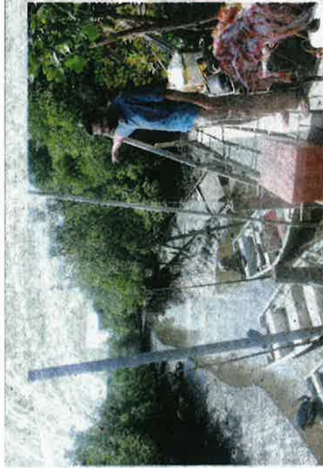
HERMAN menurunkan jeti yang runtuh di Pengkalan Nelayan Sungai Dinar, Serkat, Pontian baru-baru ini.