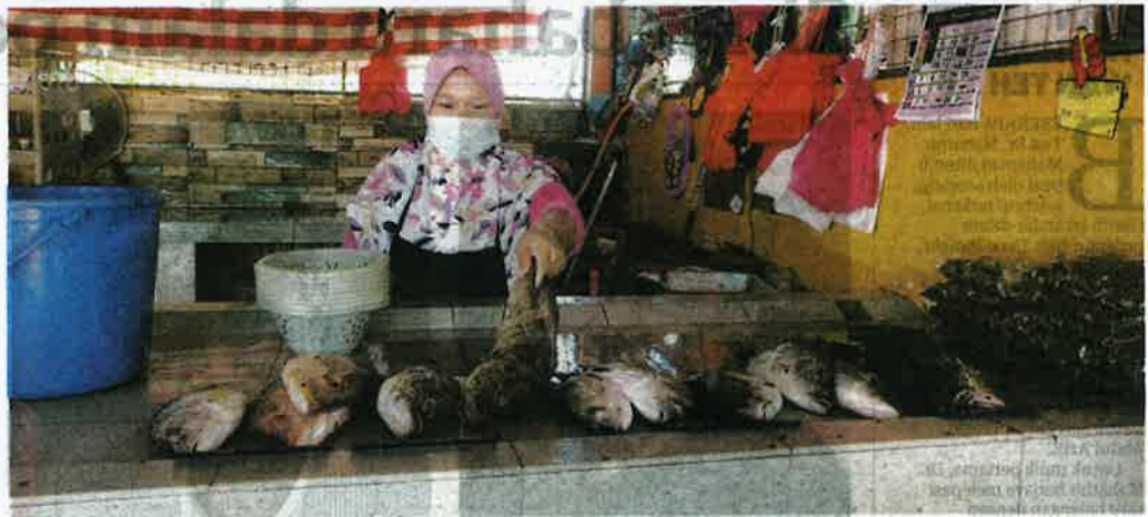
SEORANG peniaga menunjukkan baki ikan merah dan kerapu pada harga RM30 hingga RM40 sekilogram di gerainya yang masih belum terjual walaupun menghampiri waktu penutupan operasi.

Perkara itu didedahkan Pengerusi Persatuan Nelayan Selangor, Omar Abdul Rahman yang memberitahu, nelayan di pedalaman Selangor khususnya sepanjang persisiran pantai dari Sungai Besar ke Kuala Selangor, sengsara dengan hasil tangkapan tidak laku dalam tempoh