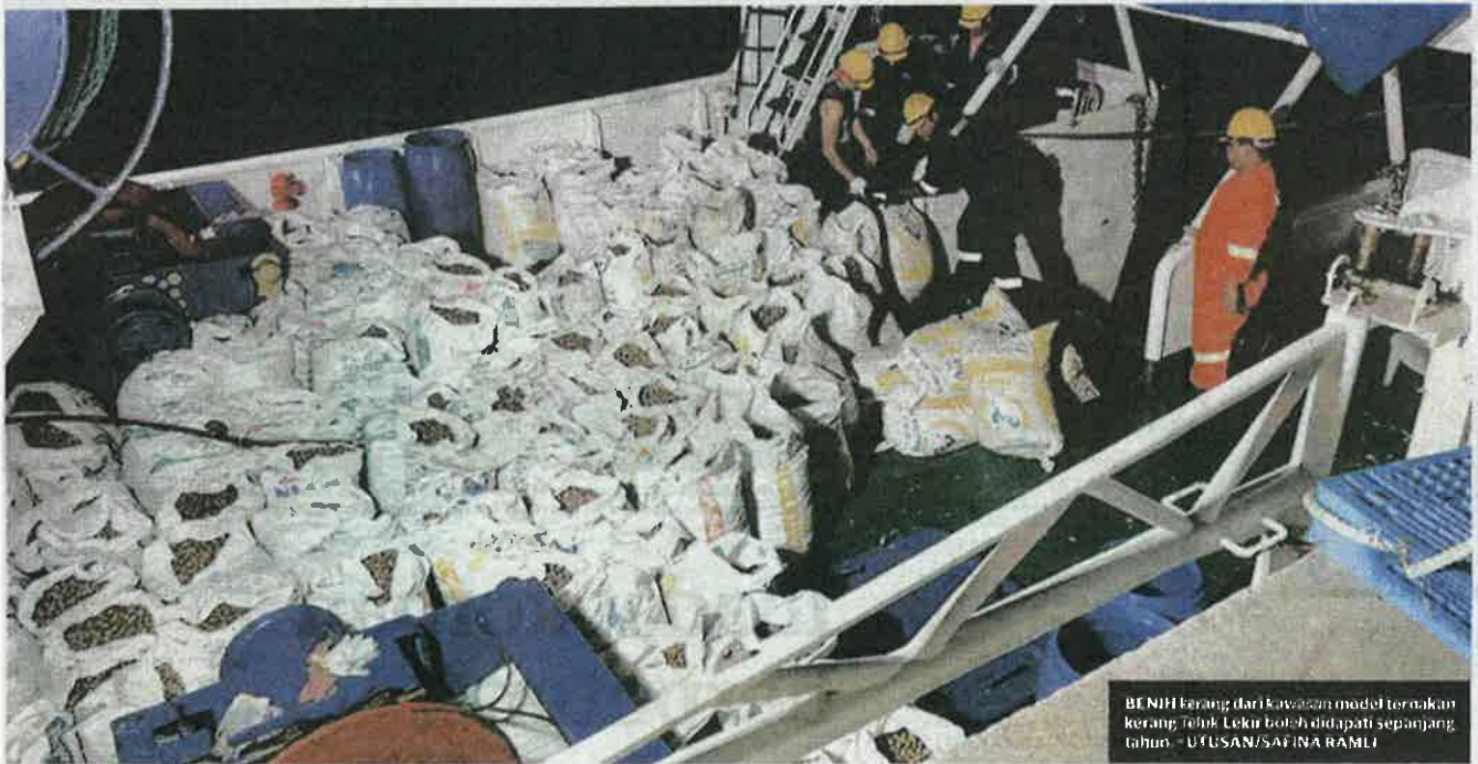
BENIH berang dari kawasan model ternakan kerang, Teluk Lekir boleh didapati sepanjang tahun.

Zainuddin berkata, jika model yang sama dilaksanakan negeri-negeri