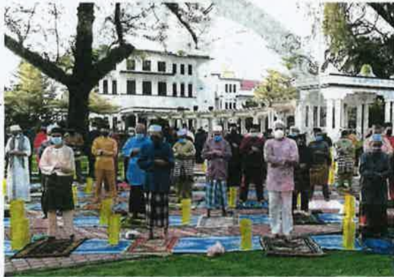
SERAMAI 300 masyarakat di Arau hadir memunahkan solat sunat Aidiladha bersama Raja Perlis, Tuanku Syed Strajuddin Putra Jamalullail dan Raja Muda Perlis, Tuanku Syed Faltzu'din Putra Jamalullail di pekarangan Istana Arau, Perlis, semalam.