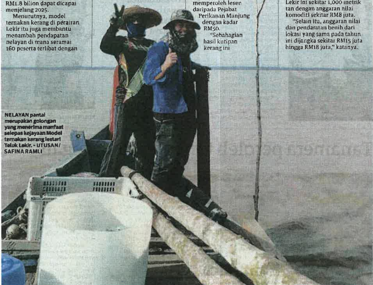
NELAYAN pantai merupakan golongan yang menerima manfaat selepas kejayaan Model ternakan kerang lestari Teluk Lekir.

"Selain itu, anggaran nilai dan pendaratan benih dari lokasi yang sama pada tahun ini dijangka sekitar RM15 juta hingga RM18 juta," katanya.