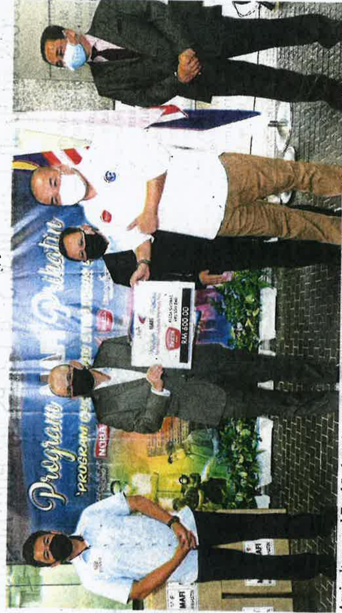
Agriculture and Food Industries Minister Datuk Seri Dr Ronald Kiandee (second from left) receiving a contribution from the representative of Rezza Global (M) Sdn Bhd for the MAFI Prihatin programme in Putrajaya yesterday.

The first distribution of 630 food baskets will be in Pulau Tioman, Pahang, followed by Port Dickson in Negri Sembilan,