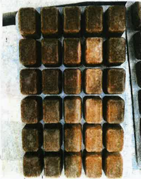
SERAHAGIAN makanan ikan dari China dirampas Maqis Selangor.

"Ini bagi memastikan tumbuhan, haiwan, karkas, ikan, keluaran pertanian dan mikro organisma yang diimport ke negara ini bebas ancaman perosak, penyakit dan bahan cemar serta mematuhi syarat dan peraturan yang ditetapkan," katanya.