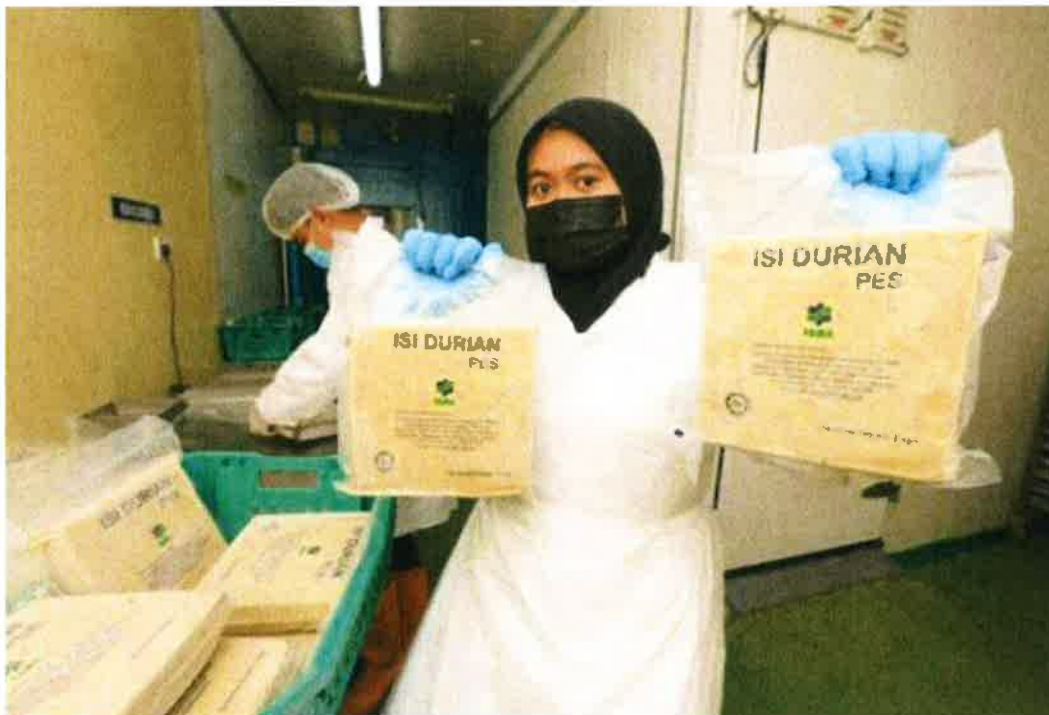
Pusat Pemrosesan FAMA Jerantut dijangka menghasilkan 10 tan pes pada musim durian kali ini.

KUANTAN - Sebanyak 10 tan pes durian dijangka dapat dihasilkan oleh Pusat Pemrosesan Lembaga Pemasaran Pertanian Persekutuan (FAMA) Jerantut pada musim durian kali ini.