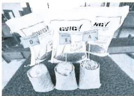
KUALITI TERJAMIN: Antara biji benih yang dikeluarkan di Pusat Kajian Dan Penghasilan Benih Serta Pusat Pemprosesan Jagung Bijirin GWG Wilayah Utara di Arau, kelmarin.

"Tiada masalah dari segi bekalan makanan kerana pihak pengusaha masih mampu menawarkan keperluan yang secukupnya untuk rakyat," katanya kepada pemberita ketika melakukan lawatan kerja ke Pusat Kajian dan Penghasilan Benih serta Pusat Pemprosesan Jagung Bijirin Green World Genetics