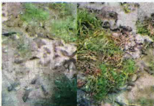
TANGKAP layar video ikan puyu timbul di darat yang tular dalam media sosial sebelum ini adalah fenomena biasa berdasarkan habitat spesies berkenaan.

KUALA SELANGOR: Fenomena ikan puyu timbul di darat di sebuah kampung di Tanjung Karang, di sini seperti yang tular dalam media sosial baru-baru ini, adalah perkara biasa dan pernah beberapa kali berlaku sebelum ini.