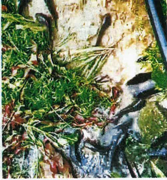
SEBAGIAN ikan puyu yang dikesan naik ke darat sehingga mengemparkan penduduk di Tanjung Karang, Kuala Selangor kelmarin.

"Semasa kejadian, saya hampir terlepas selepas solat zuhur di ruang rehat luar surau akibat hujan lebat sebelum dikejutkan oleh tiga rakan lain berhubung kejadian itu.