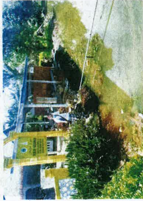
PENDUDUK menunjukkan lokasi asal ikan puyu sebelum ditemui di pekarangan Surau Sulaiman, Tanjung Karang kelmarin.

Kejadian berkenaan dikatakan berlaku dalam dua fasa bermula pukul 2.30 petang dan 4 petang