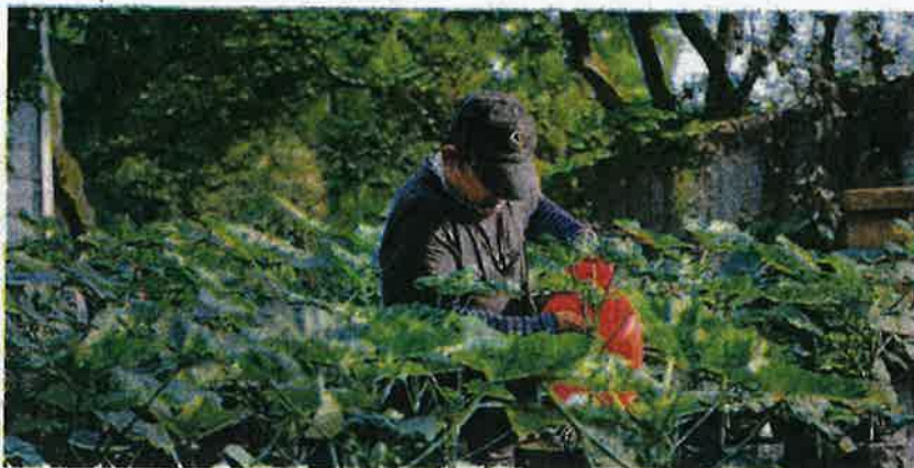
GOLONGAN muda diseru agar merebut peluang ditawarkan MAFI melalui Program Empowerment @ Agropreneur Muda 2021. – GAMBAR HIASAN

bahawa daripada 14.6 juta belia di Malaysia, hanya 15 peratus yang terlibat dalam bidang pertanian. Tambahan pula, kajian menunjukkan hanya empat peratus pelajar di universiti yang akan mempertimbangkan untuk menceburi kerjaya dalam bidang pertanian.