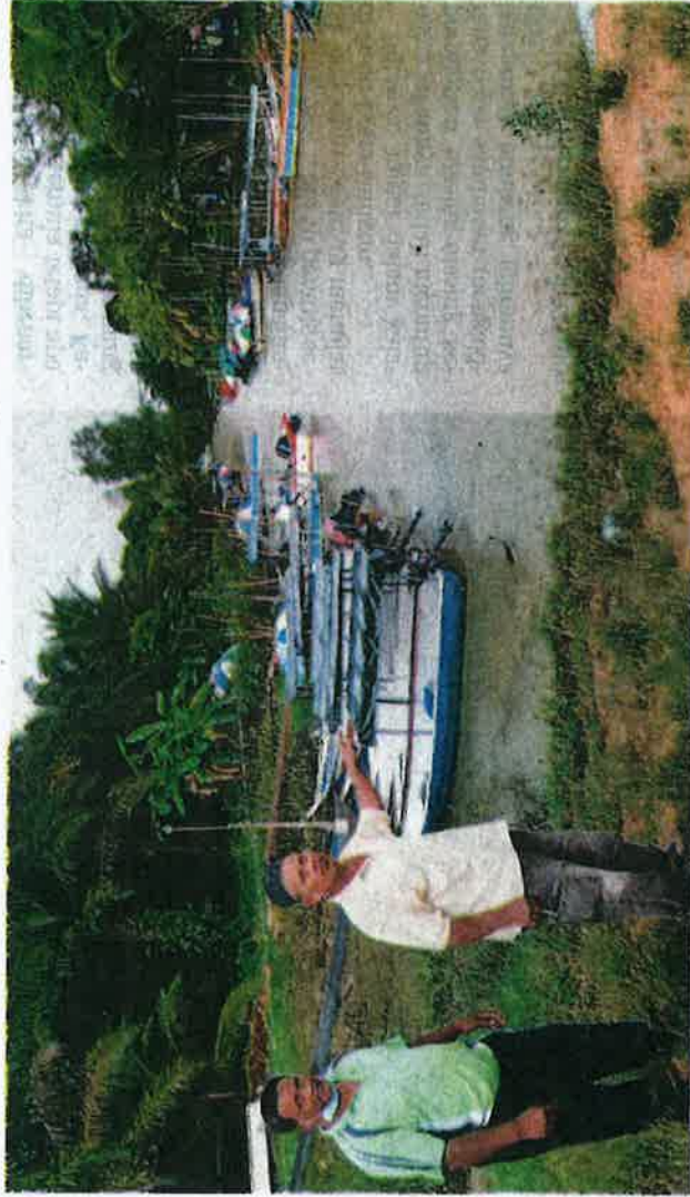
NELAYAN menunjukkan keadaan bot memancing udang yang tersadai di Kampung Sungai Dulang dekat Bagan Datuk, Perak, semalam.