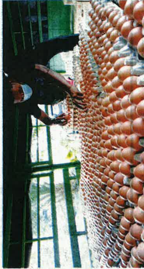
HARGA telur ayam dicatatkan naik pada bulan Ogos berbanding bulan lalu. - GAMBAR HIASAN

Namun, daging lembu pejal pada bulan ini merosot kepada RM36.30 berbanding bulan lalu RM37.45, iaitu tertinggi tahun ini kerana permintaan naik untuk sembelihan korban Aidiladha, begitu juga harga bebiri import pada bulan ini jatuh kepada RM30.10 sekilogram berbanding bulan sebelumnya RM31.35.