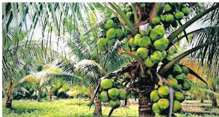
Bukan setakat buah, malah segala yang ada pada kelapa, daripada pokok sehingga daunnya, daripada akar sehingga ke pelepahnya, tiada satu pun yang tidak berguna melainkan semuanya berguna belaka.

Isi kelapa boleh diparut dan dibuat inti. Selain itu ia diperah, dijadikan santan yang gunanya untuk urusan memasak. Bayangkanlah nasi lemak