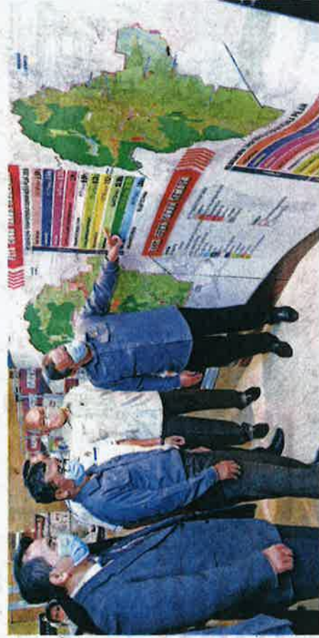
MENTERI Besar Negeri Sembilan, Datuk Seri Aminuddin Harun melihat peta guna tanah dalam draf Rancangan Tempatan Daerah Kuala Pilah.

"Bagi membangunkan daerah Kuala Pilah sebagai agroekonomi berdaya maju, pembangunan aktiviti pertanian, peternakan dan perikanan yang berproduktiviti tinggi akan dilaksanakan antaranya tanaman padi Aerob di Ta-