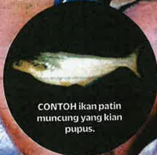
CONTOH ikan patin muncung yang kian pupus.