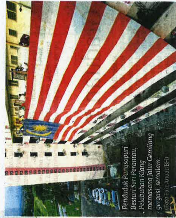
Penduduk Pemasapuri Bestari Seri Perantau, Pelabuhan-Klang memasangi Jalur Gemilang gergasi, semalam.