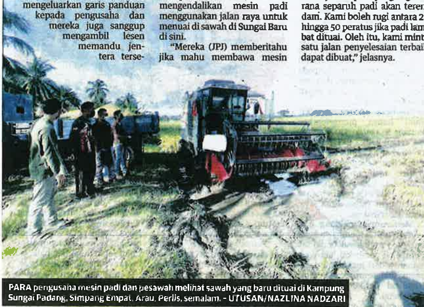
PARA pengusaha mesin padi dan pesawah melihat sawah yang baru dituai di Kampung Sungai Padang, Simpang Empat, Arau, Perlis, semalam. - UTUSAN/NAZLINA NADZARI

"Bila JPJ buat operasi, pemandu mesin padi pula tak mahu turun ke bendang, jadi kami petani pula yang rugi kerana separuh padi akan terendam. Kami boleh rugi antara 20 hingga 50 peratus jika padi lambat dituai. Oleh itu, kami minta satu jalan penyelesaian terbaik dapat dibuat," jelasnya.