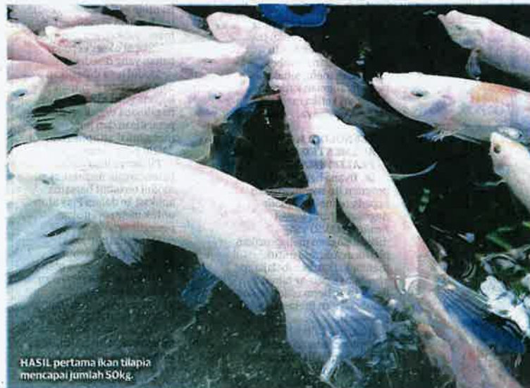
HASIL pertama ikan talapia mencapai jumlah 50kg.

tambah, kemahiran serta pengetahuan kepada pelajar, khususnya dalam akuakultur, kaedah penanaman fertigasi serta hidroponik.