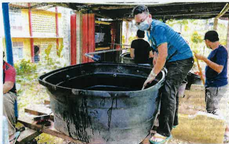
PEMBERSIHAN tangki ikan secara berkala dilaksanakan pelajar manakala pemantauan dilakukan oleh staf dan felo kolej bagi memastikan kualiti air sentiasa terjaga.

● Bertujuan memberi pendedahan dan ilmu pertanian serta penternakan kepada pelajar Kolej Canselor serta menerapkan sesuatu yang berbeza selain apa yang diperolehi dalam bilik kuliah.