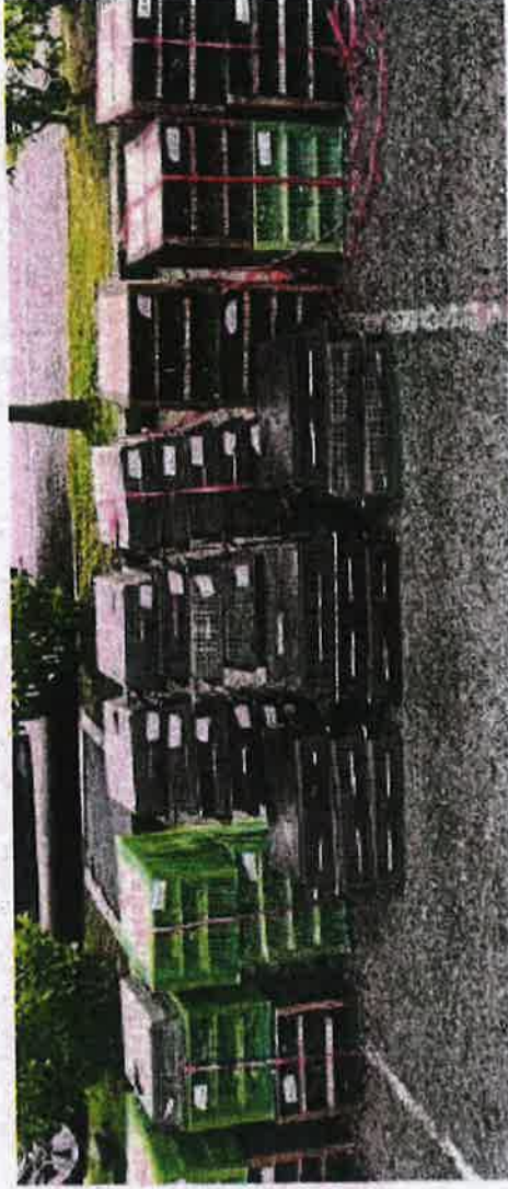
55 sangkar berisi burung murai kampung bernilai lebih RM76,000 dirampas di Pantai Alai, Melaka cuba diseludup ke Indonesia 26 Ogos lalu.

Jika disabit kesalahan boleh didenda tidak melebihi RM100,000 atau dipenjarakan tidak melebihi enam tahun atau kedua-duanya sekali.