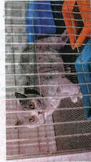
KUCING baka BSH yang diimport dari Rusia ditahan oleh pihak Maqis di bahagian kargo KLIA, Sepang pada Ahad lalu.