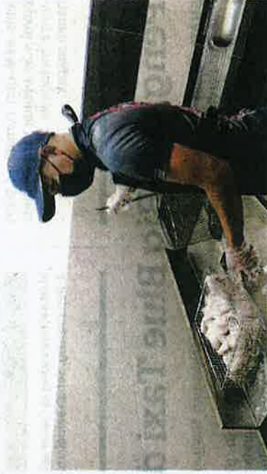
MOHD. terpaksa memproses sendiri ayam goreng setelah membertanyakan ramai pekerja ekoran kenaikan kos operasi di Restoran Matt Ori, Laidang, Kuala Terengganu semalam.

"Ia amat menekan saya kerana tidak boleh menaikkan harga ju-