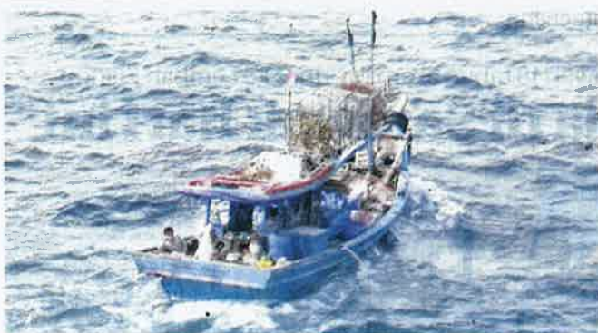
SALAH sebuah bot nelayan asing yang disyaki menceroob dan menangkap hasil laut di perairan Pulau Pinang baru-baru ini.