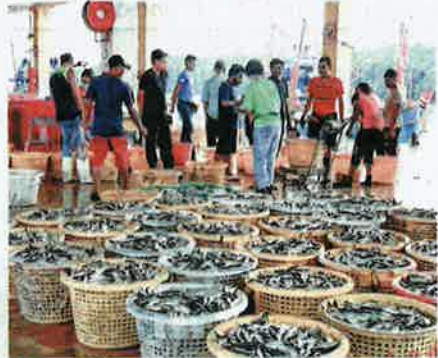
KEPELBAGAIAN jenis ikan yang terdapat di perairan Pulau Pinang menarik minat nelayan asing untuk menceroob. - GAMBAR HIASAN

Perairan Pulau Pinang jadi lubuk nelayan Indonesia tangkap pelbagai jenis ikan