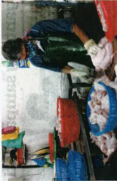
SEORANG pembeli ayam memotong ayam di Pasar Awam Pulau Pinang semalam.

Sementara itu, pengguna awam harga ayam segar di pasar awam juga, peniaga ayam