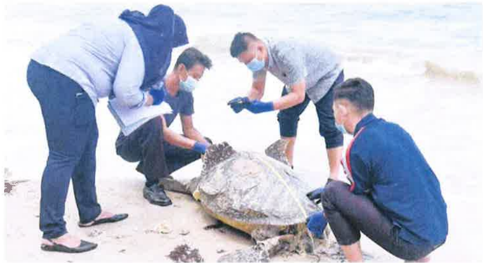
Labuan Fisheries Department's marine park and resource management staff measuring the female green turtle which was found dead by a villager at Layang-Layangan Beach yesterday.

She said once the investigation paper was opened, she would