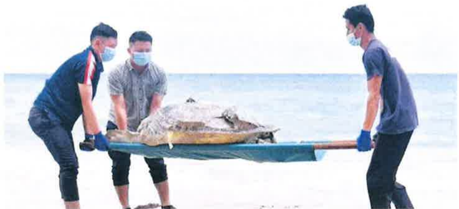
Labuan Fisheries Department's marine park and resource management staff lifting the 1.16-meter female green turtle which was found dead by a villager at Layang-Layangan Beach here, yesterday with its head and tail broken apart.

She said once the investigation paper was opened, she would urge members of the public and