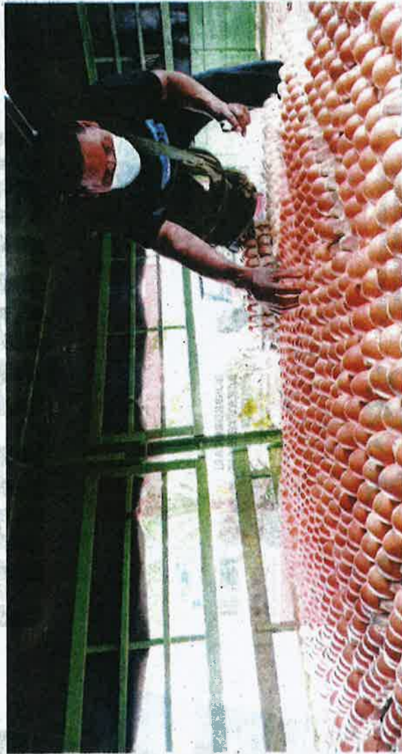
HARGA ayam dan telur tidak termasuk dalam senarai barang kawalan kecuali semasa musim-musim perayaan utama. - GAMBAR HIASAN

Jelas KPDNHEP, pengguna perlu faham bahawa harga ayam dan telur tidak termasuk dalam senarai barang kawalan kecuali semasa musim-musim perayaan, + utama di Malaysia melalui pelak-