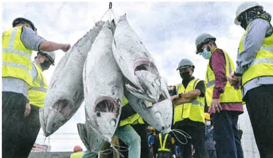
Ronald (third right) and others observe the tuna-landing process at the Ayer Dalam Wharf.

So far, Malaysia has two tuna landing ports, namely Penang Port and Langkawi Port. — Bernama