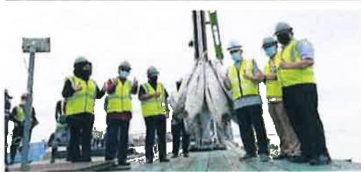
罗纳建迪及官员们视察金枪鱼于檳城深水码头卸载。