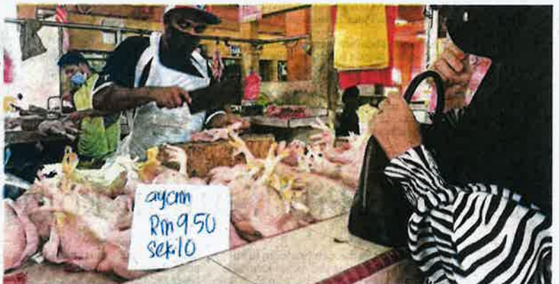
Ayam dijual RM9.50 sekilogram di Pasar Bukit Besar, Kuala Terengganu, semalam.

Di Kuala Terengganu, harga ayam dijangka berterusan naik, sekali gus memberi tekanan ke-