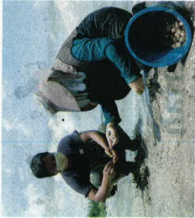
PENDUDUK mengutip kerang dan pelbagai hasil laut seperti remis, kepah dan kijing di Pantai Tanjung Kepah, Lekir dekat Lumut, semalam.

Oleh ASLIZA MUSA utusannews@mediamula.com.my