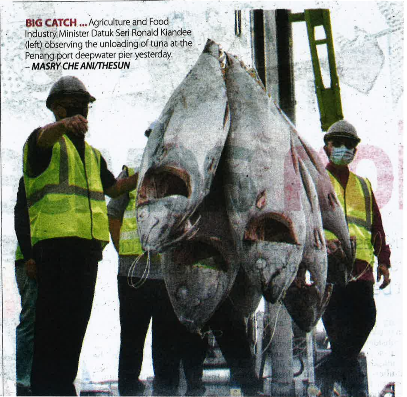
BIG CATCH... Agriculture and Food Industry Minister Datuk Seri Ronald Kiandee (left) observing the unloading of tuna at the Penang port deepwater pier yesterday.