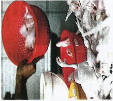
TINDAKAN segera akan diambil ke atas peniaga yang menjual pada harga tidak munasabah berdasarkan penamaan KPDNHEP.

"Kementerian memandang serius situasi yang sedang berlaku khususnya membabitkan kenaikan harga barangan keperluan asas pengguna kerana ia memberi impak yang teruk kepada kos sara hidup rakyat terutama dalam fasa pandemik Covid-19. "Di atas keprihatinan ini, saya mengarahkan pendakwaan bawahi diambil bagi menangani masalah kenaikan harga barang terutama barangan ayam yang sering kali be-