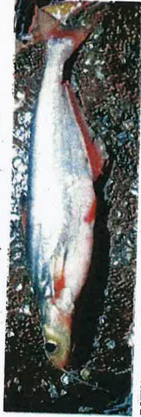
PATIN muncung yang didakwa pupus di sungai Pahang.

Baru-baru ini Kosmo! melaporkan ikan patin muncung yang menjadi buruan kerana keena-kan isinya kini dianggap seperti