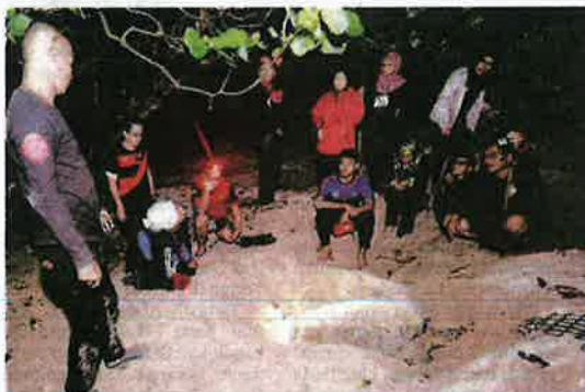
SALAH satu program sukarelawan pemuliharaan penyu yang pernah dianjurkan UMT.

Menurutnya, program 'edutourism' tersebut akan disemarakkan selepas penguatkuasaan penjualan telur penyu oleh Kerajaan Negeri Terengganu pada akhir tahun ini.