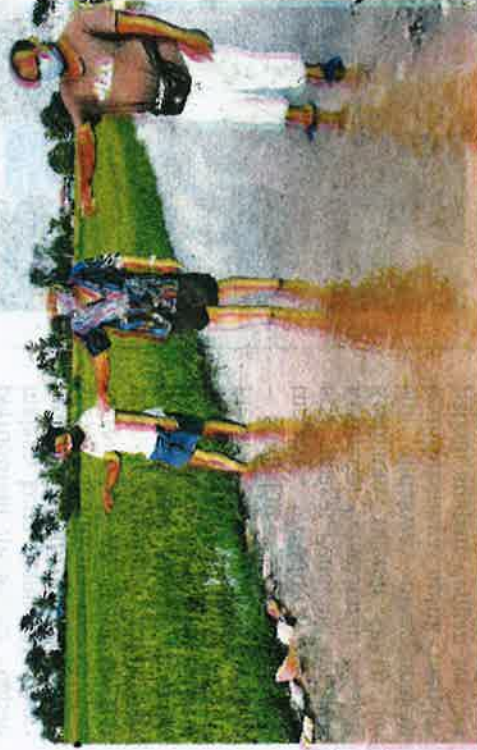
BEBERAPA petani menunjukkan kawasan sawah padi yang mereka usahakan ditenggelami banjir di Kampung Alor Berala, Pendang baru-baru ini.

"Sungai yang terdapat di kampung itu yang menjadi nadi petani terbabit perlu didalam dan dibersihkan bagi mengatasi masalah yang dihadapi penduduk," katanya.