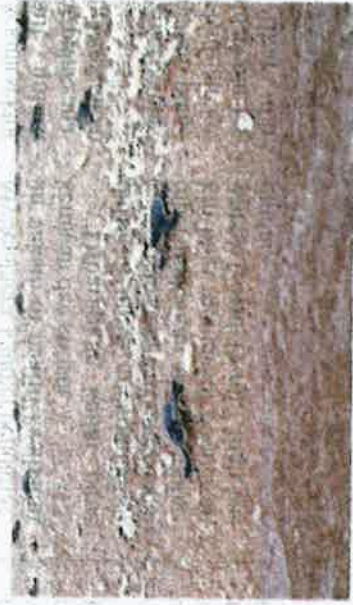
Anak penyu dilepaskan ke habitat asasi di Mak Kepit, Pulau Redang.

"Kita juga berharap modul latihan ini dapat dijadikan rujukan dan diimplementasikan di mana-