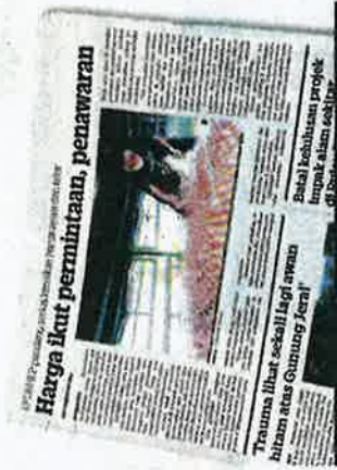
KERATAN Kosmo/10 September 2021.

Beliau berkata, pendekatan itu juga bertujuan memberi peringat kepada peniaga ayam supaya