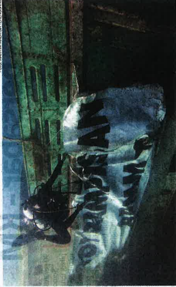
Sebuah bot nelayan asing yang ditenggelamkan di Pulau Redang, Besut untuk dijadikan tukun tiruan.

di sekitar Pulau Redang iaitu sebanyak enam bot, perairan Pulau Bidong (dua), perairan Batu Burok (enam), perairan Kuala Nerus (empat), Pulau Kapas (tiga) dan Pulau Susu Dara di Kelantan (13 bot).