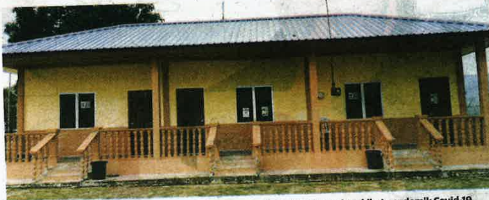
NELAYAN Beach Resort yang diusahakan PNK Pengerang mengalami kerugian akibat pandemik Covid-19 yang melanda di Kampung Baru, Teluk Ramunia di Kota Tinggi, Johor.

"Selain perniagaan minyak dan menjual peralatan pukat serta jaring sebagai pendapatan, PNK Pengerang bergantung kepada chalet tersebut yang pada awalnya hanya memiliki 13 buah bilik.