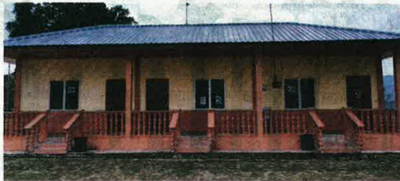
CHALET milik PNK Pengerang di Kampung Baru, Teluk Ramunia, Pengerang sunyi sepi tanpa kehadiran pengunjung sejak PKP dilaksanakan akibat Covid-19.

"Dahulu chalet ditempah oleh mereka yang melakukan aktiviti perkhemahan dan perkelahan, namun kini ia sunyi sepi. Sebe-