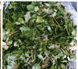
Putik bunga yang dibawa masuk dari India dirampas selepas cuba dibawa masuk tanpa mengemukakan permit import dikeluarkan oleh Maqis.