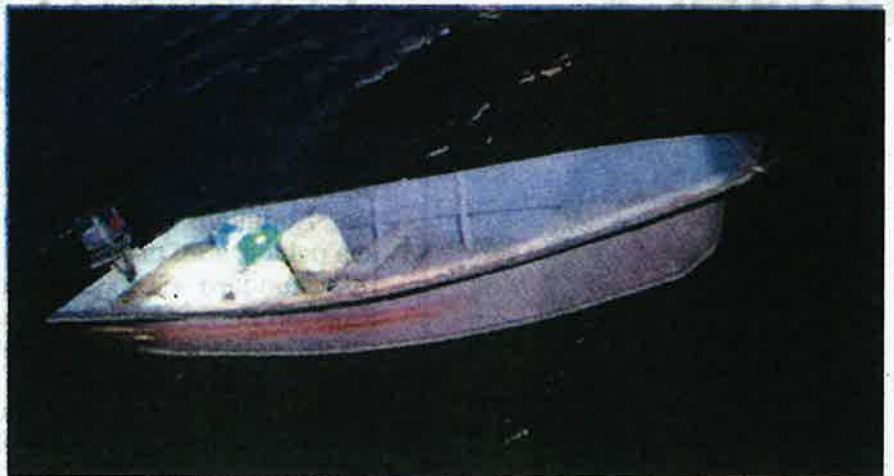
BOT Jenis fibre yang dirampas pihak berkuasa disyaki digunakan sindiket penyeludupan dadah di Johor baru-baru ini.

"Jika kita lihat nelayan dahulu kita tak pernah dengar