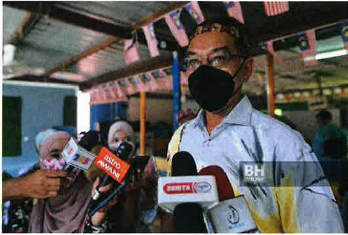
Timbalan Menteri Perdagangan Dalam Negeri dan Hal Ehwal Pengguna (KPDNHEP), Datuk Rosol Wahid pada sidang media selepas meninjau proses vaksinasi di Pusat Pemberian Vaksin (PPV) di Kampung Sungai Berua, di sini.