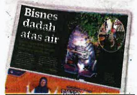
KERATAN Kosmo! semalam.

rutin yang dilakukan di laut secara kerap secara tidak langsung akan menjadikan nelayan terbiasa dan kekal sihat tanpa perlu mengambil dadah.