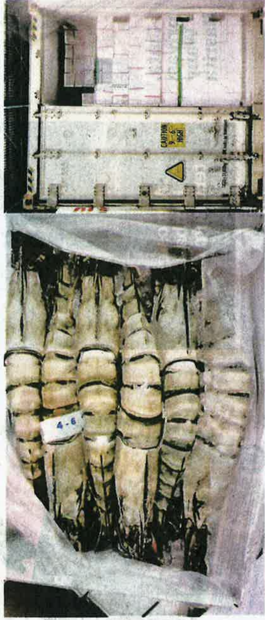
KONTENA dipenuhi udang, sotong ditahan di Pelabuhan Barat, Klang.

Dalam perkembangan sama, tindakan penguatkuasaan undang-undang akan terus diperluaskan bagi memantau dan memeriksa setiap keluaran pertanian.