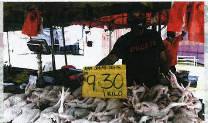
TINJALAN harga ayam di Pasar Chow Kit, Kuala Lumpur, senalakan menunjukkan rata-rata peniaga menjual ayam di bawah RM9.50.