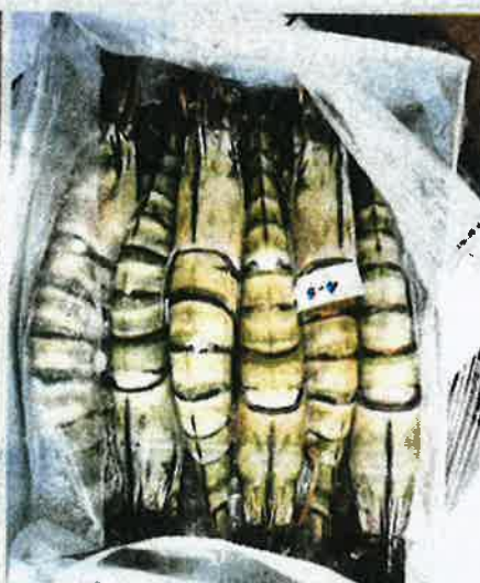
Sebahagian udang dan sotong sejuk beku dari Indonesia yang dirampas MAQIS Selangor.