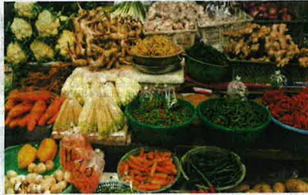
Sektor pertanian diunjur berkembang sebanyak 3.8 peratus setahun dalam tempoh RMK12 dan menyumbang kepada KDNK pada tahun 2025.

"Melangkah ke hadapan, petani digalakkan untuk menerima pakai amalan pertanian organik untuk memenuhi permintaan yang semakin bertambah terhadap produk organik dan