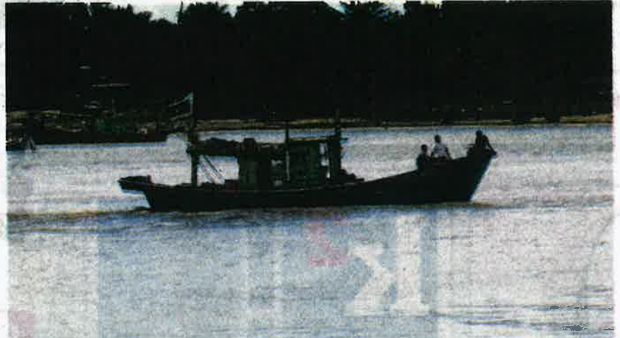
SEBUAH bot nelayan tersangkut pada beting pasir berikutan masalah muara Sungai Dungun yang cetek.