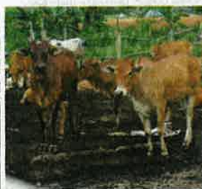
Bidang ternakan diberi fokus dengan matlamat meningkatkan pengeluaran daging tempatan dan keselamatan makanan melalui amalan penternakan baik serta moden.