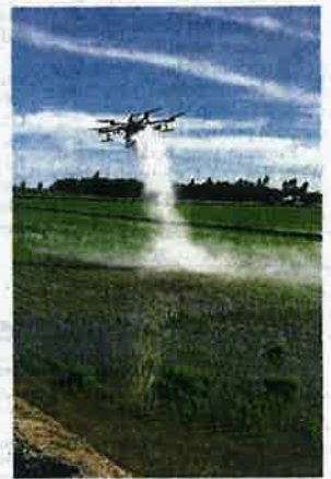
Sektor pertanian akan dipergiat dengan menggunakan teknologi pintar untuk meningkatkan produktiviti.

Katanya, ia dapat meningkatkan keupayaan sektor agromakanan sebagai suatu sektor yang mampan, berdaya tahan dan berteknologi tinggi yang dapat memacu pertumbuhan ekonomi sekaligus meningkatkan kesejahteraan rakyat serta mengutamakan sekuriti makanan negara.