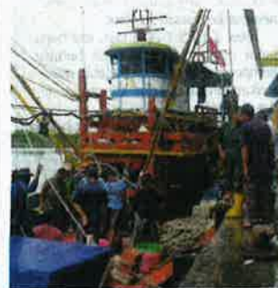
Penggunaan kapal moden dan peralatan inovatif.

Jelasnya, MAFI komited untuk melaksanakan semua strategi yang telah digariskan di bawah RMK12 bagi mencapai sasaran yang telah ditetapkan dalam mencorak semula masa hadapan negara selaras dengan matlamat kemakmuran, inklusiviti dan kemampuan dalam Wawasan Kemakmuran Bersama (WKB) 2030.