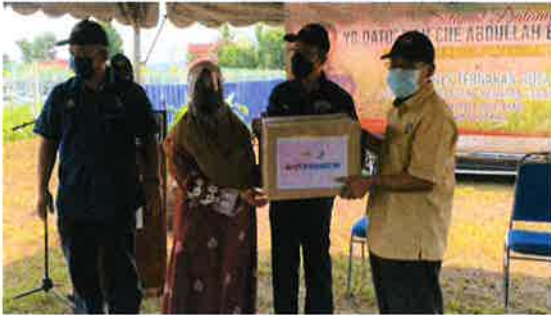
Lembaga Pertubuhan Peladang (LPP).