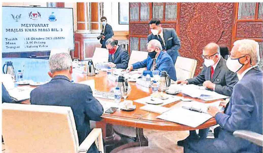
Prime Minister Datuk Seri (Ismail Sabri Yaakob) chairing the Special Council on Malaysia Agreement 1963, while Minister in the Prime Minister's Department (Sabah and Sarawak Affairs) Datuk Seri Dr Maximus Ongkili (second right), looks on.

agreed on empowering both the Sabah and Sarawak governments to issue licenses for deep-sea fishing.