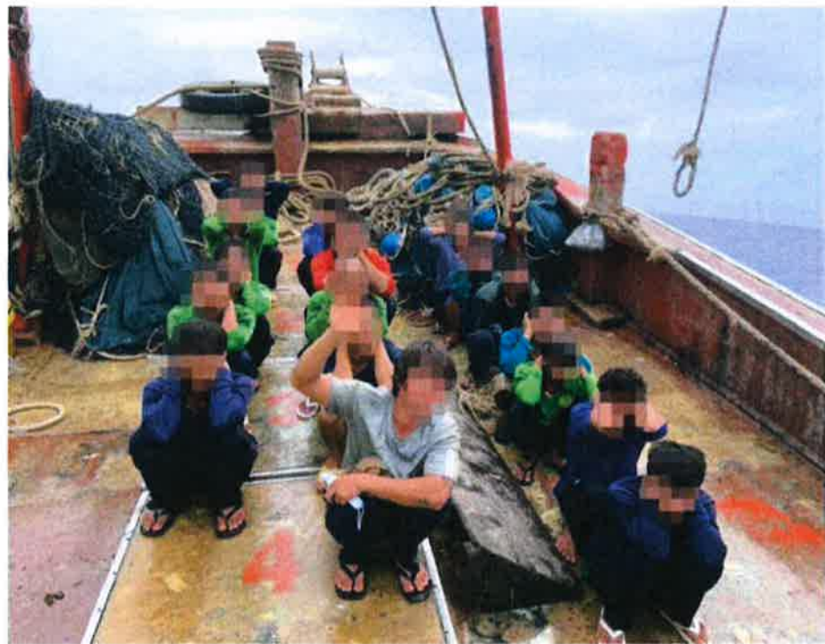
MMEA photo shows the foreign fishermen following their capture.

The 18 crew members including the skipper, aged between 20 and 46, all failed to produce any valid identification documents. They were detained and brought to the Bintulu Maritime Zone