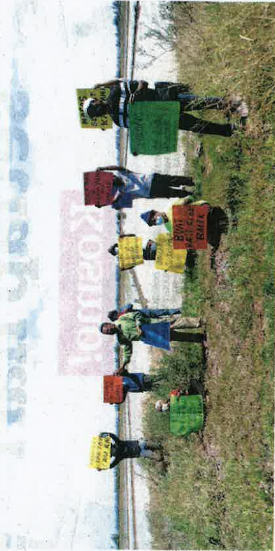
SEBAHAGIAN daripada pesawah yang menyertai himpunan pesawah bagi mendesak benih padi dapat dibekalkan segera di Kampung Tempayan pecah, Jerlun semalam.

Jelasnya, kenaikan harga benih padi membebankan selain hasil jualan padi semakin merosot.