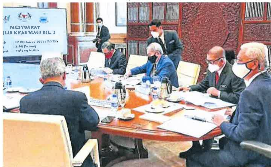
■伊斯邁沙比里（右）主持1963年大馬契約特別理事會會議。

他補充，該項建議原是由沙巴州政府所提出，之後特別委員會也同意此事，並將之擴大至涵蓋砂拉越。