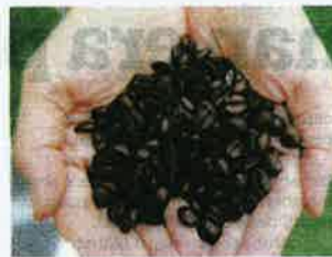
BIJI kopi liberica mempunyai saiz agak besar berbanding biji kopi jenis lain.