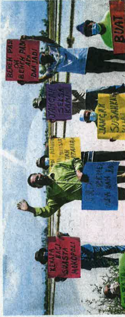
Sebahagian pesawah melakukan bantahan berkaitan kelewatan proses pengagihan benih padi di Kampung Tempayan Pecah, Jerlun, semalam.

Katanya, kerajaan sekali lagi mengubah kaedah pengagihan tahun ini, apabila 12 syarikat diberi hak mengeluarkan benih padi sah selepas berlaku masalah ketika Pertubuhan Peladang Ke-