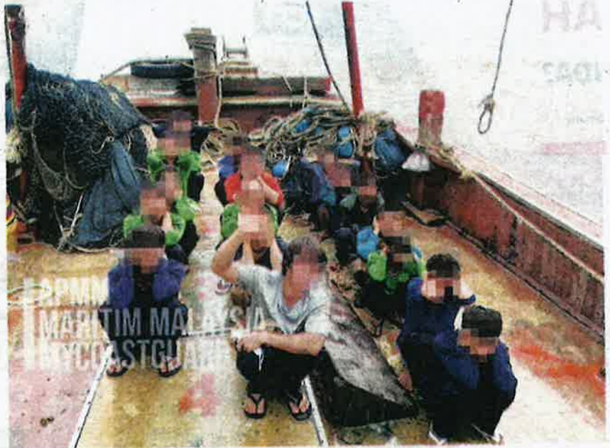
SEBAHAGIAN nelayan warga Vietnam yang ditahan kerana mencero boh perairan Bintulu, Sarawak kelmarin.

“Tekong bertindak mengemudi vesel secara agresif de-