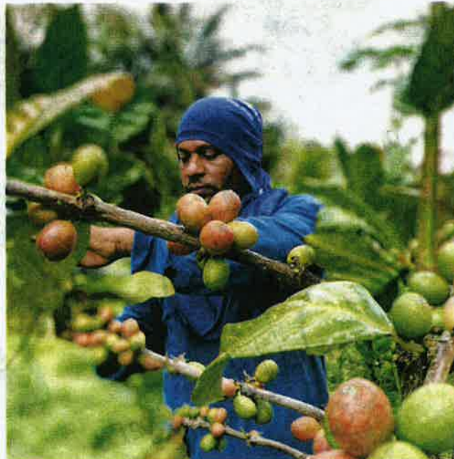
SEORANG pekerja memetik buah kopi liberica yang telah masak.