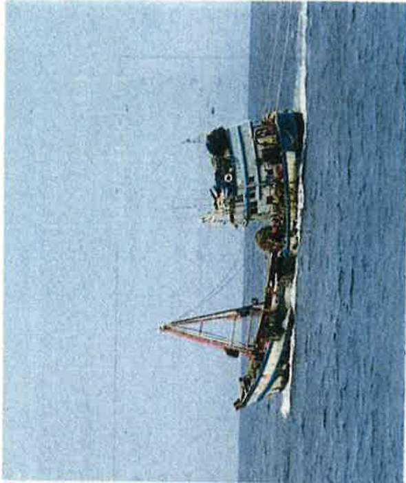
The fishing boat that the Malaysian Maritime Enforcement Agency seized with 18 Vietnamese crew members on Monday in waters off Bintulu.

All crew members were tested for Covid-19 upon arrival at the jetty as a precaution.