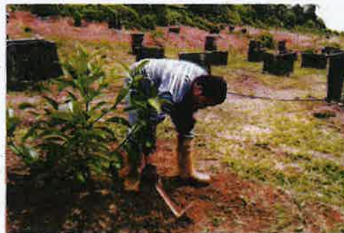
TUKANG kebun WaDI menjalankan kerja-kerja menggembur tanah dan membersihkan kawasan tanaman anak pokok.

"Ini penting supaya pertumbuhan pokok buah-buahan ini mengikut jadual yang dirancang. Lantikan ini juga merupakan satu manifestasi kemanisan wakaf yang disumbangkan. Bahkan kita juga mendapat maklum balas positif daripada masyarakat setempat yang