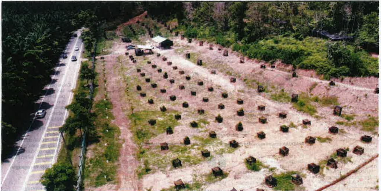
PEMANDANGAN keseluruhan tapak projek Waqaf Dusun Ilmu (WaDI) UTM Melaka kampus Alor Gajah yang dirakam dari udara.

P ROJEK wakaf tanaman buah-buahan UTM cawangan Melaka yang dimulakan Januari lalu kini memasuki fasa kedua iaitu fasa penjagaan, pemeliharaan dan rawatan tanaman pokok buah-buahan pelbagai jenis.