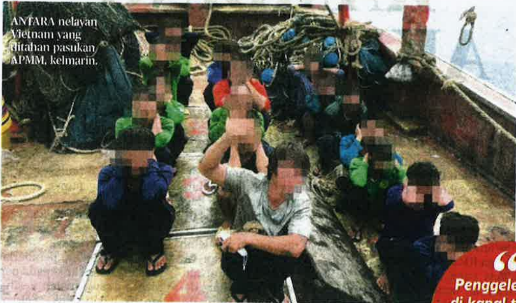
ANTARA nelayan Vietnam yang ditahan pasukan APMM, kelmarin.