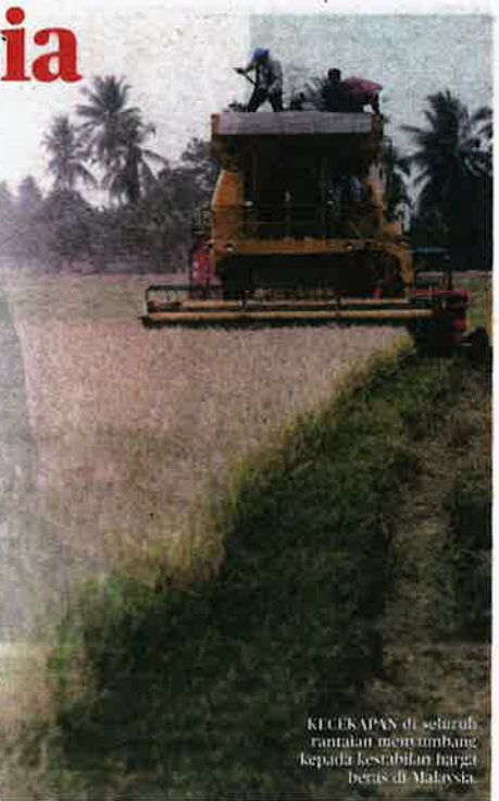
KECEKAPAN di seluruh rantaian menyumbang kepada kestabilan harga beras di Malaysia.

"Melalui penekanan baharu kerajaan kepada kaedah pintar sawah berskala besar (Smart SBB-MAFI), usaha mengkomersialkan beras wangi berkualiti tinggi dilihat mempunyai potensi yang besar," katanya.