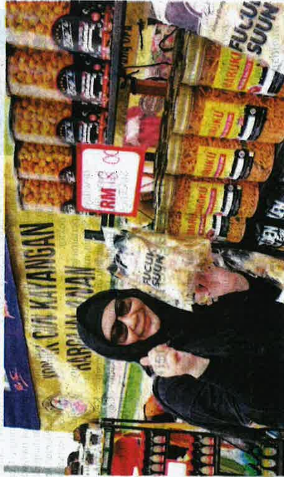
Erma bergambar bersama produk IKS tempatan yang dijual di tapak niaga GeniaSelangor MakCun@FAMA di pasar tani FAMA, Stadium Shah Alam, pada pagi Ahad.

"Apa yang kita lakukan adalah buat satu jalinan kerjasama dalam memasarkan produk baru. Maknanya ada produk daripada Selangor, Kelantan dan Melaka yang buat usaha sama dengan