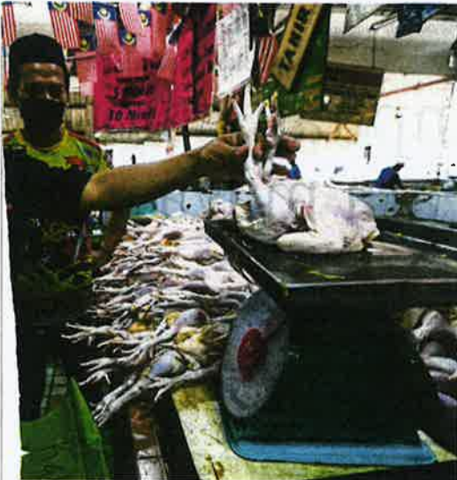
Pemantauan berterusan penguat kuasa KPDNHEP terhadap harga ayam dan telur mampu mengelakkan kenaikan harga.