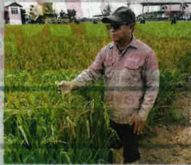
Zam Zam meminta kerajaan menaikkan harga padi berikutan harga racun naik mendadak sejak dua bulan lalu.

Zam Zam memberitahu, pesawah ketika ini bukan sahaja berdepan dengan kos racun yang tinggi, malah input pertanian lain juga mengalami kenaikan harga mendadak.