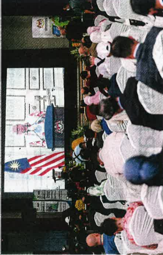
Ismail Sabri menyampaikan ucapan pada Majlis Pelancaran DAN 2.0, yang berlangsung secara hibrid di Menara Lembaga Pertubuhan Peladang, Kuala Lumpur, semalam.