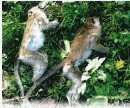
MONYET liar ditemukan mati dipercayai akibat diracun dalam kejadian di Pulau Pinang pada 27 Jun lalu.

bersalah boleh dikenakan denda tidak kurang RM20,000 dan tidak melebihi RM100,000 atau penjara tidak lebih tiga tahun atau kedua-duanya," katanya.