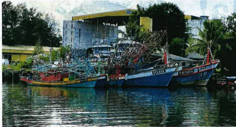
SEBAGIAN bot laut dalam yang tersadai di pelisir Terusan Semerak di Tok Bali, Pasir Putih semalam.

"Sekarang dengan harga baharu RM2.70 kami terpaksa membelanjakan RM27,000 un-