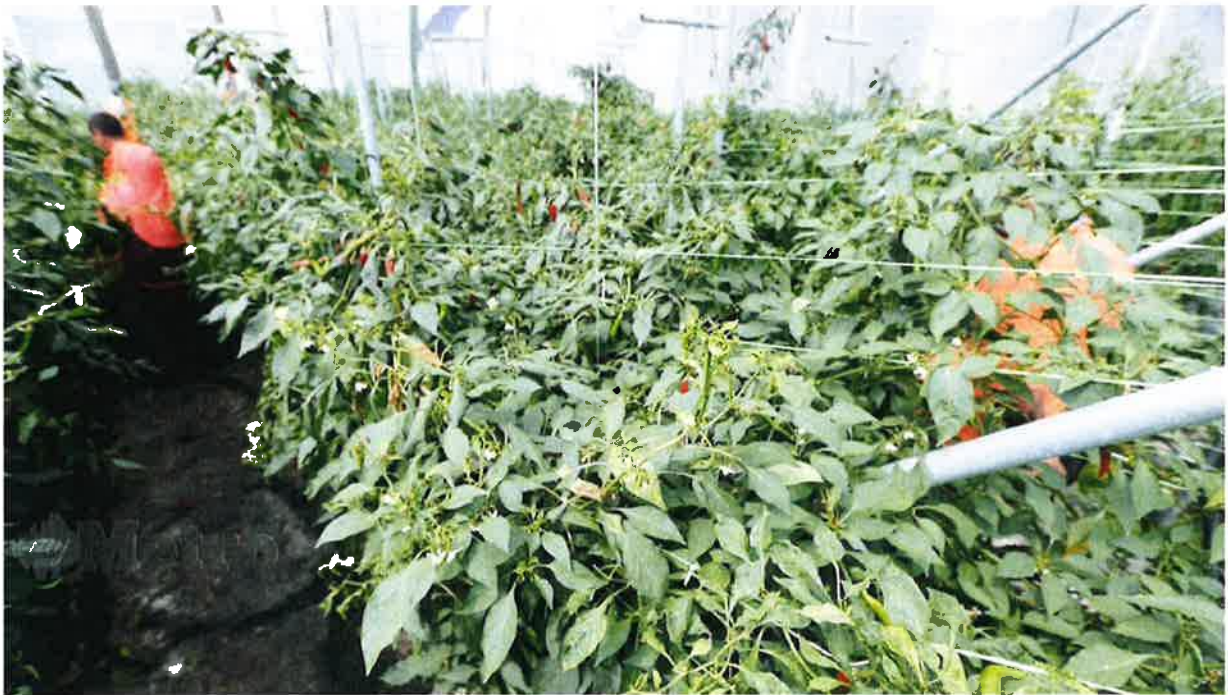
GAMBAR hiasan.

Arau: Persepsi golongan belia terhadap bidang pertanian perlu terus diperbaiki bagi meningkatkan lagi penglibatan mereka dalam bidang itu, sekali gus berupaya untuk 'meremajakan' sektor berkenaan.