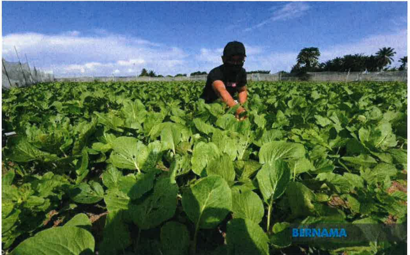
Gambar hiasan

ARAU: Persepsi golongan belia terhadap bidang pertanian perlu terus diperbaiki bagi meningkatkan lagi penglibatan mereka dalam bidang itu, sekali gus berupaya untuk 'meremajakan' sektor berkenaan.