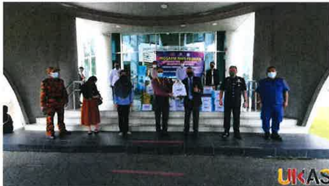
di Ruang Legar, Kompleks Islam Sarawak SibU pada Isnin.

SIBU: Kementerian Pertanian dan Industri Makanan (MAFI) meneruskan program pemberian 'Bakul Prihatin', kali ini kepada petugas barisan hadapan dari jabatan dan agensi di SibU.