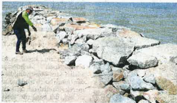
KEADAAN hakisan yang mengancam pangkalan nelayan Kampung Pantai Jaring, Pantai Puteri, Tanjung Kling, Melaka.

lai Ogos lalu diburukkan lagi dengan angin selatan yang mengakibatkan hakisan pantai di kawasan ini.