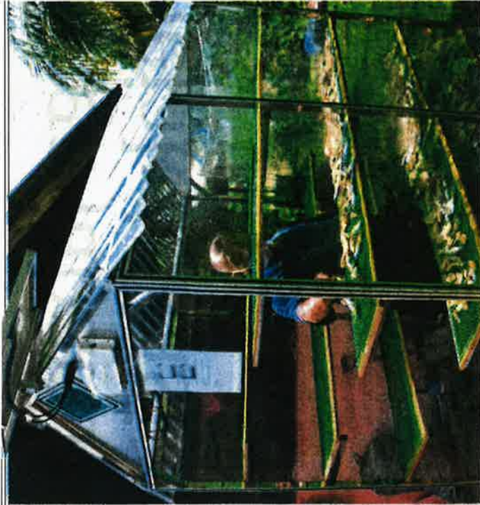
Abu Hassan menghasilkan ikan masin dalam rumah ikan masin yang dijana melalui penggunaan tenaga solar.

Antara ikan menjadi sumber rezekinya termasuk gelama,