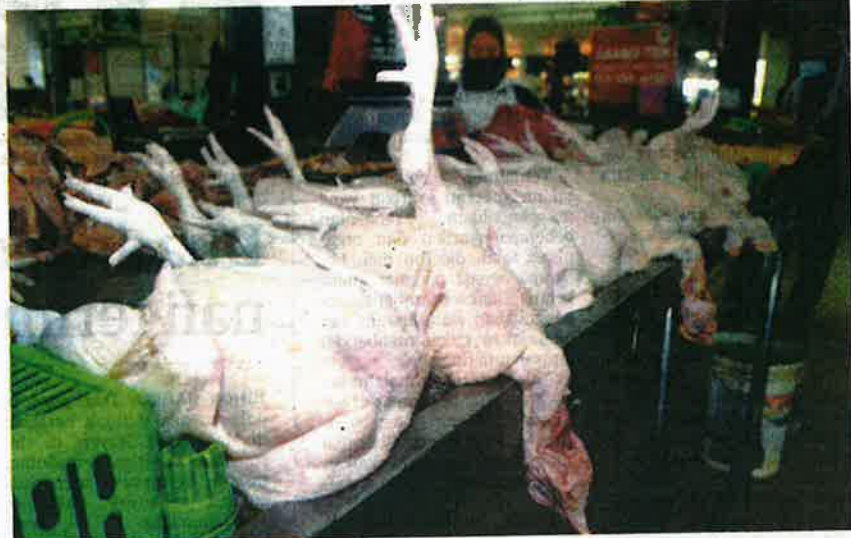
TINJAUAN di Pasar Permatang Manggis, Penaga, mendapati harga ayam melambung naik mencecah harga RM9.50 sekilogram.

"Sudahlah berdepan dengan banyak kenaikan harga bekalan mentah terutama plastik, sekarang terpaksa pula jual ayam