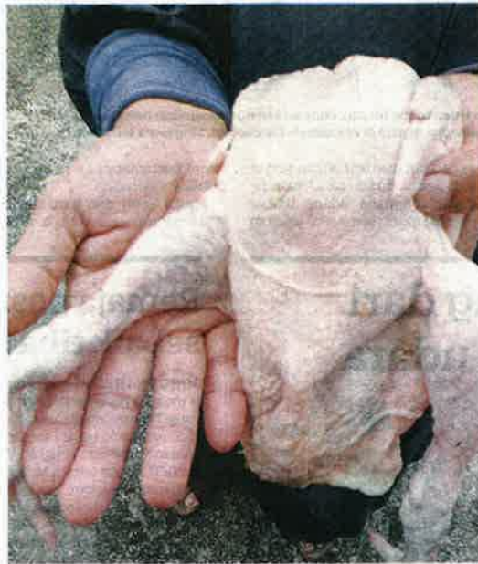
SEORANG peniaga di sebuah pasar awam di George Town terpaksa menjual ayam tidak matang bersaiz hanya sebesar tapak tangan.

"Saya beritahu pembekal, kami sanggup tutup kedai jika perkara ini masih berterusan. Saya nekad serah semula ayam segar itu kepada mereka).