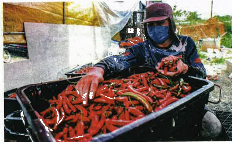
SEORANG pekerja memilih dan membersihkan cili yang baru dipetik dan sedia dijual untuk pasaran sekitar Perlis dan seluruh negara.