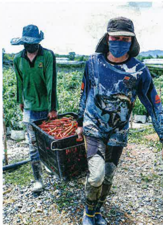
PEKERJA mengangkat cili yang baru dipetik untuk dikumpul dan ditimbang sebelum dijual di pasaran.

import itu secara tidak langsung boleh menjejaskan petani tempatan khususnya daripada segi permainan harga sehingga boleh