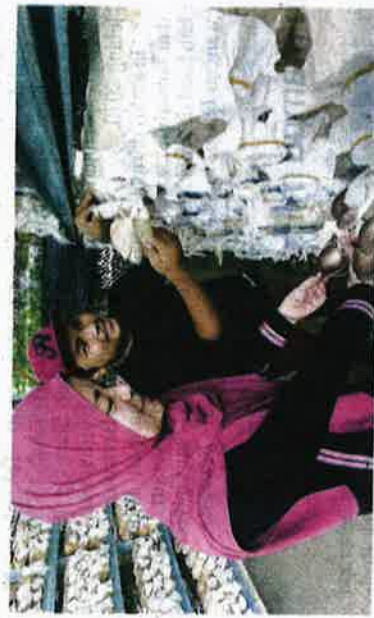
Pasangan ini tidak pernah raih meninggalkan profesion perguruan sebaliknyanya mahu terus berjaya dalam tanaman cendawan yang diusahakannya.

Ujarnya, bekerja sendiri memberi kelebihan untuk dia dan isteri mengatur sendiri masa di samping lebih bebas dan tidak terfongkong.