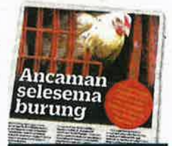
KERATAN Kosmo! semalam.

"Dedak makanan ayam naik lagi RM130 seguni berbanding RM116 pada awal tahun ini.