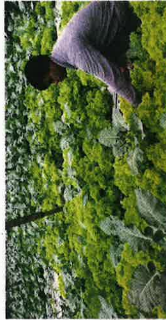
Pekebun sayur berdepan risiko gulung tikar susulan kenaikan mendadak harga baja dan racun.

"Sebagai contoh, kobis bunga sebelum ini bernharga RM8 sekilogram tetapi minggu lalu ia naik sehingga RM18 sekilogram," katanya.