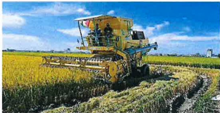
适耕庄本季稻米产量大跌，每份稻田仅有5至6吨产量，稻农叫苦连天。

收入，甚至得借钱还债，即使想转种其他农作物，也得面对转换土地种植用途，和失去所有津贴的难题。”