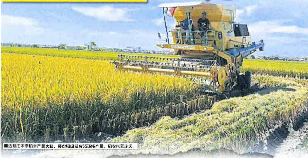
■這轉庄本季稻米產量大跌, 每份稻田僅有5至6噸產量, 稻農叫苦連天。