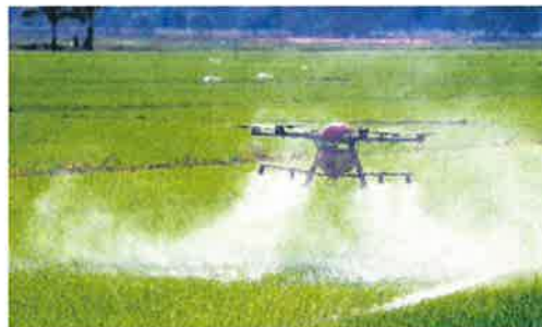
Kos pengeluaran pertanian meningkat berikutan kenaikan harga baja dan racun.

"Memang benar kenaikan yang ketara ini berlaku, disebabkan oleh harga pasaran dunia yang di luar kawalan MAFI dan ini memberi kesan langsung ke-