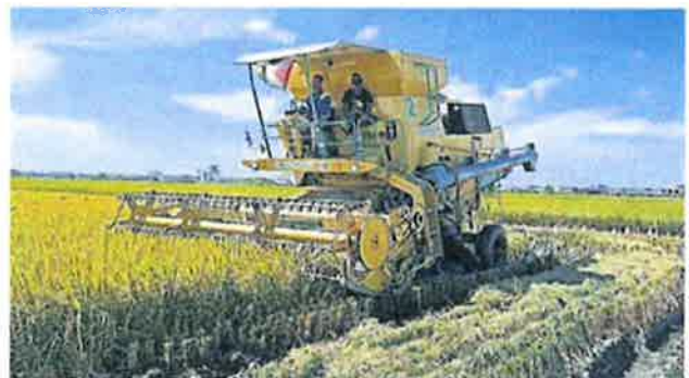
适耕庄本季稻米产量大跌，每份稻田仅有 5 至 6 吨产量，稻农叫苦连天。

会，呼吁农业部体恤稻农十万火急的困境，除发放一次性的 2000 令吉特别援助金，也把扣水率从 20% 降至 17%，协助丹絨加弄、适耕庄至沙白地区的近万农民面对的长期困境。