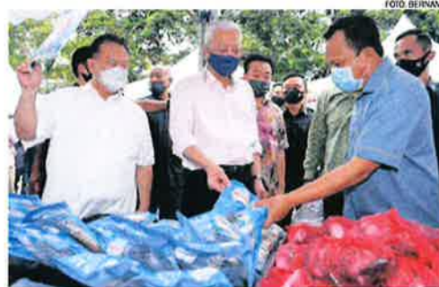
Ismail Sabri (tengah) melawat gerai jualan yang terdapat pada Program Jualan #Keluarga Malaysia KPDNHEP di Blok D PPR Korinchi, Pantai Dalam pada Khamis.

Beliau berkata, usaha kerajaan melalui beberapa kementerian bertanggungjawab mengimport bekalan seperti sayur dapat memastikan ia