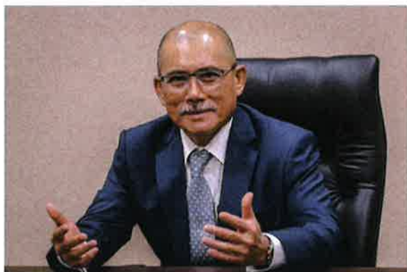
Minister of Food and Industries (MAFI), Ronald Kiandee

The Prime Minister has recently announced several intervention measures, especially to help farmers and paddy farmers who are affected by the issue of rising costs of agricultural inputs, especially fertilizers and pesticides, which has occurred since the COVID-19 pandemic hit the world.