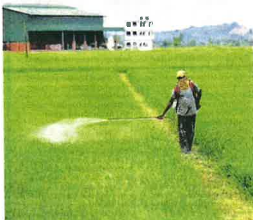
SERAMAI 365,000 pesawah terkesan akibat peningkatan harga baja dan racun sekali gus mengurangkan pendapatan mereka. - GAMBAR HIASAN

KUALA LUMPUR - Kenaikan harga baja hampir 30 peratus, manakala harga racun meningkat kepada 200 peratus mengakibatkan golongan petani terpaksa menanggung peningkatan kos pengeluaran.