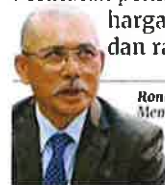
Ronald Kiandee, Menteri Pertanian dan Industri Asas Tani

Secara umum, petani alami peningkatan kos input pertanian sebanyak 21 peratus bagi kategori sayur daun, 17 peratus bagi kategori sayur buah dan buah-buahan berikutan peningkatan harga baja dan racun