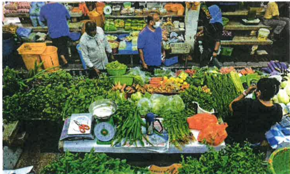
KENAIKAN harga barang dan makanan ketika ini mungkin perlu diterima oleh rakyat tetapi masih ada kos tertentu yang boleh diturunkan untuk menurunkan harga akhir yang ditanggung pengguna.

Semalam, Perdana Menteri, Datuk Seri Ismail Sabri Yaakob berkata, terlalu banyak rantaian perniagaan dengan setiap satunya mengaut keuntungan berlebihan adalah antara punca peningkatan