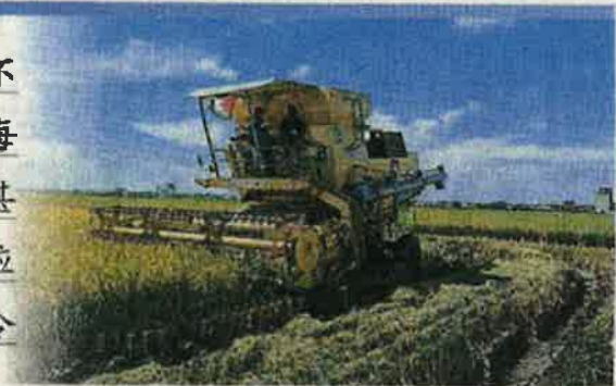
■适耕庄本季稻米产量大跌, 稻农欲哭无泪。

(沙亚南2日讯) 基于农业部提供的谷种素质不稳定, 加上天气与害虫肆虐影响, 适耕庄本季每份稻田产量欠收, 稻农的收入因此大减, 有者甚至倒贴欠债, 因此雪州多名州议员呼吁农业部应体恤稻农十万火急的困境, 发放一次性的2000令吉特别援助金, 以协助稻农熬过本季的挑战。