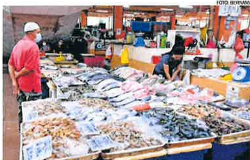
Barangan segar ikan antara yang dijual dalam Program Jualan Keluarga Malaysia.

Pengarah Kanan Sektor Perdagangan Pengedaran