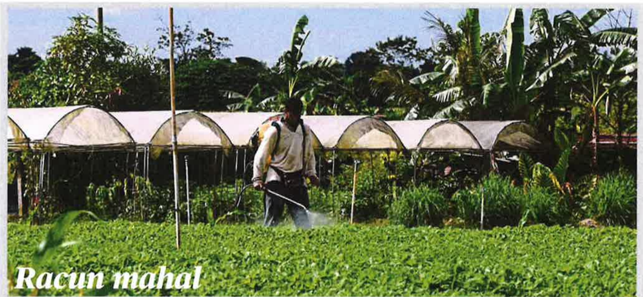
Tasek Gelugor: Seorang pekerja menyembur racun serangga di ladang sayur di Taman Kekal Pengeluaran Makanan (TKPM) Ara Kuala di sini. Menteri Pertanian dan Industri Makanan (Mali) Datuk Seri De Ronald Klandee menyatakan harga racun serangga meningkat sehingga 150 peratus lalu RM60 kepada RM97.50. Selain itu harga racun kulat juga mencatatkan peningkatan 2077 peratus, racun siput hampir 20 peratus, baja sebatian Tera Blue sebanyak 84 peratus, Agrobrylge 131 peratus dan NPK Blue 14.5 peratus. Beliau berkata kenaikan harga itu di luar kawalan Mali berikutan peningkatan harga pasaran dunia, sekali gus memberi kesan langsung kepada pengeluaran di tangkang petani. Sehubungan itu, katanya, pihak kementerian memperkenalkan langkah alternatif dengan melaksanakan pengurangan keberagaman dan peralihan baja kimia kepada organik, selain memperkenalkan pelbagai pendekatan serta pengamalgaman perkhidmatan bagi jangka panjang.