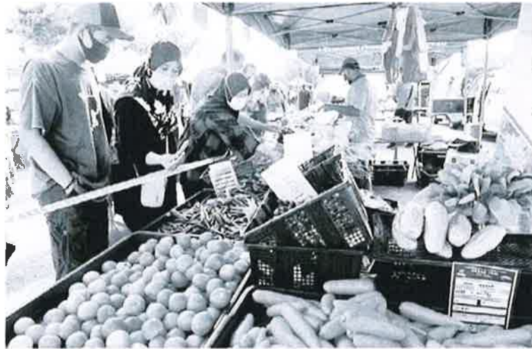
SAMBUTAN BAIK: Sebahagian pelanggan membeli sayur-sayuran segar yang dijual pada program Jualan Keluarga Malaysia di Pasar Tani Stadium Paroi dekat Seremban Negeri Sembilan, semalam.