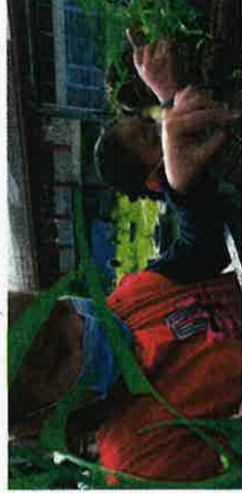
Murid didedahkan dengan cara menanam sayur secara fertigasi.

Tegasnya, sekolah berkenaan juga bercadang membesarkan lagi projek fertigasi itu dengan menyemai benih sayur lain pula.