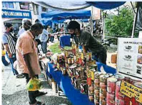
大馬一家促銷活動的日常用品比市價便宜20%,接下來會在各個國會選區內舉辦。

今日活動由甲貿酒局,大馬聯邦農業銷售局,大馬漁業發展局等单位配合,同時獲得近丁霸級市場,家家購物中心,NSK超市及永旺購物中心等策略伙伴的參與。