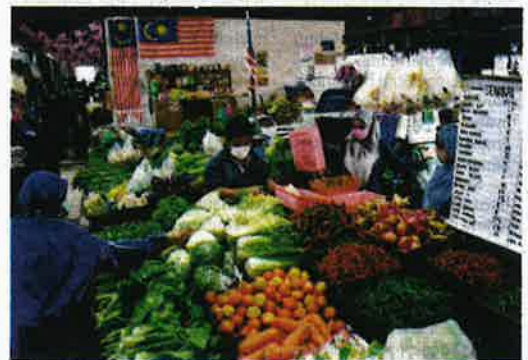
Petani perlu mempunyai akses berterusan ke pasaran untuk memperkasakan sistem rantaian bekalan makanan bagi mengelakkan insiden kekurangan makanan.

"Antaranya petani mesti mempunyai akses berterusan ke pasaran, memastikan bekalan input pertanian seperti benih, baja dan makanan ternakan tidak