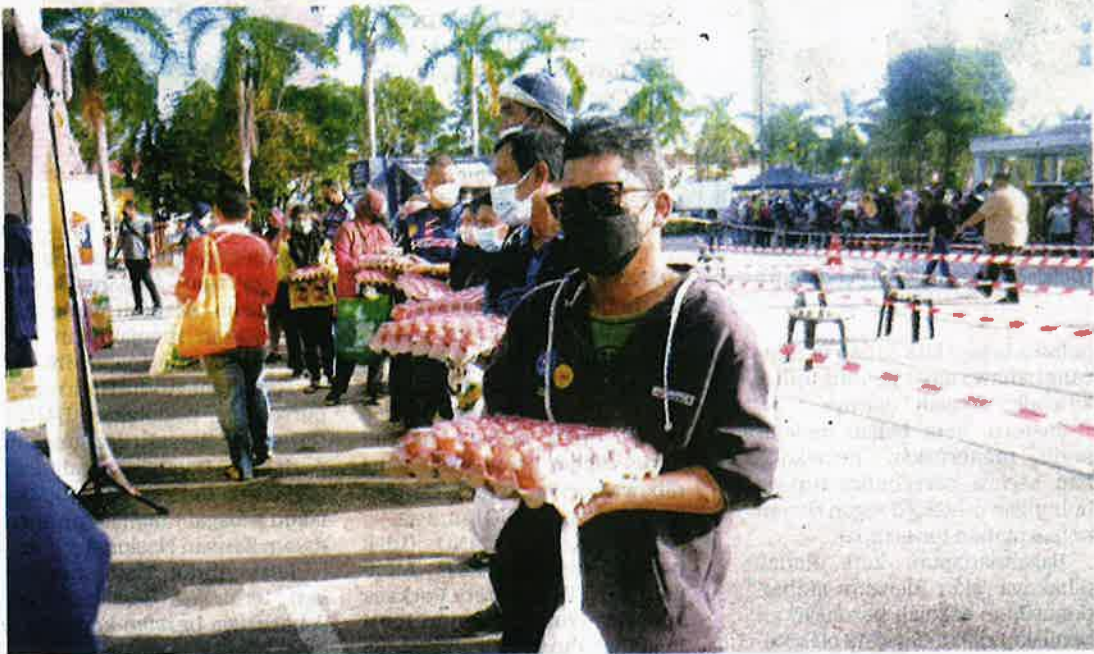
PENGUNJUNG beratur membeli telur murah di pekarangan Wisma TNB, Kepala Batas semalam.

"Saya harap program sebegini diteruskan dan diperbanyakkan bagi membantu mereka yang kurang berkemampuan membeli barang keperluan," katanya.