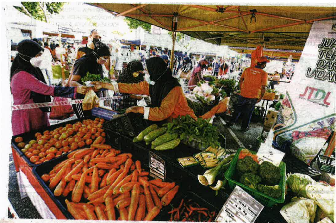
ORANG ramai mengambil peluang membeli sayur-sayuran pada harga murah di Pasar Tani Paroi Jaya, Seremban semalam. – MOHD. SHAHJEHAN MAAMIN.