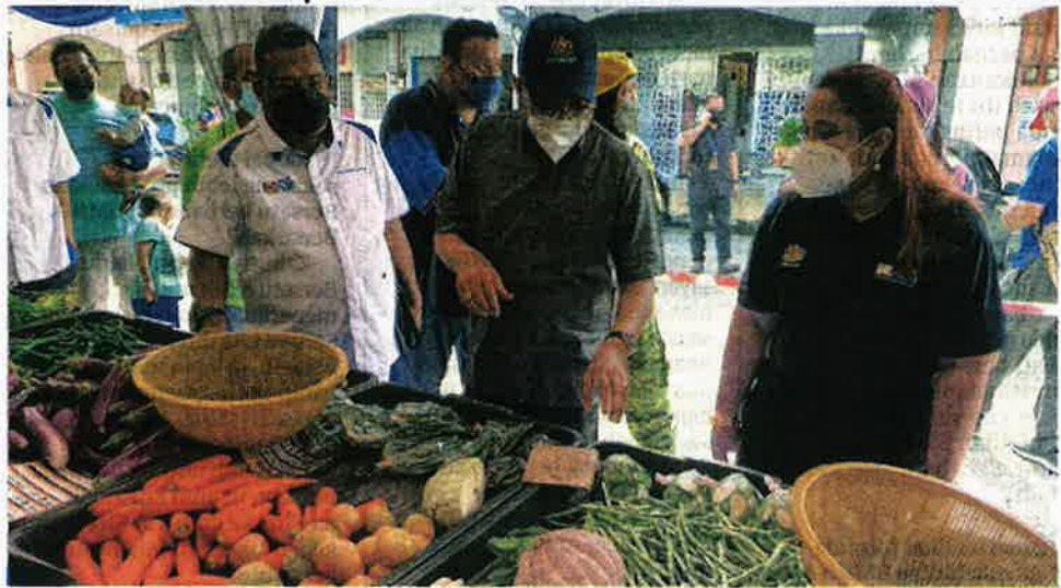
HASNOL Zam Zam Ahmad (tengah) meninjau Program Jualan Keluarga Malaysia (PJKM) di pekan Kuala Sungai Baru, Alor Gajah, Melaka.

kelmarin itu disertai enam agensi kerajaan dan 13 syarikat yang menawarkan pelbagai bahan makanan, termasuk ayam pada harga lebih rendah berbanding pasaran.