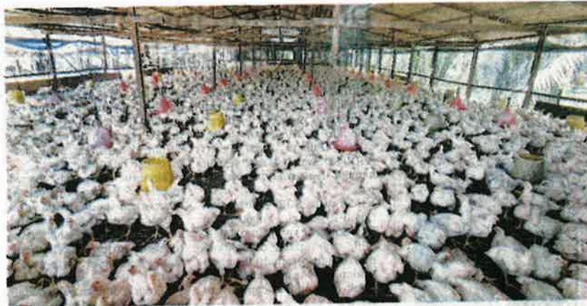
HARGA makanan ayam yang mahal di pasaran membuatkan penternak tertekan selepas terpaksa menanggung kenaikan kos yang tinggi. - CAMBAR HIASAN