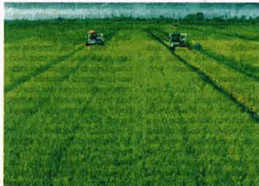
Kerajaan perlu mewartakan segera kawasan pertanian yang menyumbang kepada bekalan makanan sebagai zori sekuriti makanan negara dengan segera.