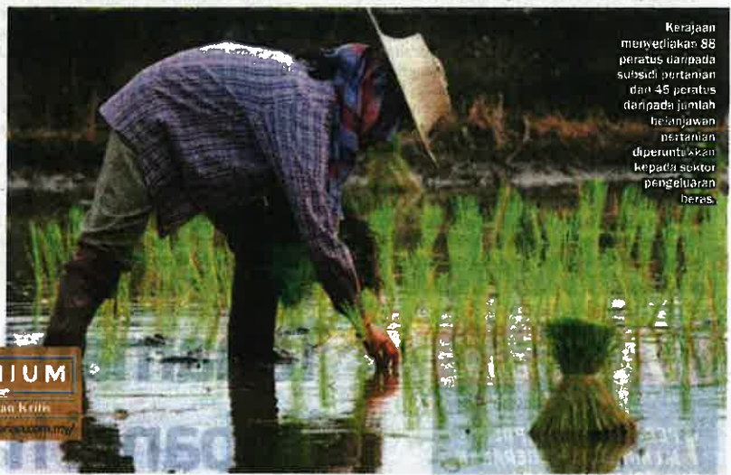
Kerajaan menyediakan 88 peratus daripada subsidi pertanian dan 45 peratus daripada jumlah belanjawan pertanian diperuntukkan kepada sektor pengeluaran beras.

"Walaupun peningkatan pengeluaran beras tempatan adalah penting, namun ia mungkin tidak benar-benar menangani kebimbangan terhadap sekuriti makanan di Malaysia, memandangkan peralihan corak penggunaan makanan yang didorong pertumbuhan penduduk, tahap pendapatan yang lebih tinggi, tahap pambandaran dan