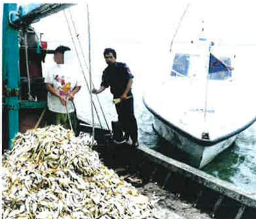
Nelayan warga asing yang ditahan kerana mencuri hasil laut negara.

"Peruntukan ini telah pun disalurkan ke Agrobank dan sedia untuk dipohon. Program ini bukan hanya akan meningkatkan daya saing nelayan tempatan malah turut menitik beratkan penyelesaian