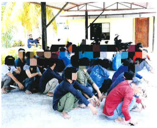
Nelayan warga asing yang ditahan untuk siasatan lanjut kerana menceroboh perairan negara.