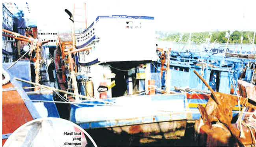
Vesel nelayan asing yang dirampas Jabatan Perikanan Malaysia.

Tegas beliau, bagi warga tempatan yang sekongkol dengan warga asing pihaknya tidak teragak-agak untuk ambil tindakan tegas.