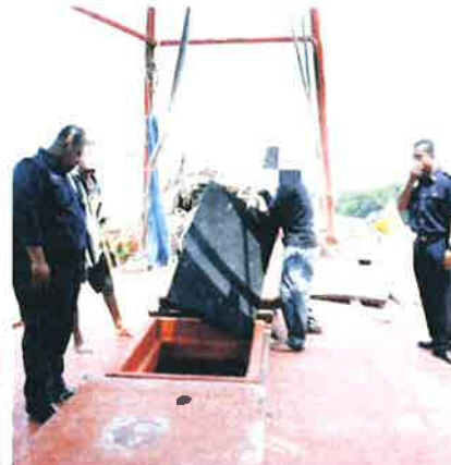
Bot nelayan warga asing diperiksa oleh anggota Jabatan Perikanan.