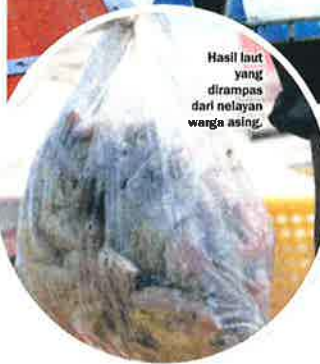
Hasil laut yang dirampas dari nelayan warga asing.