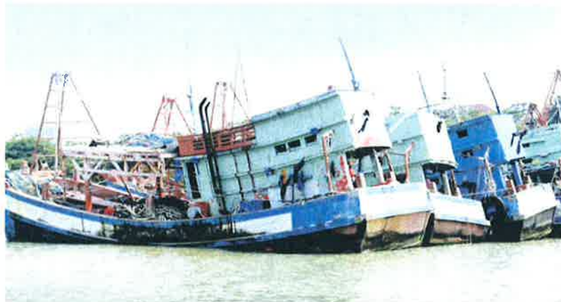
Vesel nelayan asing yang dirampas kerana menceroboh perairan negara.

Katanya, nelayan asing merupakan nelayan bukan warganegara Malaysia yang melakukan aktiviti penangkapan ikan di perairan negara.