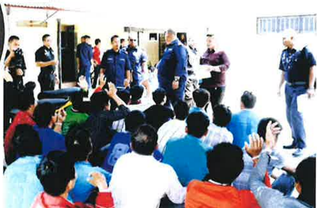
Jabatan Perikanan Malaysia bertindak menahan nelayan warga asing yang terlibat menceroboh masuk perairan negara dan mencuri hasil laut.

Tambahnya, pihaknya memohon kerajaan agar dapat menambah aset khususnya buat Maritim Malaysia atau DOF untuk bersama-sama mengawal sempadan negara daripada kemasukan nelayan asing.