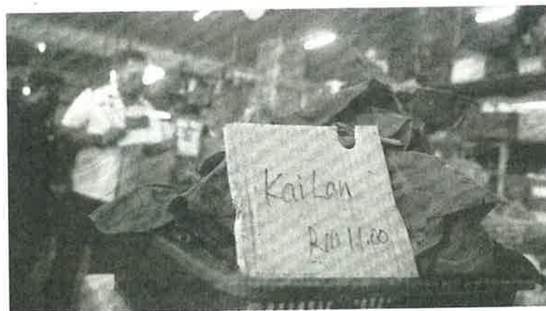
SEBANYAK 50 peratus keperluan makanan kita boleh ditanam sendiri.

Antara negara yang ada pelan sedemikian adalah Jepun dan Korea Selatan. Sebelum ini Korea Selatan lagi mundur daripada Malaysia. Saya masih ingat semasa saya masih muda sekitar 1950-an, 1960-an,