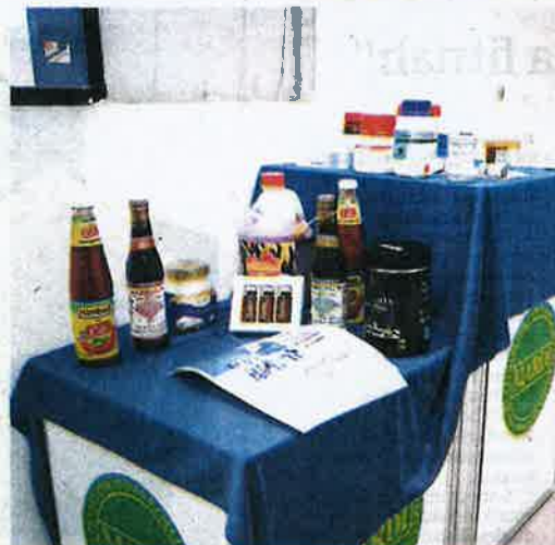
ANTARA produk yang telah dianalisis di MARDILab.