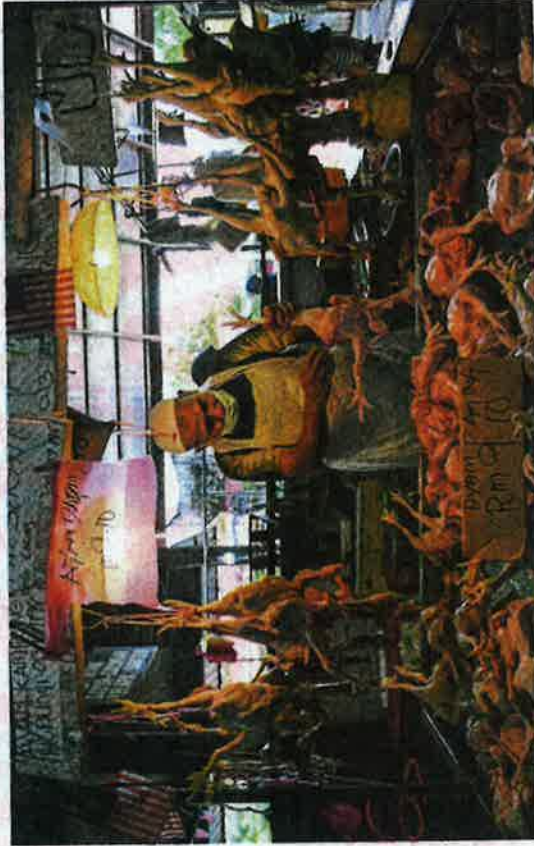
Tinjauan di Pasar Chabang Tiga, Kuala Terengganu mendapati penurunan harga ayam membantu rakyat dapatkan barangan keperluan pada harga muiatsabah.

Katanya, kebenaran itu hanya diberi bagi tempoh tiga bulan bermula Disember 2021 sehingga Februari 2022 dengan pemantauan ketat MAFI. "Pada awal Disember lalu, ada kekurangan ayam sehingga harga melambung dan rekod kita menunjukkan kita kurang bekalan ayam di pasaran apabila sektor ekonomi kembali dibuka. Jadi kita perlu tambah bekalan (depan mengimport)." "Kita bagi kelonggaran sementara untuk menampung kekurangan, jika pengeluaran ayam tempatan adalah mencukupi dan harganya stabil, kita akan hen-