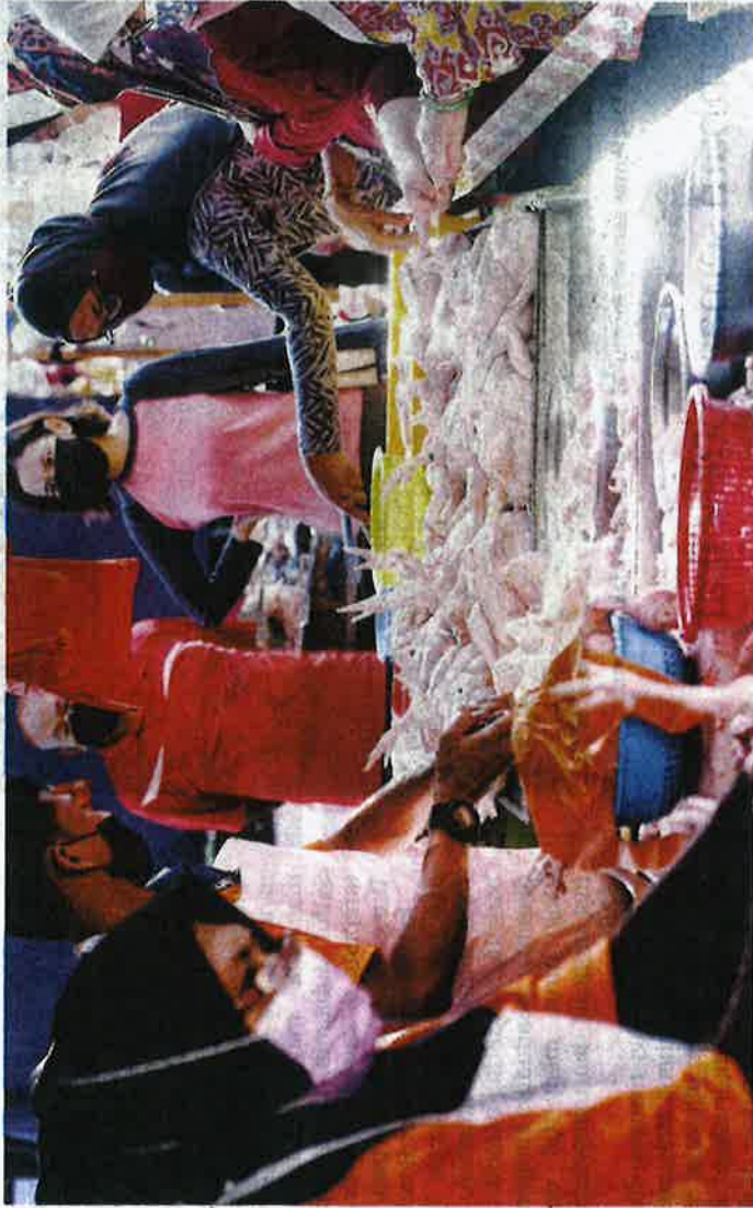
HARGA ayam standard di beberapa tempat mula dijual murah dan ada yang dibawah paras siling hingga mendorong kerajaan melanjutkan SHMKM sehingga 4 Februari depan. - GAMBAR HIASAN

Laporan disiarkan laman rasmi FAMA itu namun menunjukkan Kanger, Perlis; Kuala Terengganu, Terengganu dan Seremban, Negeri Sembilan dijual tinggi da-