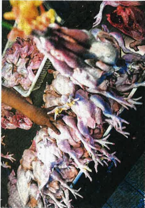
The price of chicken soared last month due to low supply.

"If the local chicken production is sufficient and the price is sta-