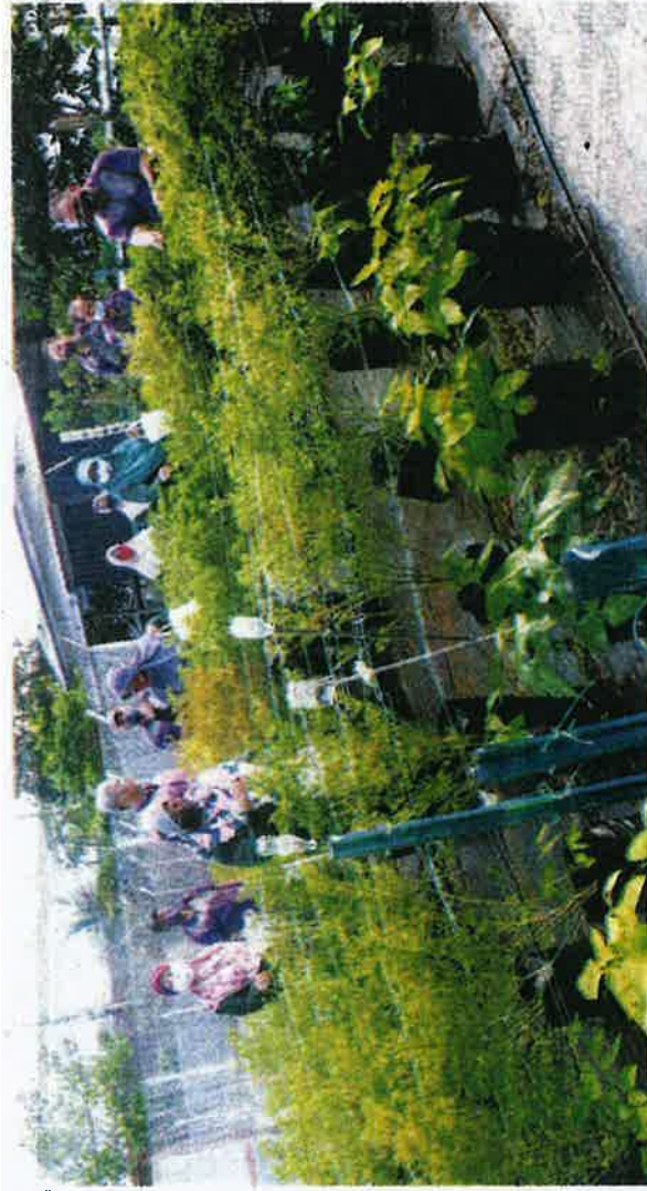
AHLI Jawatankuasa KRT Taman Nilam/Taman Nong Chik memetik cili centil yang dulusahkan melalui Program Kebun Komuniti di Taman Nilam, Pontian baru-baru ini.