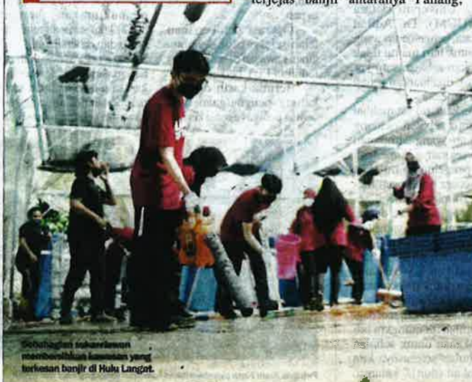
Sukarelawan membersihkan kawasan yang terjejas banjir di Hulu Langat.