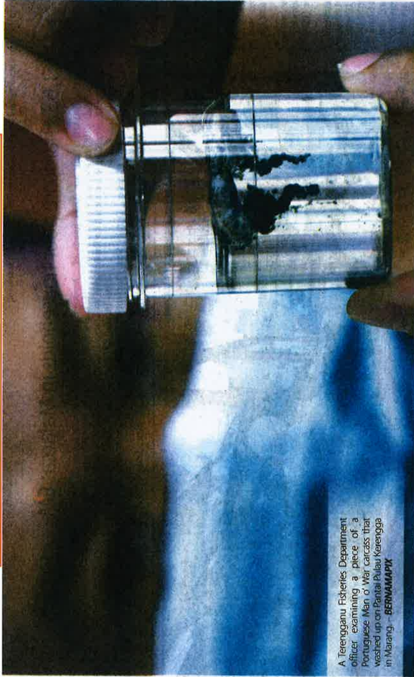
A Terengganu Fisheries Department officer examining a piece of a Portuguese Man of War carcass that washed up on Pantai Pulau Kerangga in Marang.