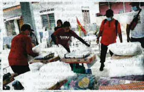
Sukarelawan menyusun barang yang akan dibagikan kepada mangsa banjir.