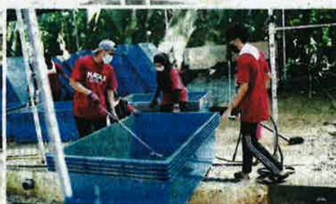
Sukarelawan membersihkan kawasan pembalakan udang yang terjejas di Hulu Langat, Selangor.