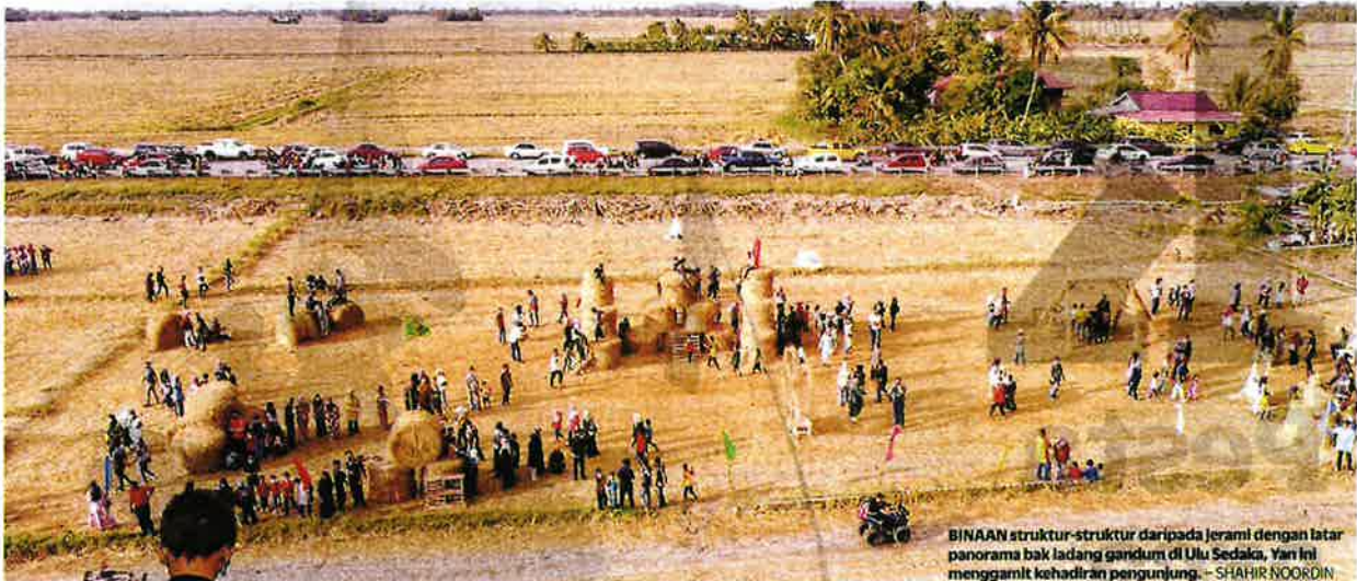
BINAAN struktur-struktur daripada jerami dengan latar panorama bak ladang gandum di Ulu Sedaka. Yari ini menggamit kehadiran pengunjung.