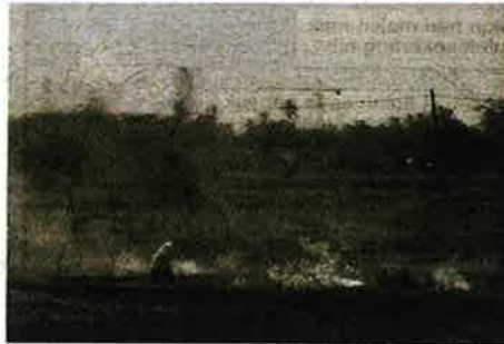
AKTIVITI membakar jerami padi boleh memberi kesan tidak menyenangkan kepada penduduk di Perlis. - GAMBAR HIASAN