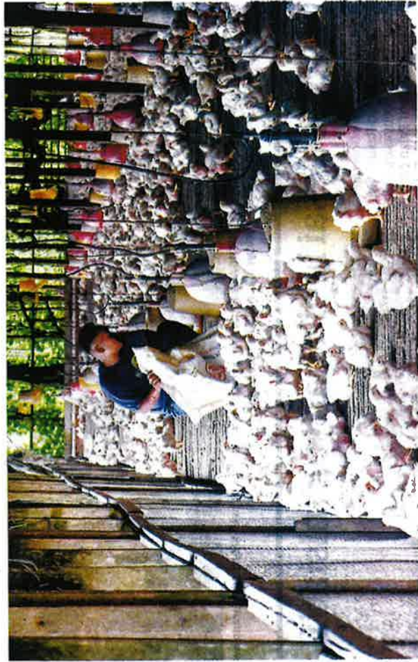
RAMAI pengusaha ladang ternakan dijangka mengalami kerugian sekiranya kos operasi seperti harga dedak meningkat tinggi. - GAMBAR HIASAN

kira 3,000 penternak ayam di seluruh negara yang mengeluarkan lebih dua juta ekor ayam dan lebih 30 juta telur dalam masa