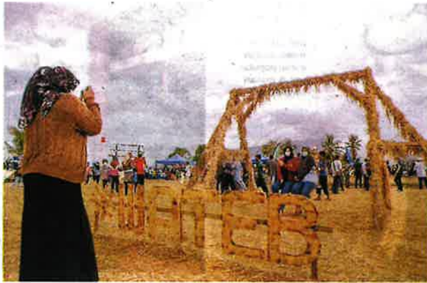
ORANG ramai mengambil peluang bergambar pada struktur berbentuk buaian di Pesta Jerami Castle.

juga menjadi lokasi penganjuran perhimpunan traktor, bekho, pertunjukan paramotor, motocross serta persembahan lukisan dan steelwool.