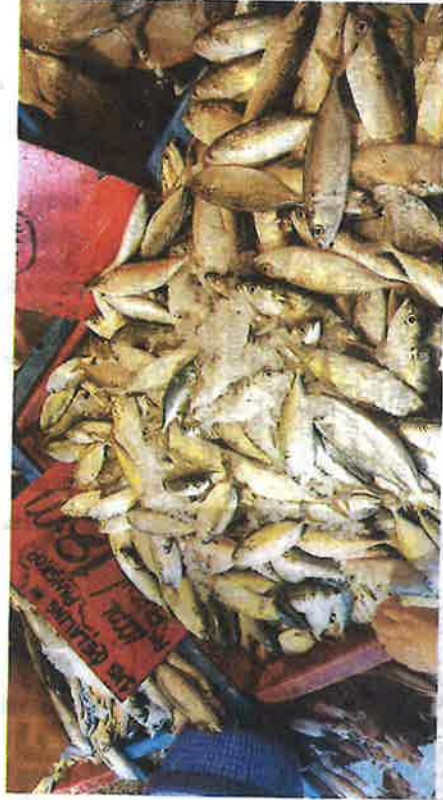
Ikan pelaling mengalami peningkatan harga sebanyak RM2 sekilogram sejak Tahun Baharu Cina minggu lalu.

"Jika bekalan yang sampai harga murah, kita jual murah, kalau mahal, kita jual mahal. Kita ikut harga daripada pembekal," katanya.