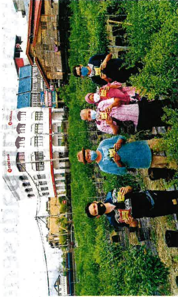
AHLI kariah Masjid Melayu di ladang cili fertigasi yang mereka usahakan di Jalan Selat, Teluk Intan, Perak.

"Kami memulakan tanaman cili di tanah ini menerusi kaedah fertigasi pada pada 1 Okto-