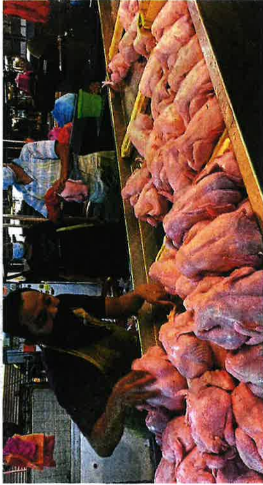
Ensuring the welfare of the Malaysian Family: Under SHMKM, the maximum price of standard chickens has been lowered to RM8.90 per kg, while ceiling prices of chicken eggs will remain the same until June 5.

Another method to control inflation is to intensify the Keluarga