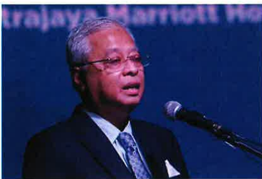
ISMAIL SABRI YAAKOB

Beliau berkata, bantuan kedua ialah dana tambahan RM50 juta akan disediakan melalui Skim Pembiayaan Informal dan Mikro (SPIM) di bawah TEKUN Nasional khusus untuk perniagaan mikro dan informal yang terjejas akibat banjir dengan pinjaman mikro sehingga RM10,000 tanpa faedah di mana tempoh bayar balik adalah sehingga 5 tahun dengan moratorium 12 bulan.