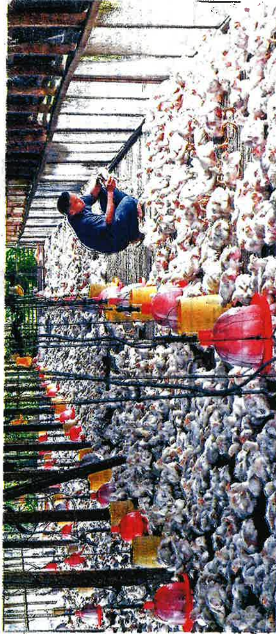
KERAJAAN setuju memberi subsidi kepada pentermak ayam sebanyak 60 sen sekilogram, menjadikan harga ayam hidup di peringkat ladang RMS.90 sekilogram dan harga runcit ayam bulat standard RMS.90 sekilogram.

"Walaupun berlangsung tempoh singkat, ia tepat pada masanya di saat kenaikan harga kedua-dua barangan itu selepas sambutan Tahun Baharu Cina