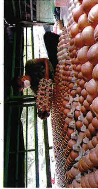
PENGUSAMA telur ayam di negara ini akan mendapat subsidi daripada kerajaan sebanyak 5 sen bagi setiap biji.

"Sebagai pengguna, sudah pasti mahukan harga barang yang berpatutan dan dalam kawalan terutamanya bahan mentah seperti ayam, telur ayam dan sayur," tambahnya.