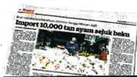
KERATAN Kosmo 5 Disember 2021.

"Saya harap status halal yang dinilai Jabatan Kemajuan Islam Malaysia (Jakim) perlu diperluaskan kepada beberapa negara lain supaya kita mempunyai lebih banyak pilihan terutamanya dari negara Asia Barat," katanya kepada