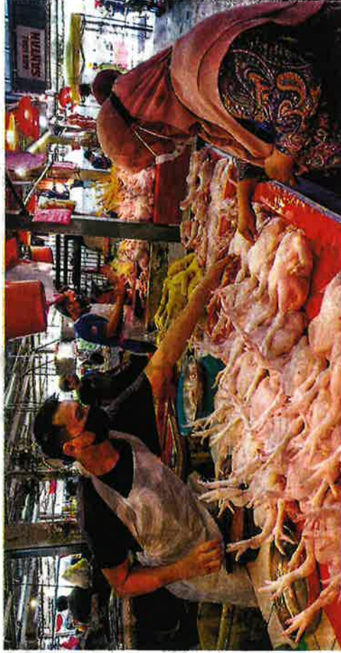
ORANG ramai berharap harga ayam dapat dikurangkan atau diturunkan sedikit selepas kerajaan bersempaja memberikan subsidi sehingga bulan Jun tahun ini.