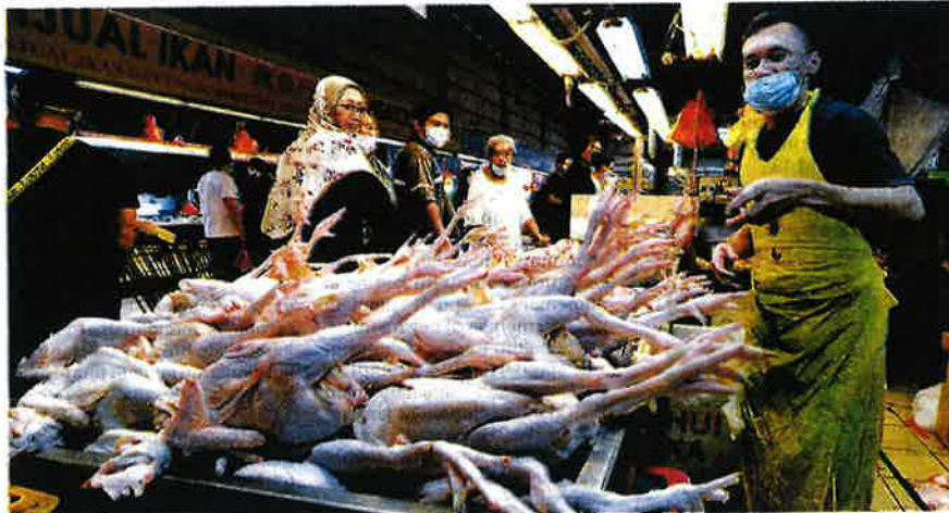
BEKALAN ayam di negara ini dijangka berkurangan biarpun kerajaan memberikan AP kepada beberapa pengusaha pasar raya bagi mengimbangi stok bahan mentah itu. - GAMBAR HIASAN

Jakim diminta nilai status halal ayam negara lain