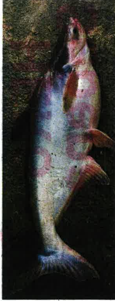
Jabatan Perikanan Pahang tawar harga lebih tinggi kepada nelayan yang mahu menjual Patin Muncung bagi mengelakkan spesies pupus.

Beliau berkata, Pusat Pengembangannya, Perikanan Perik-