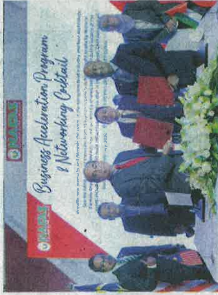
Entri (dapan, kiri) pada Majlis pemeteraian MoU antara Nafas dan Urbanex Gulf Corporate Services pada Isnin.

Minggu Pertanian Lestari di Pavillion Malaysia dihoskan