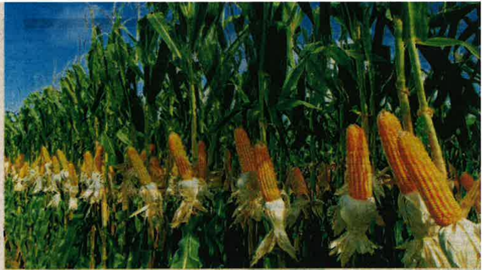
BAGI mengurangkan pergantungan daripada pasaran global, Malaysia merancang untuk mengeluarkan sekurang-kurangnya 30 peratus daripada keperluan jagung bijirin menjelang 2032. — GAMBAR HIASAN

Sebagai contoh, nilai ringgit menyusut daripada RM2.12 bagi AS$1