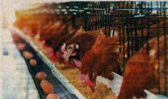
NEGARA menghasilkan lebih 5.5 juta ayam pedaging dan merupakan pengeksport bersih ayam pedaging dan telur sejak tahun 2000. — GAMBAR HIASAN