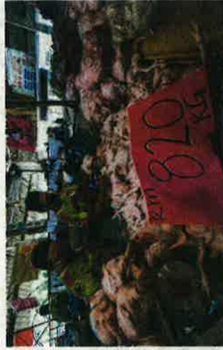
TINJAUAN penjualan ayam segar di Pasar Besar Alor Setar, semalam.

"Saya menggunakan konsep sama-sama berkongsi rezeki. Bagi saya semua peniagaan ada keuntungannya, cuma beza untung banyak atau sedikit, katanya yang sudah 36 tahun berniaga di Pasar Besar Alor Setar.