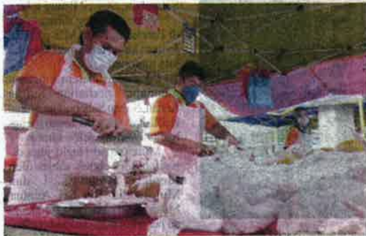
Peniaga akui berdepan kekurangan harga ayam sejak minggu lalu.

Mengulas mengenai penetapan harga RM8.90 berkuat kuasa Sabtu, beliau menjelaskan kerajaan tidak mahu membebankan rakyat dengan kenaikan harga barangan selepas musibah banjir besar pada Disember tahun lalu.