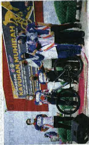
Saarani menyampaikan hadiah utama cabutan bertuah kepada salah seorang peserta program Kayuhan Muhibah Kesatuan Kakitangan Kemas Semenanjung Malaysia, Cawangan Perak di Dewan Serbaguna Taman Kota Tamapan, Lenggong pada Ahad.

Beliau berkata demikian an selepas merasmikan