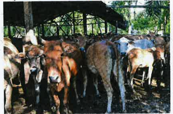
Projek ternakan lembu secara mega antara sasaran dalam RMK-12.