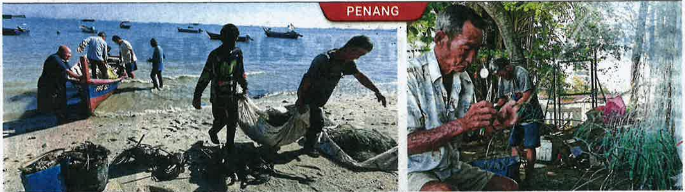
Fishermen returning with nets full of flower crabs and a variety of shellfish.