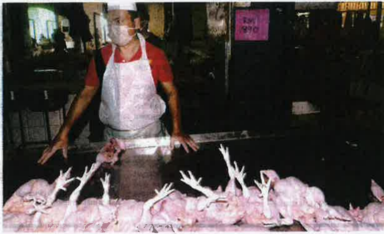
BAHAGIAN Jualan ayam di pasar menjadi perhatian pelanggan untuk membeli pada harga yang murah.

"Kami berasa lega sekarang, sekurang-kurangnya ia dapat meringankan beban belanja dapur sebab sebelum ini harga barang semuanya naik belaka, itu cabaran kami sekarang ni," katanya kepada Kosmo semalam.