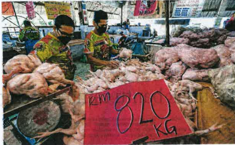
Peniaga di Pasar Besar Alor Setar menjual ayam segar RM8.20 sekilogram.