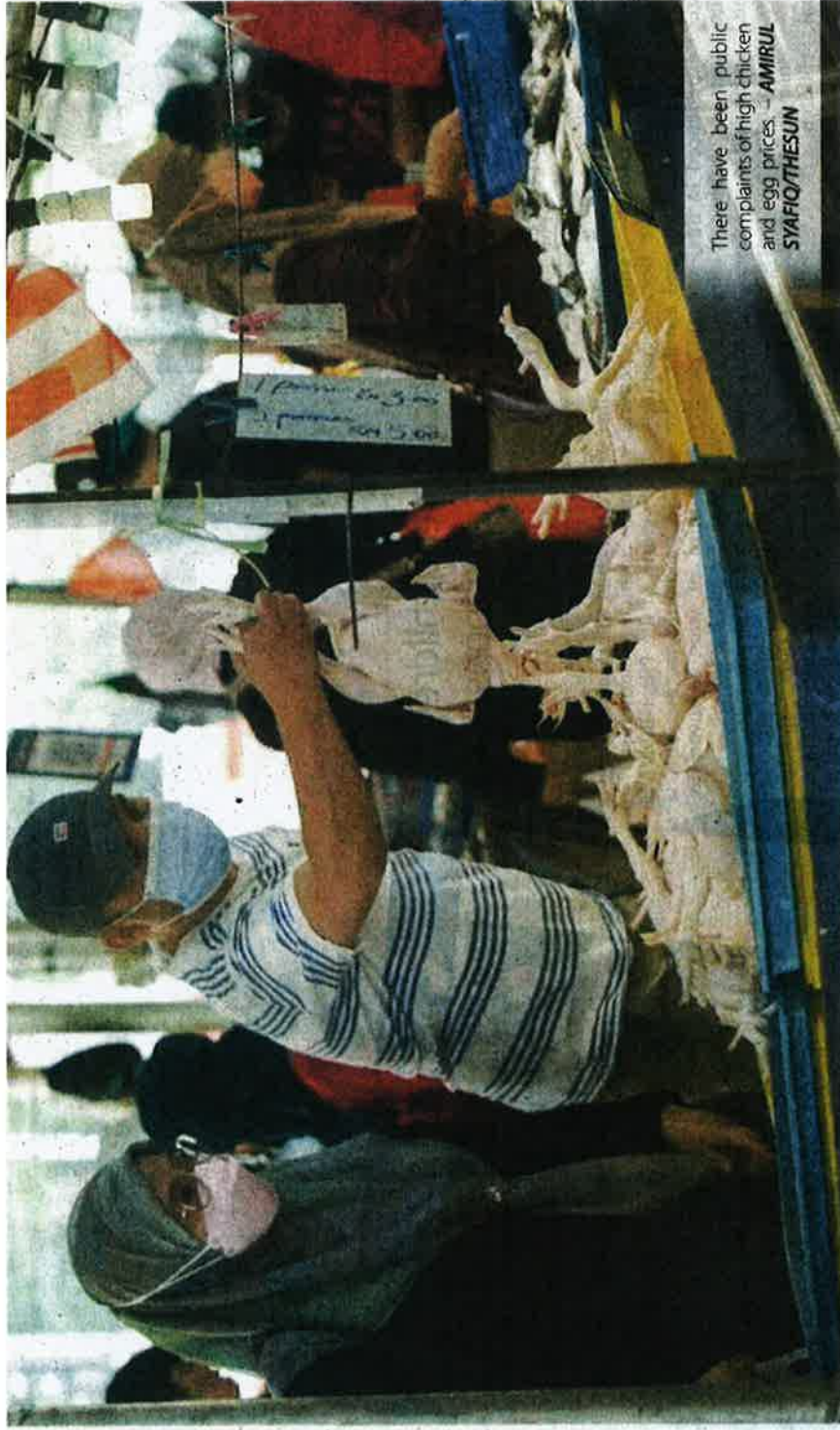
There have been public complaints of high chicken and egg prices.