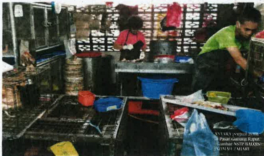
ANTARA SOROKAN AWAM PASAR GADUH RAPAT, SAMBIL NSTP BALOIS, KAJANG, SELATAN