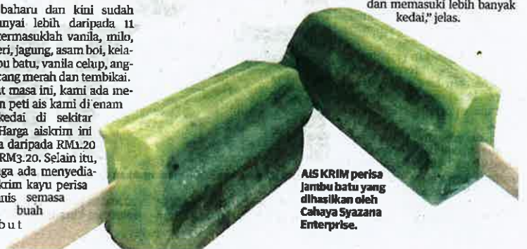
AIS KRIM perisa jambu batu yang dihasilkan oleh Cahaya Syazana Enterprise.

"Apabila mendapat pensijilan ini, adalah lebih mudah untuk kami memasarkan produk ini ke pasar raya di sekitar zon utara dan memasuki lebih banyak kedai," jelas.