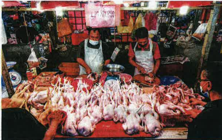
LANGKAH peniaga meletakkan tanda harga di gerai meyakinkan pelanggan bahawa peniaga mematuhi harga maksimum ayam yang ditetapkan oleh kerajaan.