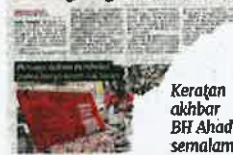
Keratan akhbar BH Ahad semalam

lima tahun... industri ini akan berjaya," katanya.