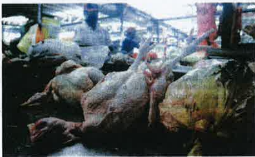
KPDNHEP Melaka melakukan pemeriksaan di lebih 50 lokasi melibatkan pasar, pasar tani dan pasar raya di seluruh negeri itu dan mendapati bekalan mencukupi.

Bagaimanapun, beliau menjelaskan pengimportan ayam dari Thailand, China dan Brazil itu akan dihentikan sebaik sahaja bekalan ayam di negara ini pulih.