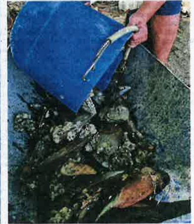
A variety of shellfish, some which are exotic, that were caught by fishermen.

"Occasionally, we get exotic crabs or shellfish such as meio meio , a large sea snail. This is a delicacy not for the faint-of-heart," concluded Phang.