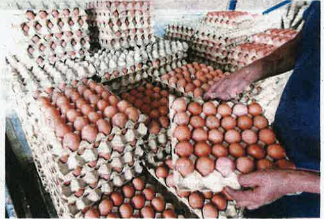
PENIAGA runcit di Masjid Tanah mendakwa mempunyai bekalan telur yang mencukupi.