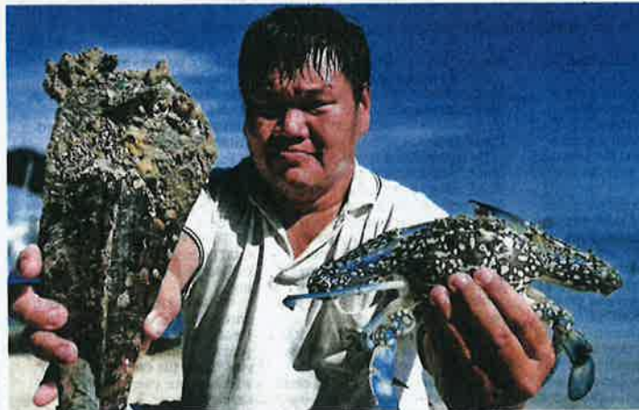
Phang showing the horn clam (left) and flower crab (right) caught in the net by fishermen off Jalan Sultan Ahmad Shah.

"We need to study the tide, flow of current and seasons, when the animals are active or available. We