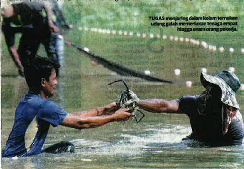
TUGAS menjaring dalam kolam ternakan udang galah memerlukan tenaga empat hingga enam orang pekerja.

Kolam Pancing Jidin Jenggo mengenakan bayaran RM20 bagi tempoh masa satu jam, RM50 bagi tiga jam manakala RM90 bagi lima jam.