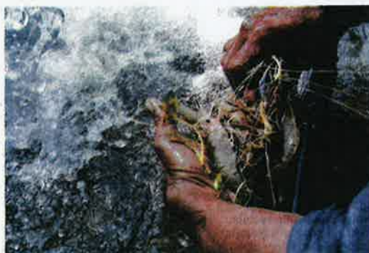
UDANG-UDANG galah dipilih mengikut saiz. Udang galah yang masih kecil saiznya akan dilepaskan semula ke dalam kolam.

Katanya, pulangan lumayan hasil ternakan udang galah telah membuka matanya bahawa bidang ternakan itu memiliki pulangan ekonomi yang baik.