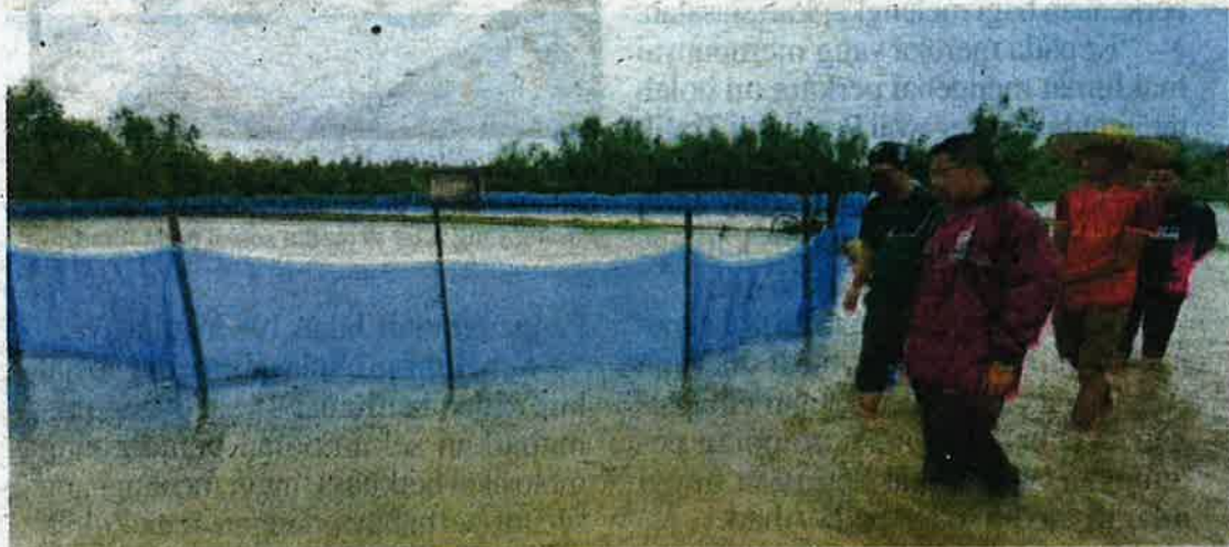
Azman (tiga dari kanan) ketika meninjau kolam benih ikan siakap seluas 100 hektar yang diusahakan 80 penternak akuakultur di Kampung Keluang, Besut yang ditenggelami air ekoran hujan lebat dan air pasang besar.

“Tabung ini juga bukanlah bantuan ganti rugi tetapi sagu hati supaya petani, penternak dan nelayan yang terkesan dengan musibah mampu bangkit bertani dan memernak semula,” katanya.