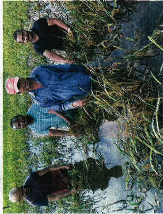
PETANI menunjukkan keadaan padi mereka yang rosak akibat ditenggelami banjir di Beris Chalok, Pasir Puteh, semalam.

PASIR PUTEH: Lebih 40 hektar padi masak yang diusahakan 100 pesawah di lima kampung, di sini mungkin rosak dan terbuang begitu sahaja jika air banjir yang bertakung dalam bendang tidak segera dialir keluar.