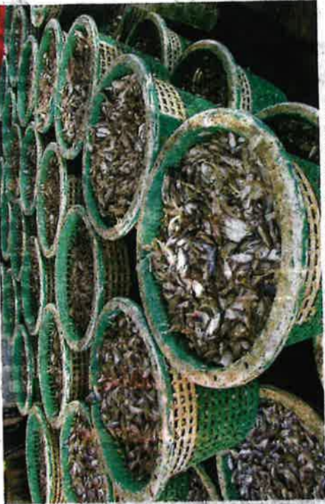
Pelbagai jenis anak ikan mati akibat terperangkap oleh tindakan bot pukot tunda.

Menurutnya, pencerobohan dikesan bermula sekitar jam 12 tengah malam hingga 6 pagi meliputi kawasan antara 100 meter hingga empat kilometer dari persisiran pantai termasuk di sekitar Pulau Bidan, Tanjung Jaga dan Singkir.