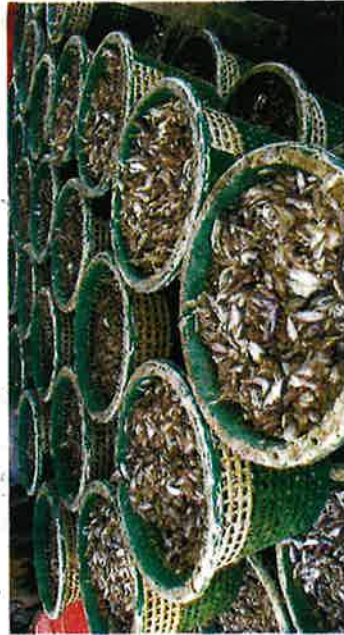
PELBAKAI jenis anak ikan dan hidupan laut yang terperangkap dalam bot tunda dan rawa sorong penceroboh perairan Kuala Muda dan Yan.

"Penceroboh bot pukak tunda disyaki berpangkalan di Kuala