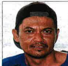
Faidarus: We now have to go out a further 20km to land more fish.

He said the feeding frenzy peaked during full moon or a new