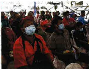
Antara peserta nelayan yang hadir untuk menerima bantuan pada program berkenaan.