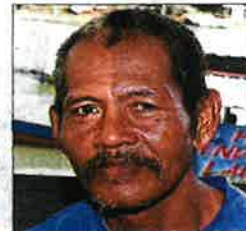
Haron: The squid and prawn seasons have changed.

Ismail, who called it a day in 1984 but still regularly meets with