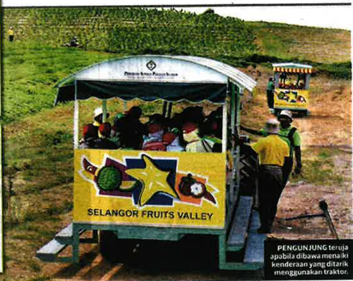
PENUNJUNG teruja apabila dibawa menaiki kenderaan yang ditarik menggunakan traktor.