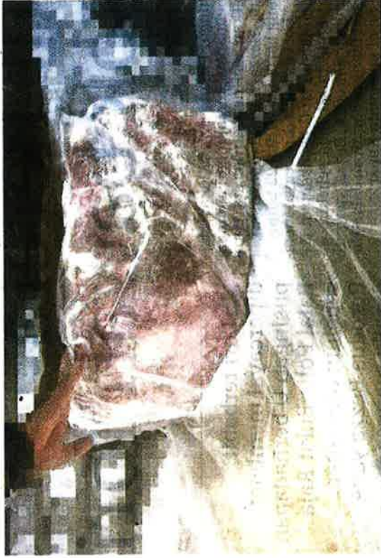
Daging kerbau sejuk beku dari India dirampas MAQIS di Pelabuhan Klang Barat, Sabtu lalu.

kerbau sejuk beku dianggar 1,120 karton dengan nilai RM323,000 ditahan untuk tindakan lanjut.