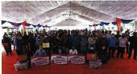
Penerima bantuan bergambar bersama selepas menerima bantuan pada program Jelajah Dialog Industri Agromakanan 2022.

"Ini merupakan pendekatan baharu yang dibuat oleh MAFI iaitu membuat proses pemutihan untuk mendaftarkan dan memberikan lesen baharu kepada nelayan tulen yang juga nelayan sepenuh masa," katanya ketika ditemui pemberita selepas