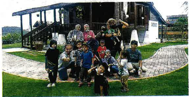
ORANG ramai boleh mengabadikan memori di halaman rumah klasik yang diperbuat daripada kayu.