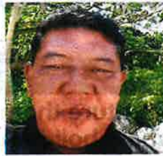
Azli says land reclamation along the shoreline has shrunk their fishing zones.

"Fishermen normally repair damaged nets every month; now they