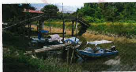
PANGKALAN Nelayan Kampung Ramuan Cina Kecil, Masjid Tanah.

supaya memancing atau menjaring dengan betul dan bukannya membuang racun tuba ke dalam sungai semata-mata untuk meraih keuntungan jangka pendek," katanya.