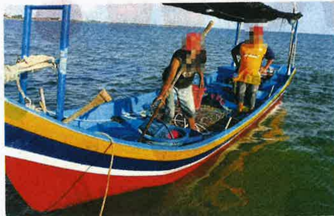
ANTARA yang ditahan menjalankan kegiatan penangkapan siput retak seribu secara haram di perairan Kuala Perlis.

APMM tahan lima nelayan termasuk dua tekong