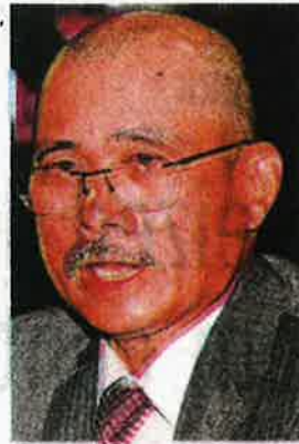
Datuk Seri Dr Ronald Kiandee

On Tuesday, MetMalaysia reported that the maximum temperature was slightly higher in the Klang Valley and the interior of Pahang.