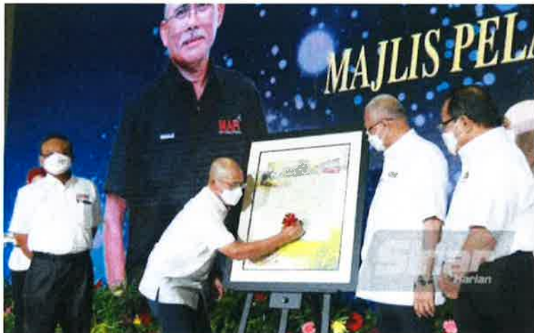
Dr Ronald menyempurnakan gimik pelancaran Jubli Emas 50 Tahun Pertubuhan Peladang Kebangsaan di Ibu Pejabat Nafas.

Majlis tersebut dirasmikan Menteri Pertanian dan Industri Makanan (MAFI), Datuk Seri Dr Ronald Kiandee.