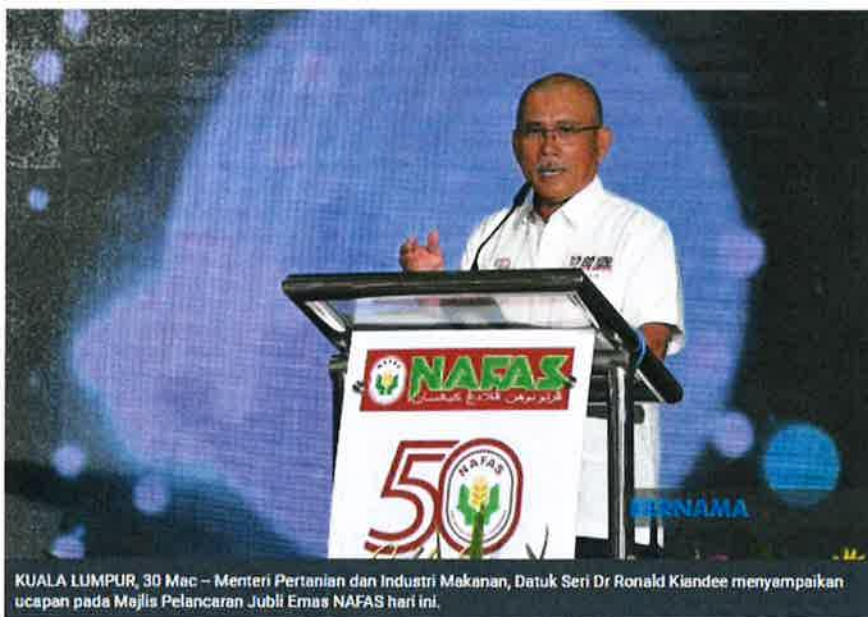
KUALA LUMPUR, 30 Mac – Menteri Pertanian dan Industri Makanan, Datuk Seri Dr Ronald Kiandee menyampaikan ucapan pada Majlis Pelancaran Jubli Emas NAFAS hari ini.

KUALA LUMPUR, 30 Mac (Bernama) -- Kementerian Pertanian dan Industri Makanan (MAFI) memberi jaminan bekalan daging mencukupi pada Ramadan dan Syawal ini, kata Menteriinya Datuk Seri Dr Ronald Kiandee.