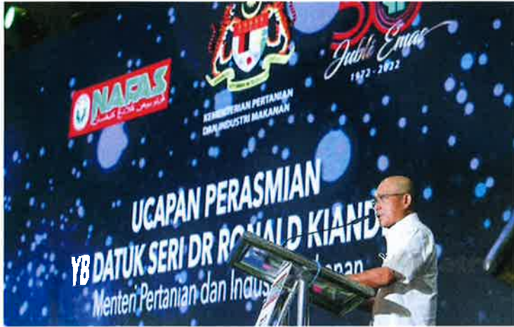
DATUK Seri Dr Ronald Kiandee menyampaikan ucapan perasmian pada Majlis Pelancaran Jubli Emas 50 Tahun