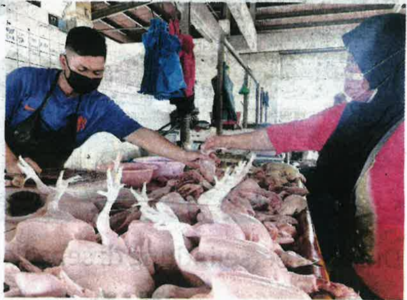
KENAIKAN harga ayam di pasaran di beberapa negeri didakwa angkara kartel.

Utusan Malaysia sebelum ini melaporkan keluhan orang