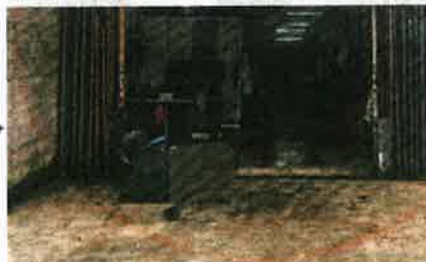
ANTARA premis pemborong di sekitar Klang, Puchong dan Kajang yang dikompaun kerana menjual ayam pada harga borong melebihi harga ditetapkan.

"Justeru, mereka dikenakan kompaun serta merta masing-masing dengan nilai RM1,000 yang membawa jumlah keseluruhan kompaun RM3,000," katanya, semalam.