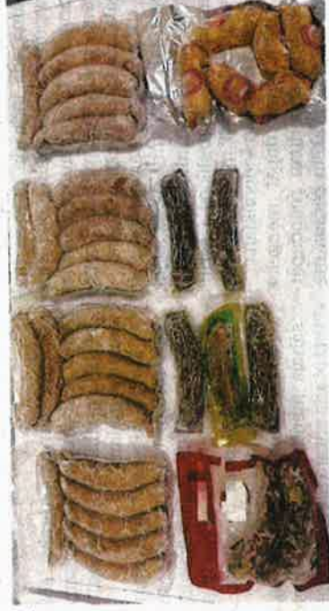
SOSEJ daging babi yang dirampas Maqis di KLIA disahkan positif ASF.

"Virus ASF ini tidak akan menjangkiti manusia dan ia hanya menjangkiti babi. ASF sangat mudah merebak dan mampu menyebabkan kadar kematian yang sangat tinggi sehingga 100 peratus dalam kumpulan ternakan itu," ujarnya.