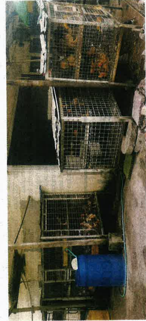
SALAH satu premis pemborong yang dikenakan tindakan kompaun selepas menjadi punca kenaikan harga ayam di beberapa pasar awam dan basah di Selangor.