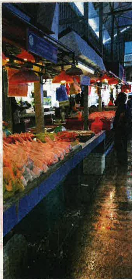
TINJAUAN harga ayam di pasar basah sekitar Jalan Raja Alang dan Datuk Keramat.