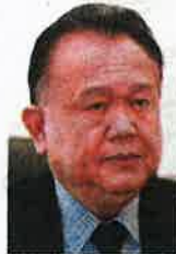
Datuk Seri Alexander Nanta Linggi

Nanta reminded all players in the supply chain not to take advantage of the country's borders reopening from April 1 and Ramadan by unnecessarily increasing the prices of goods or they would face action and fines.