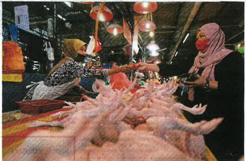
Customers buying chicken at a wet market in Kuala Lumpur yesterday.

In Selangor, Domestic Trade and Consumer Affairs Ministry had issued compounds to three wholesalers in Klang, Puchong