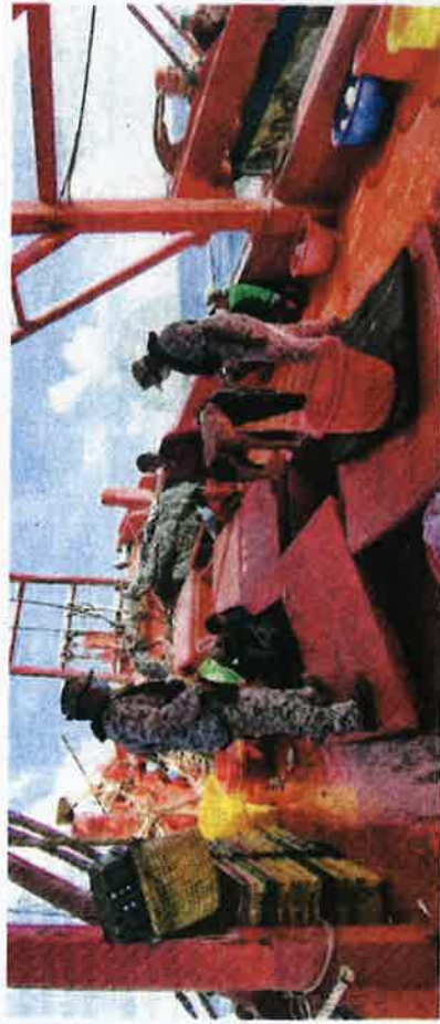
APMM menahak bot nelayan Vietnam yang menceroboh perairan negara di Kuala Mersing.