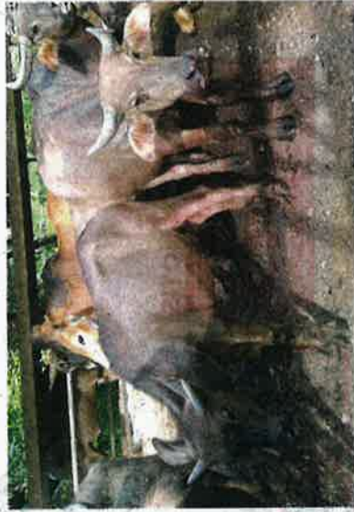
Penjual membuat persediaan dengan menambah bimbingan kerbau dan lembu bagi bekalan daging segar untuk peralihan perayaan Aidilfitri nanti.

"Anggaran dalam 10 ekor untuk raya kali ini dan empat daripadanya kami standby hari