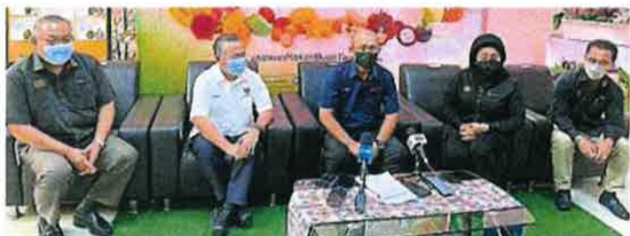
大马农业及食品工业部长罗纳建迪（中）召开新闻发布会，左起为联邦农业销售局局长再纳及砂农业现代化及区域发展部副部长（区域发展）玛丁册；右起为联邦农业销售局副局长拉西巴哈利及农业及食品工业部秘书长哈姆兹娜。

此外，罗纳建迪也分发50份援助品予弱势群体，以及分发澳洲予现场民众。陪同出席者，包括砂农业现代化及区域发展部副部长（区域发展）玛丁册、农业及食品工业部秘书长拿督哈姆兹娜、联邦农业销售局局长拿督再纳及副局长拉西巴哈利。