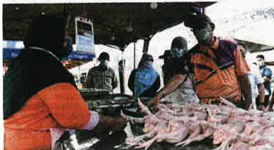
Izhah melawat gerai ayam selepas sidang media khas Jualan Prihatin Rakyat Mega sempena Aidilfitri di Pasar Tani Seksyen 13, Shah Alam, semalam.

"Pihak PKPS juga sudah mendapatkan satu syarikat yang berpengalaman dalam penanaman jagung untuk makanan ayam.