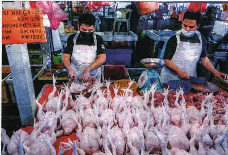
PENTERNAK mendakwa harga ayam dikawal kartel yang menentukan bekalan setiap hari ke pasaran.

ADA pihak-pihak keliru dengan fungsi MAFI sehingga penternak mendakwa mereka diperhambakan oleh kartel.