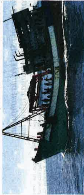
SATU daripada dua bot nelayan Vietnam yang ditahan APMM.

Katanya, kedua-dua bot ditahan APMM dalam rondaan operasi penguatkuasaan bersepadu Op Khas Pagar