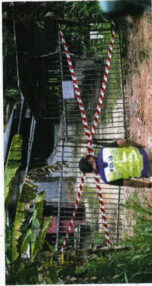
LADANG ternakan babi di Kampung Baru Site A, Tanah Merah.

Pada 8 April lalu, JPVNS mengesan kes pertama ASF di ladang di Kampung Baru Tanah Merah Site A dan me-ngambil tindakan melupus-kan semua 275 babi.