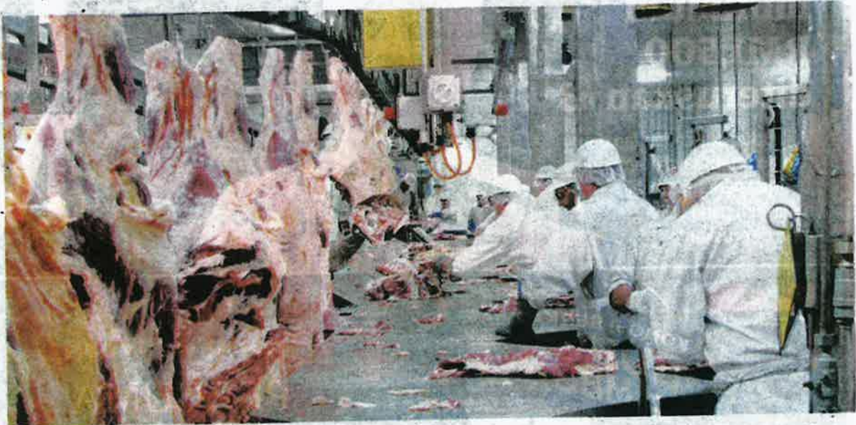
KERAJAAN perlu mengambil tindakan tegas termasuk mengkaji semula import daging sembelihan jika dakwaan cara sembelihan haiwan melanggar protokol benar-benar berlaku. - GAMBAR HIASAN