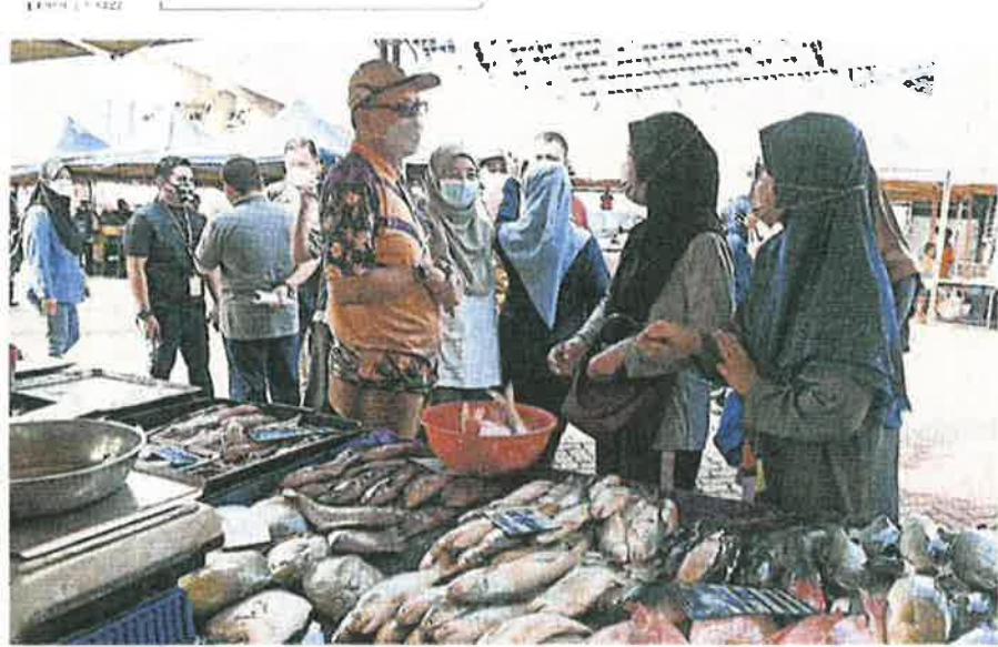
程 依兹汉(左)向两名民众了解过节采购食材的过

(沙亚南24日讯)随着开斋节将至,雪州政府拨款110万令吉,从明日起至5月2日的开斋节前夕,分阶段在州内29个地点举办关怀人民大减价促销活动(Jualan Prihatin Rakyat Mega),低价售卖开斋节6大应节食材,以减轻人民生活负担。