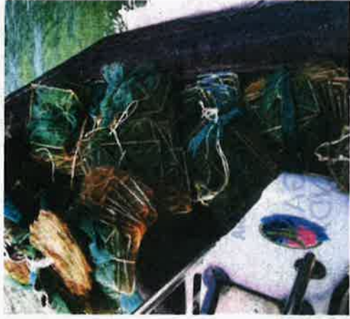
SEBAGIAN daripada 70 set bubu naga yang dirampas di lima lokasi di kedudukan 1.6 hingga 2.2 batu nautika barat laut perairan Sungai Udang, kelmarin.

Beliau berkata, pemilik bubu naga boleh didakwa mengikut Seksyen 11(3)(c) Akta Perikanan 1985 dan nelayan diingatkan supaya mematuhi undang-undang serta tidak melanggar syarat lesen perikanan yang diperuntukkan.