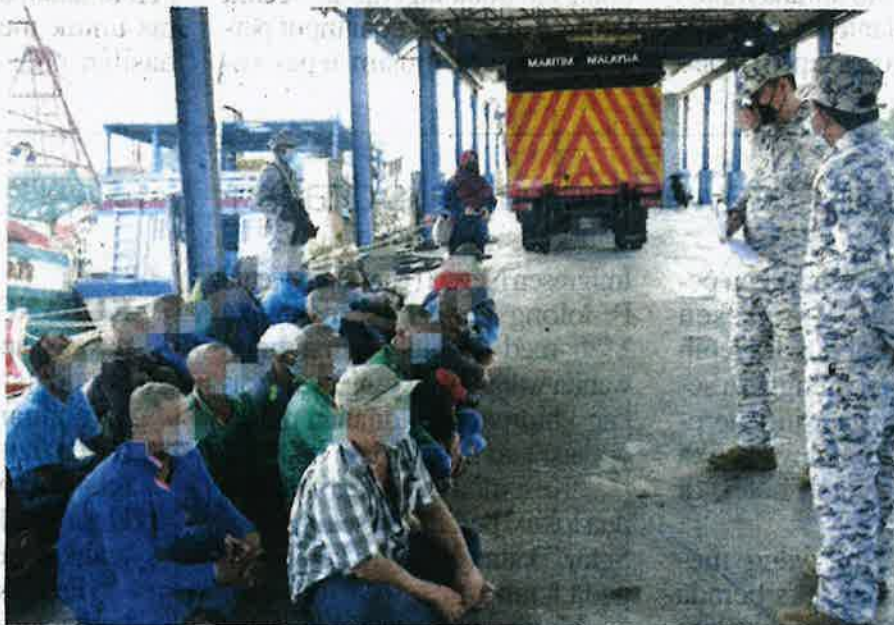
Seramal 21 kru termasuk tekong yang menaiki bot nelayan asing ditahan pada Sabtu selepas didapati menceroboh dan mencuri hasil laut di perairan negara.

KEMAMAN - Agensi Penguatkuasaan Maritim Malaysia (Maritim Malaysia) Zon Maritim Kemaman menahan 21 nelayan Vietnam termasuk tekong bersama dua tan hasil laut yang dicuri di perairan negara semasa rondaan dijalankan pada Sabtu.