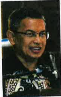
Merasmikan Halaqah Veterinar pada 12 Mei.