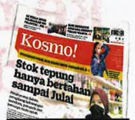
KERATAN muka depan Kosmo! semalam.

Beliau memaklumkan, kekurangan bekalan di sesuatu