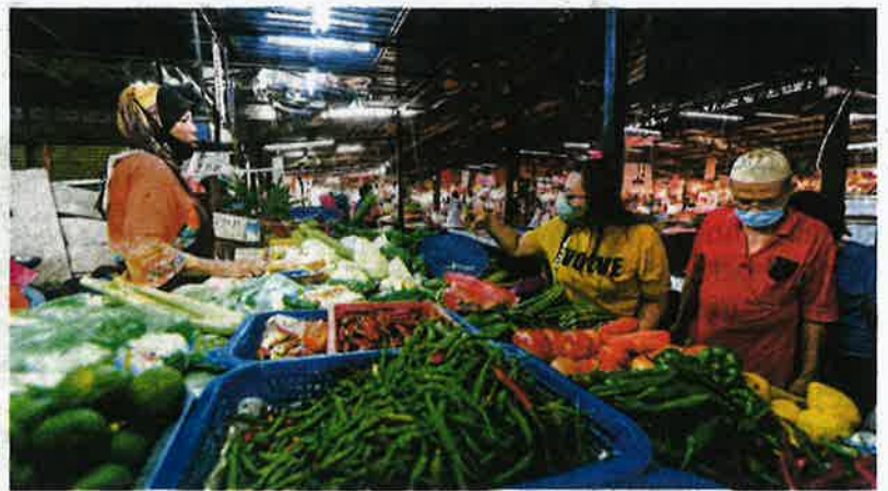
Peniaga melayan pelanggan yang membeli pelbagai keperluan ketika tinjauan di Pasar Datuk Keramat, Kuala Lumpur, semalam.

stok ayam langsung. Ada juga tempah daripada pembekal sebanyak 200 ekor tapi dapat 50 ekor sahaja dan pembekal terpaksa menaikkan harga lagi. "Ayam sebelum hari raya daripada pembekal RM3.20. Selepas raya RM3.40 dan kami jual pada harga RM9.30. Hanya untung sebanyak 70 sen sahaja."