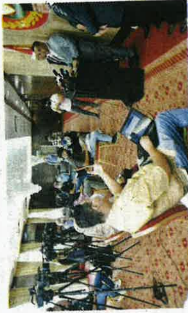
Sidang media mb Kedah.

"Tambahan pula sekarang ini musim menanam, air perlu masuk ke petak bendang, sekiranya gagal, kerja-kerja penanaman akan terbantut," tambah beliau.