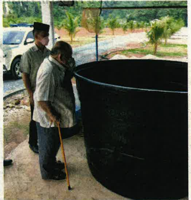
TUANKU Syed Sirajuddin Jamalullail meluangkan masa berangkat melawat ladang baginda di Kampung Bilal Udoh, Bukit Keteri, Padang Besar, Perlis.

"Apabila baginda berangkat melawat ladang iaitu sekurang-kurangnya dua kali seminggu, baginda suka mengambil buah durian belanda. Itu memang buah kegemaran baginda.