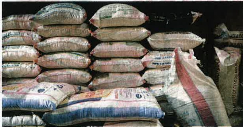
NAIKKAN tepung gandum didakwa hanya melibatkan jenis yang tidak bersubsidi sahaja.

malam melaporkan peruncit dan peniaga kini mula resah apabila pihak pemborong mendakwa bekalan tepung gandum hanya mampu bertahan setakat Julai ini berikutan kekurangan bahan utama untuk diproses di peringkat pengilang.