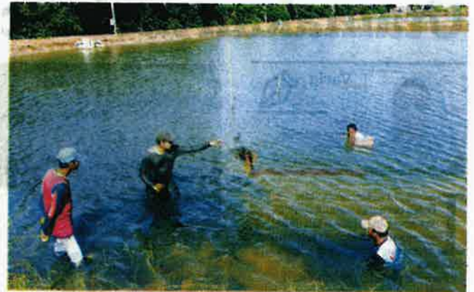
RUMPAI laut juga sesuai untuk dikultur di dalam kolam.

Dalam pada itu, katanya, berdasarkan penilaian dan ujian makmal berakreditasi, rumput laut gracilaria