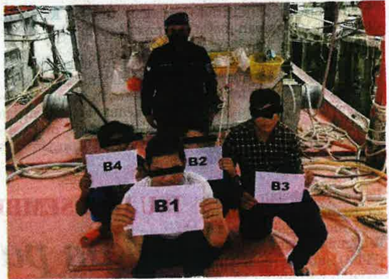
ANTARA nelayan Vietnam yang ditahan.