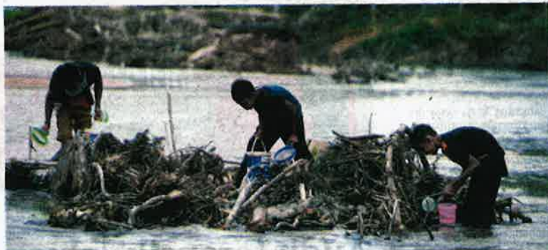
TIGA sahabat mencari benih ikan kelah bagi menampung perbelanjaan sekolah di Air Terjun Belukar Bukit, Hulu Terengganu. Terengganu.

Murid Sekolah Kebangsaan Betong itu berkata, benih ikan kelah merah dijual pada harga 40 sen seekor kepada seorang penternak di sini dan sepanjang Aidilfitri ini mereka mampu meraih lebih RM100 seorang.