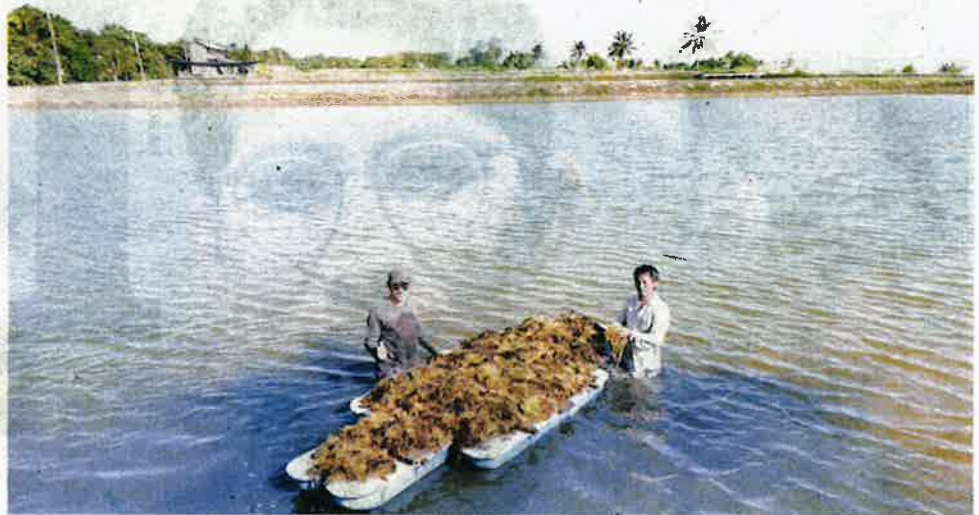
RUMPAL laut yang ada di kolam dikutip sebelum diproses untuk dikomersialkan.

Menurutnya, nilai global industri rumpai laut mencecah hingga RM64.5 bilion pada 2019 dengan penglibatan