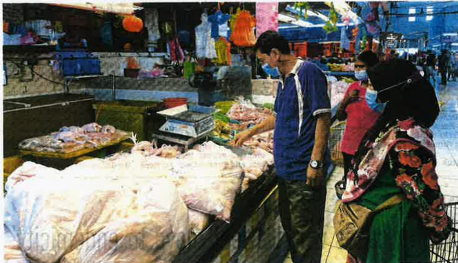
Customers surveying fresh chicken prices at a supermarket in Tampoi, Johor Baru, yesterday.

"We have never been charged transportation costs until the government enforced the con-