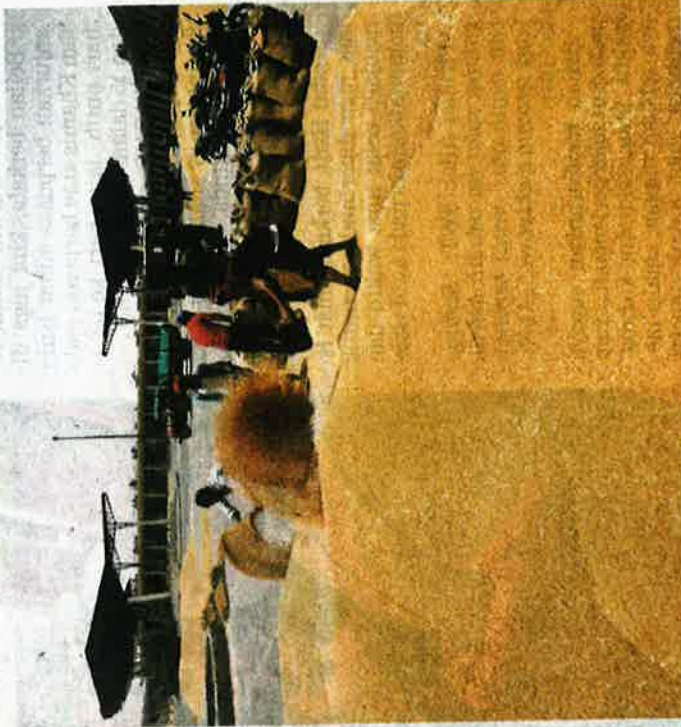
Pekerja mengisi gandum ke dalam gumi di sebuah gudang di Ahmedabad, India melarang eksport gandum ketika gelombang haba menjejaskan pengeluaran. (REUTERS)

Larangan eksport itu mendapat kritikan keras daripada kumpulan tujuh negara perindustrian (G7), yang berkata bahawa langkah sedemikian 'akan memburukkan lagi krisis' kenaikan harga komoditi. AFP