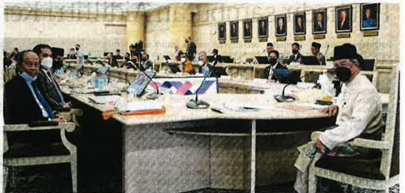
Muhyiddin ketika mempengerusikan Mesyuarat MPN di Putrajaya, semalam.

Pada 8 September 2020, Muhyiddin yang ketika itu Perdana Menteri mempengerusikan mesyuarat pertama Jawatankuasa Kabinet Mengenai Dasar Sekuriti Makanan Negara.