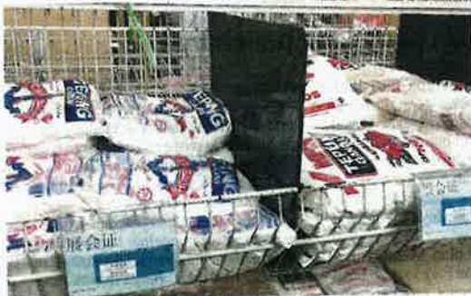
Tinjauan bekalan tepung gandum di sebuah pasar mini di Seksyen 30, Shah Alam dilihat masih mencukupi untuk pengguna.