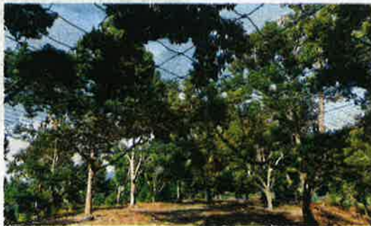
JARING dipasang di bawah pokok durian di kebun Chee Keat bagi mengelakkannya terkena tanah ketika gugur.

wan luar negara yang terkenal dengan gelaran 'hantu durian' di mana mereka membuat tempatan ketika pokok mengeluarkan bunga Mac lalu," katanya kepada Kosmo!