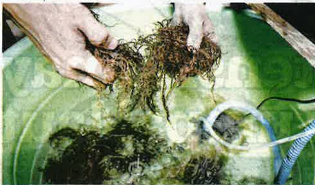
HASIL kajian mendapati, rumpai laut mempunyai banyak khasiat dan manfaat kesihatan kepada manusia.