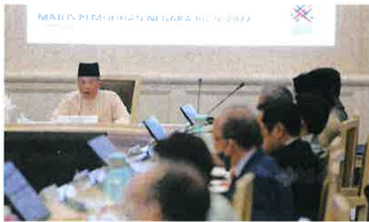
MUHYIDDIN ketika mempengerusikan mesyuarat Majlis Pemulihan Negara di Putrajaya.

Dua lagi kluster ialah Kluster Keselamatan Makanan dan Pemakanan di bawah Sekretariat Majlis Keselamatan Makanan dan Pemakanan Kebangsaan (MKMPK), Kementerian Kesihatan dan Kluster Kestabilan dan Kemampunan di bawah Kementerian Pertanian dan Industri Makanan dan Majlis Keselamatan Negara.