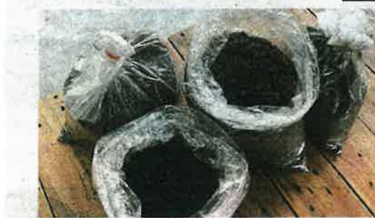
Che Roziani inspecting the Brazilian spinach grown at the PPR Beringin community garden. (Inset) Food waste processed into compost for plants.