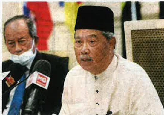
National Recovery Council chairman Tan Sri Muhyiddin Yassin speaking at the council's meeting at the Finance Ministry in Putrajaya yesterday.

so discussed the war in Ukraine and the lockdown in China due to Covid-19, which would affect the food supply chains and accelerate inflation.