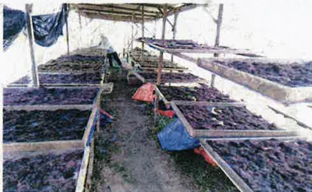
PROSES pengeringan rumpai laut dilakukan selepas dikutip dari kolam.