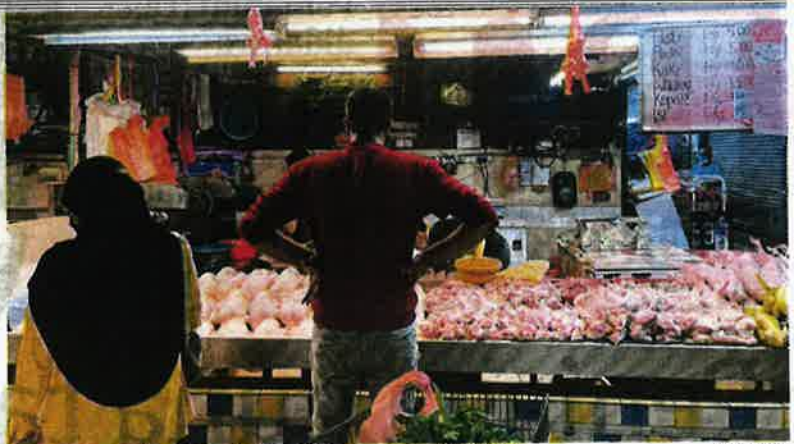
Tinjauan mendapati premis menjual ayam tidak memaparkan harga jualan ayam di sebuah pasar raya di Tampoi, Johor Bahru.

Katanya, kesalahan itu boleh membawa hukuman denda maksimum RM50,000 atau penjara