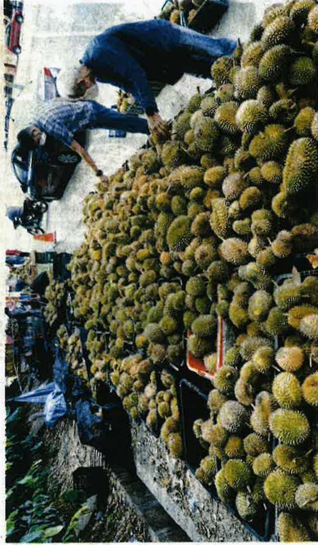
PERMINTAAN terhadap durian meningkat setiap tahun termasuk dari luar negara. - GAMBAR HIASAN

Ketika ini, raja buah itu menembusi China, Taiwan, Korea