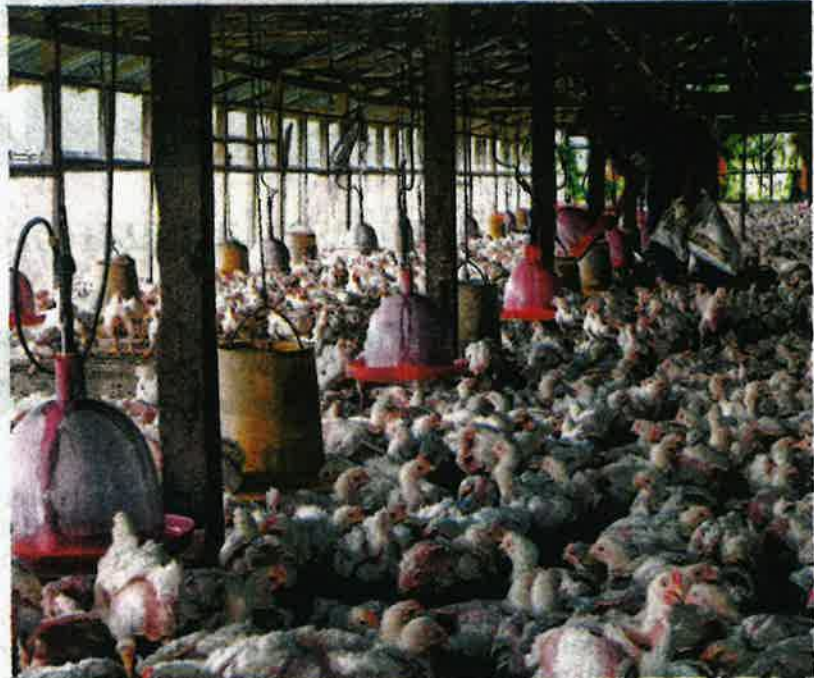
ADA kartel didakwa merancang menutup ladang ternakan ayam hujung minggu ini sebagai tanda protes kepada kerajaan. - GAMBAR HIASAN

Malah, hampir keseluruhan rantaian industri penternakan