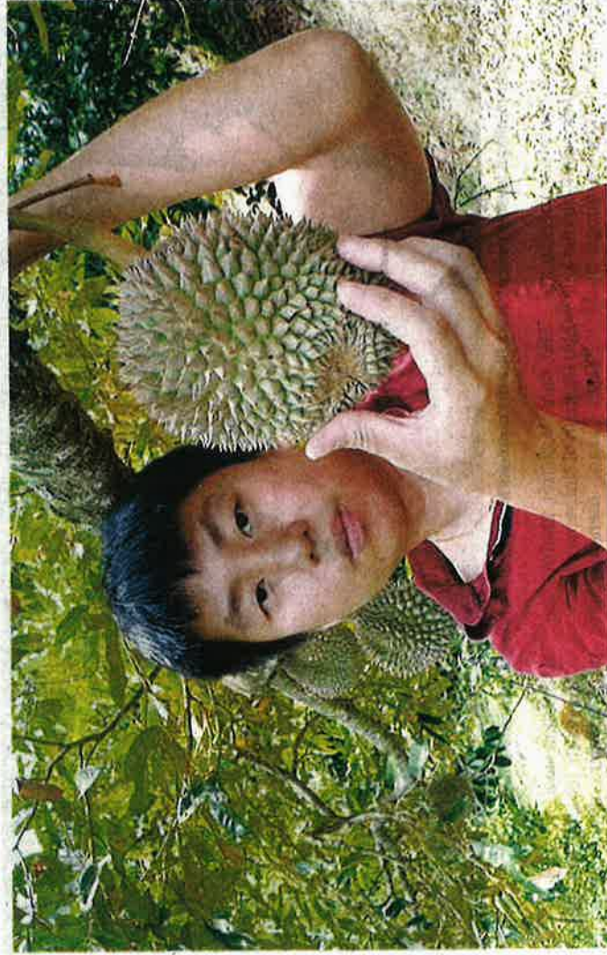
SEORANG pekebun di Balik Pulau menunjukkan durian duri hitam yang belum masak di kebunnya, namun sudah mendapat tempahan daripada penggemar.

"Selain rasanya yang enak dan buahnya lain daripada lain, saya