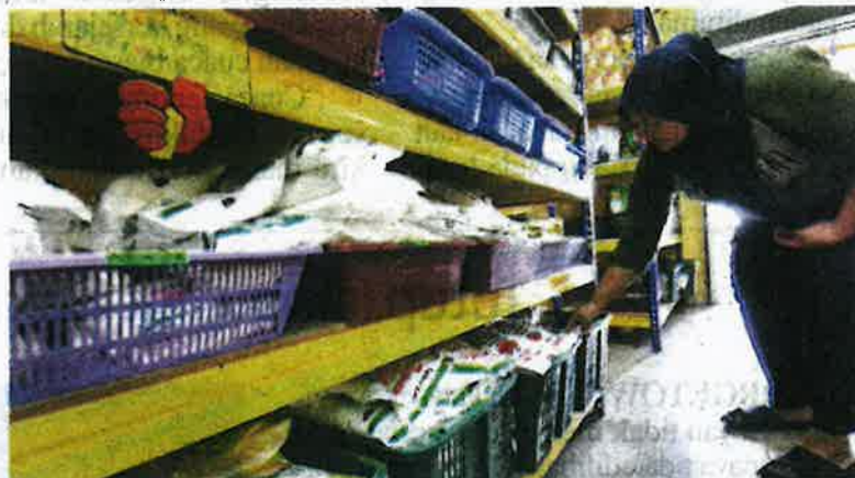
Pekerja sebuah kedai runcit di Kuala Terengganu menyusun tepung gandum pada bahagian rak kedai.