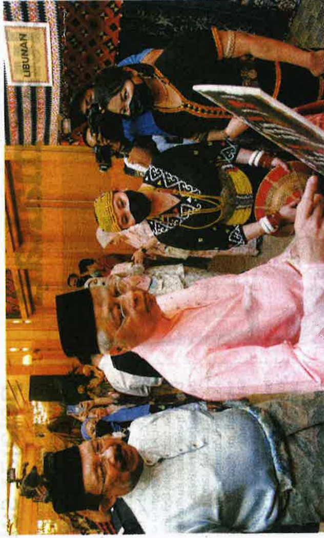
ISMAIL SABRI (dua dari kiri) semasa melawat geral hidangan pada Majlis Sambutan Aidilfitri Bersama Warga Jabatan Perdana Menteri 2022 di Dewan De'Seri Endon, Pusanitapur, Putrajaya semalam.

"Jadi kalau dahulu ada AP lembulah, daging dan macam-macam lagi, mulai hari ini (semalam), tiada AP lagi diperluaskan berkuat kuasa serta-merta," katanya kepada pemberita di sini semalam.