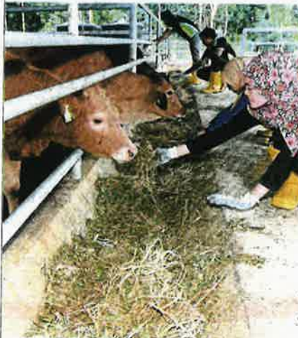
Penyelidikan dan pembangunan berkaitan industri ruminan perlu dipergiatkan lagi sehingga ke tahap pengkomersialan. (Foto hiasan)

Penternak kecil dan sederhana juga berpotensi