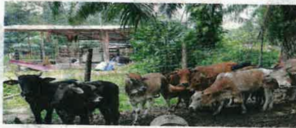
Kawasan tanah yang luas di perkampungan Felda menjadikan ia lokasi sesuai untuk mengusahakan ladang ternakan secara komersial.