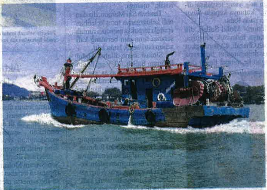
Bot nelayan tempatan kelas C yang ditahan pada Selasa disita untuk tindakan selanjutnya.

Tambahnya, bot nelayan tempatan yang berpangkalan di Batu Maung, Bayan