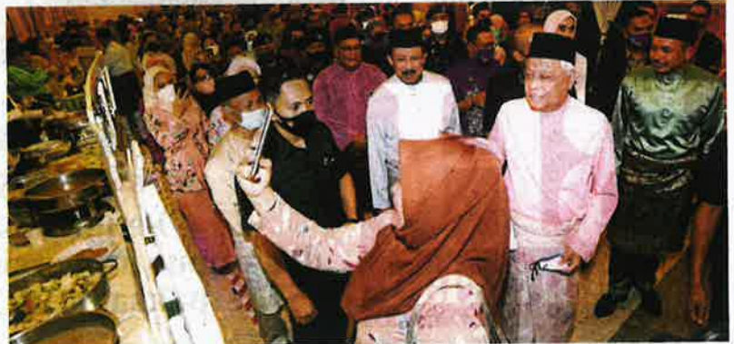
Ismail Sabri bersama kakitangan pada majlis sambutan Aidilfitri Perdana Menteri Bersama Warga Jabatan Perdana Menteri 2022 di Putrajaya, semalam.

Ditanya mengenai ugutan sekumpulan penternak ayam untuk menutup ladang mereka hujung minggu ini tanda protes kelewatan kerajaan membayar subsidi ayam, Perdana Menteri meminta penternak supaya segera membuat tuntutan untuk subsidi