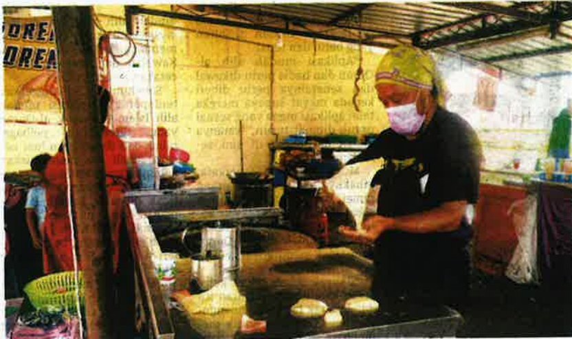
PENIAGA roti canai di Arau semalam mula bimbang sekiranya bekalan tepung gandum yang didakwa hanya mampu bertahan setakat Julai ini benar-benar berlaku.

lan tepung gandum hanya mampu bertahan sehingga Julai sahaja. Kalau ia benar-benar berlaku, kami tidak ada pilihan lain terpaksa berehatlah daripada membuat roti canai.