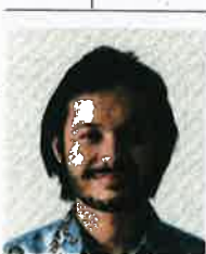
Pensyarah Fakulti Perubatan Veterinar, Universiti Malaysia Kelantan (UMK)