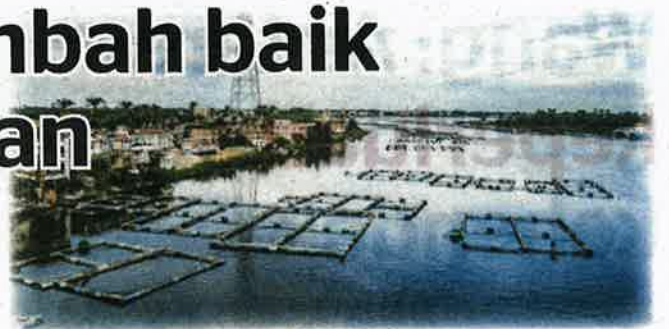
FAO sedang menguji algoritma yang boleh mengira kuantiti tuai yang mampan tanpa bahaya eksploitasi berlebihan bagi industri perikanan di lembangan Nil.

"Jika dahulu, ia merupakan proses yang menelan kos yang sangat mahal dan memakan masa lama sus-