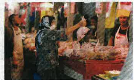
PENGUNJUNG memilih ayam bersih yang dijual di Pasar Chow Kit, Kuala Lumpur.

"Ia bagi memastikan keperluan asas berkenaan dapat diperoleh lebih ramai pembeli namun perlu mendapat kebenaran pihak KPDNHEP terlebih dahulu," katanya.