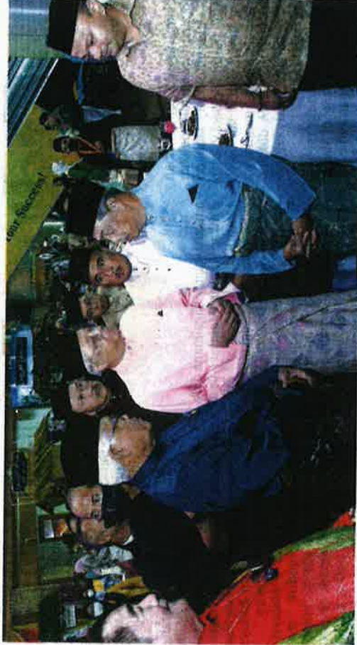
ISMAIL Sabri Yaakob ketika hadir dalam Majlis Sambutan Aidilfitri Bersama Warga Jabatan Perdana Menteri 2022 di Putrajaya, semalam.

Utusan Malaysia semalam melaporkan, sekumpulan kar-