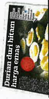
KERATAN Kosmo' semalam.

bertuah dan 'ong'. Ini kerana tidak semua peminat dapat menikmati isinya sebelum buah itu luruh sepenuhnya Jun