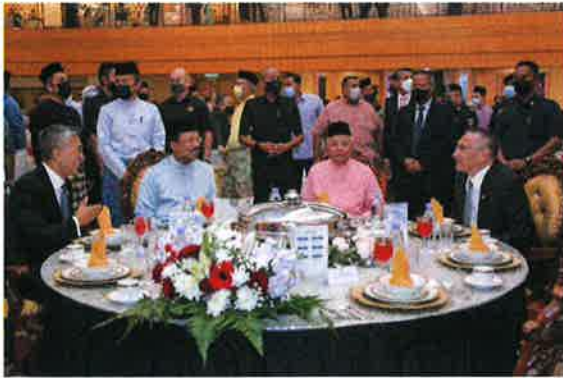
ISMAIL Sabri Yaakob ketika hadir pada Majlis Sambutan Aidilfitri Bersama Warga Jabatan Perdana Menteri 2022 di Putrajaya.

PUTRAJAYA: Kementerian Pertanian dan Industri Makanan (MAFI) diminta menyejajarkan pembayaran subsidi harga ayam sebanyak 60 sen kepada penternak sebagaimana dijanjikan kerajaan sebelum ini.