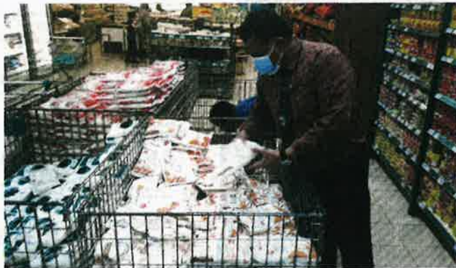
MAS Imran menunjukkan bekalan tepung gandum yang terhad di Pasaraya Econsave Cash and Carry cawangan Taman Scientex, Pasir Gudang.