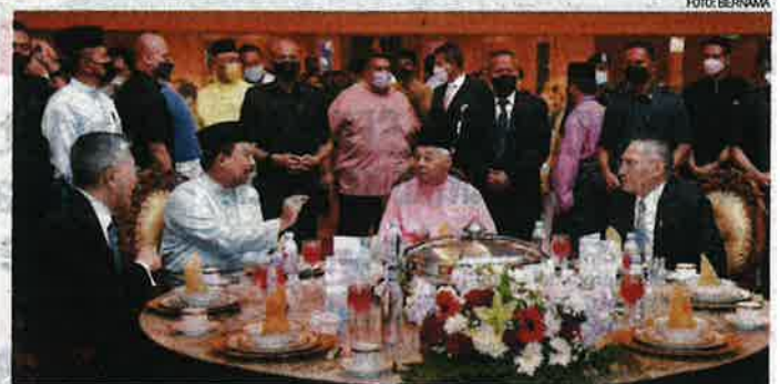
Ismail Sabri (duduk dua dari kanan) ketika Majlis Sambutan Aidilfitri Jabatan Perdana Menteri di Putrajaya pada Rabu.

Konflik Rusia-Ukraine memberi kesan kepada seluruh dunia apabila inflasi pelbagai negara terus meningkat.