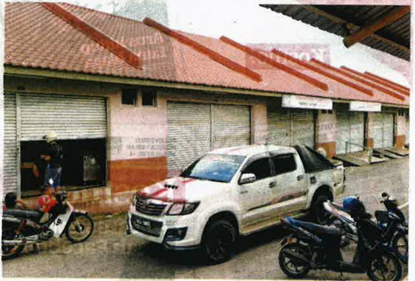
PENDUDUK mula berdepan 'krisis' ketidadaan ayam selepas lapan premis di Pasar Besar Jerantut terpaksa ditutup berikutan tidak menerima bekalan.

"Saya meminta agar kerajaan dan pihak berkuasa mengambil tindakan tegas sekiranya terdapat manipulasi daripada pihak tertentu yang mahu untung lebih sehingga menyukarkan kehidupan orang ramai," katanya.