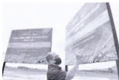
SMART akan dilaksanakan di kawasan padi seluas 150,000 hektar di seluruh negara secara berperingkat.

PUTRAJAYA , Kementerian Pertanian dan Negeri Melayu (MAFI) mengumumkan bahawa pihaknya akan melaksanakan program Smart Rice (SMART) di kawasan padi seluas 150,000 hektar di seluruh negara secara berperingkat.