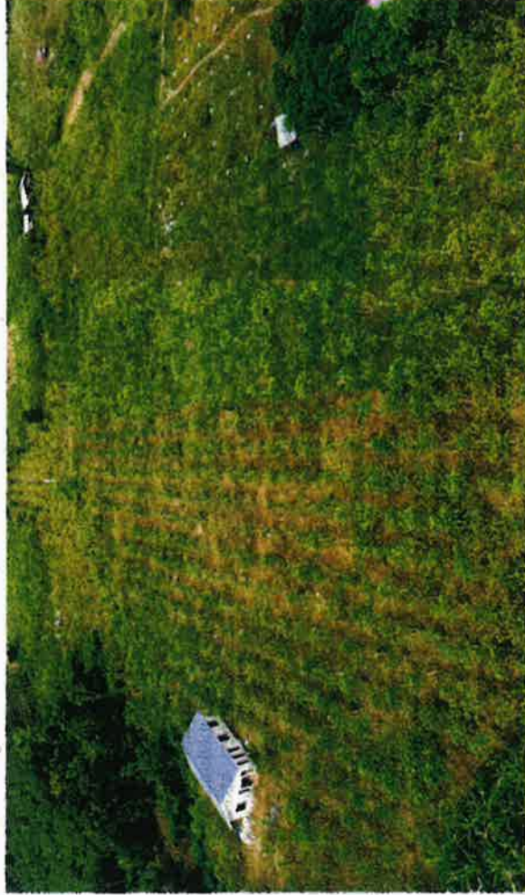
SEBAHAGIAN daripada kawasan tanaman ketum yang dusahakan di daerah Padang Terap, Kedah.

Malah, pengumuman kerajaan Thailand mengeluarkan ketum daripada senarai dadah berbahaya, sekali gus membolehkannya digunakan secara terbuka di negara itu pada Ogos