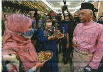
Enjoying the festivities: Ismail Sabri mingling with participants at the Hari Raya Aidilfitri gathering in Putrajaya.

He said the effects of the Russia-Ukraine war on food supply was a