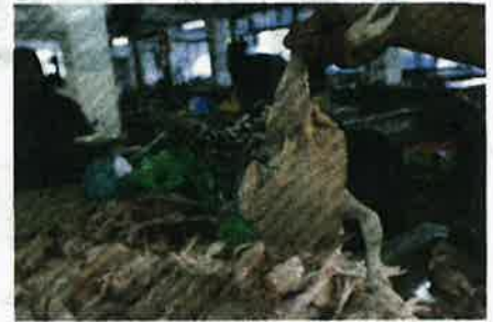
TINJAUAN di Pasar Berek 12, Kota Bharu mendapati kebanyakan peniaga ayam segar tidak mempamerkan harga ayam sekilogram yang dijual.

"Negara bergantung 85 peratus gandum dari Australia, manakala 15 peratus lagi dari Amerika Syarikat (AS), Ukraine dan India. Jadi larangan dari India tidak beri kesan secara jilid," katanya.