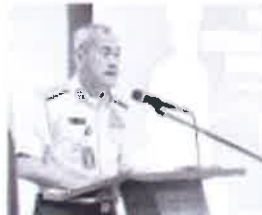
Pengerusi Lembaga Gabenor USM KETUAL senarai penerima darjah kebesaran Perlis.

AKSB menegaskan bahawa telaga jejeri ini adalah projek yang berjaya.