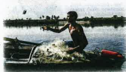
Seorang nelayan sedang menjala ikan di Sungai Nil, yang mana Lembangan sungai ini adalah tapak skim baharu menggunakan AI untuk menjejak stok ikan yang dijangka akan meningkatkan kemampuan penangkapan ikan di rantau ini.