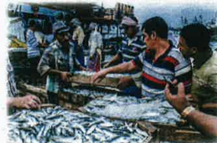
Seorang pekerja menjual ikan yang baru ditangkap di Jeti di bandar Mesir Ezbet el-Borg di sepanjang cawangan Damietta di delta Sungai Nil.

lan dilakukan oleh pemerhati di atas kapal, pengesanan spesies ikan menggunakan teknologi canggih itu kini sebaliknya boleh menjadi begitu terperinci sehinggalah data yang diperolehi itu juga boleh menentukan kesegaran ikan.